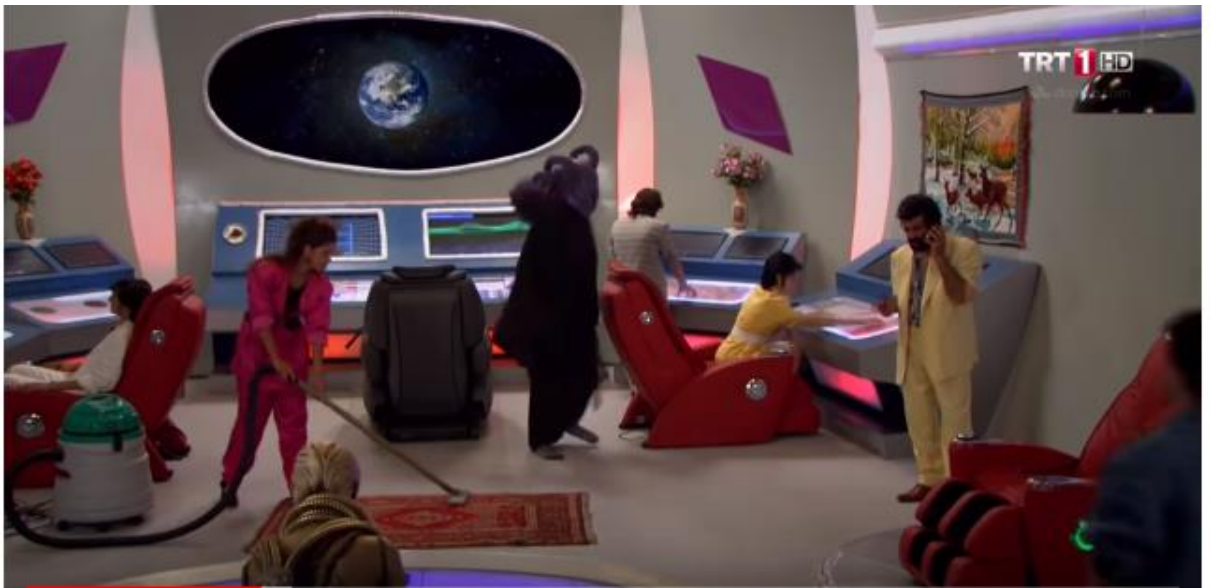
Şekil 3 3Leyla ile Mecnun Uzay Sahnesi 27.bölüm 15:00:00

Leyla hava almak için evden dışarı çıkmak ister ama annesi izin vermez. Leyla sinirlenip balkona çıkar ve bir uzaylının taşını aldığı görür ve balkondan bağırmaya başlar. Leyla'nın bağırduğunu duyan annesi kime bağırduğunu sorar, uzaylıya bağırduğunu söyleyen Leyla'ya annesi hasta muamelesi yapar.