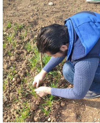
Şekil 3.4. Parsellerde bitki sayımı

Metrekarede Sap Sayısı (adet/m 2 ): Sapa kalkma dönemi başlangıcında belirli bir alandaki (0.15 m 2 ) sapların (anasap dahil) sayılıp birim alana hesaplanmasıyla elde edilmiştir.