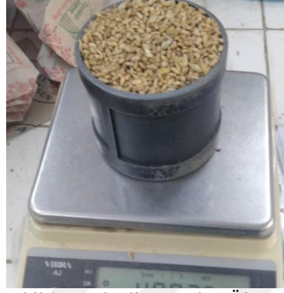
Şekil 3.5.Hektolitre ağırlığı Ölçümü

Hektolitre ağırlığı (Kg hl -1 ): Bir litrelik hektolitre ölçü kabı kullanılarak, her parsele ait ürün ile tamamen doldurulmuş olan hektolitre kabındaki dane ağırlığı, 100 ile çarpılarak hesaplanmıştır (Şekil 3.5).