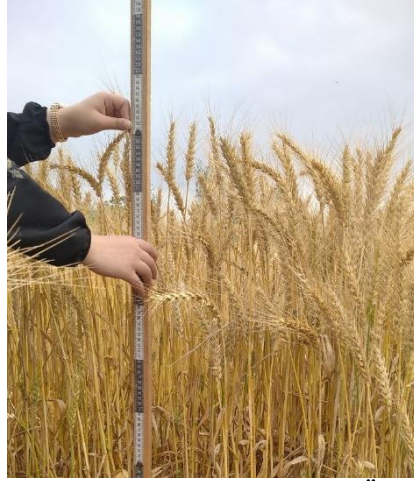
Şekil 3.3. Denemede Bitki Boyu Ölçümü

Başak Sap Uzunluğu (cm): Her parselde rastgele seçilen 10 bitkinin bayrak yaprak boğumu ile başak eksenindeki uzunluk olarak saptanmıştır.