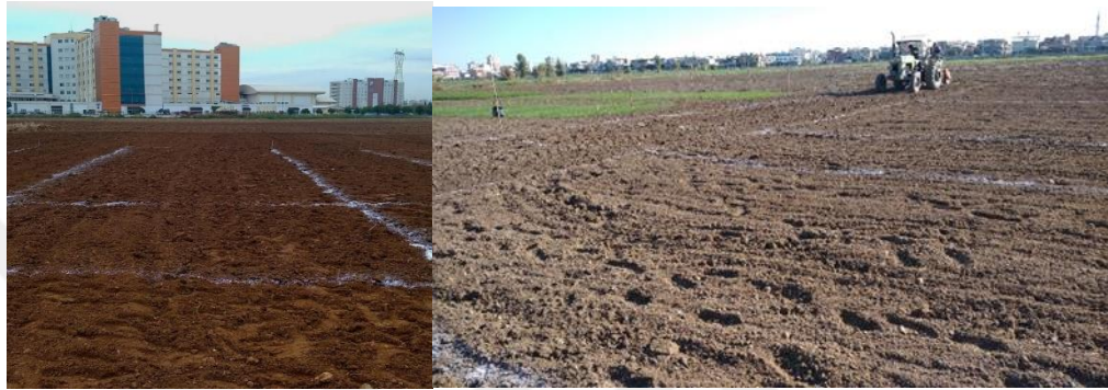
Şekil 3.2. Deneme Alanının Ekime Hazırlanması

Deneme, Gökhan çeşidine ait buğday tohumları, bitki sıklığı, metrekareye 500 bitki düşecek şekilde 8 sıralı 15 cm sıra aralıklı mibzer ile 6 metre uzunluğundaki parsellere Şekil 3.2’de ana hatları işaretleniş alana ekimi yapılmıştır.