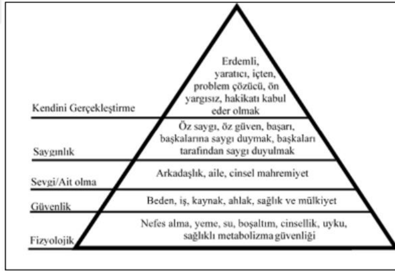
Şekil 2.1 Maslow'un İhtiyaçlar Piramidi

Görüldüğü üzere, bireyin öz saygı ihtiyacının karşılanabilmesi için fizyolojik ihtiyaçlarının, güvenlik ihtiyacının ve sevgi ihtiyacının karşılanmış olması gerekir (Maslow, 1970). Benlik saygısından bahsedebilmek için sevilme ve ait olma duyguları doyurulmuş olmalıdır. Bu ihtiyaçların doyurulmadığı noktada benlik saygısından bahsetmenin mümkün olmadığını söylemek doğru olacaktır. Ülkemizde ve dünyada bunu destekleyen çok fazla çalışma bulunmaktadır.