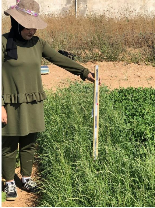
Şekil 3.3. Tür ve karışımlarda bitki boyunun belirlenmesi