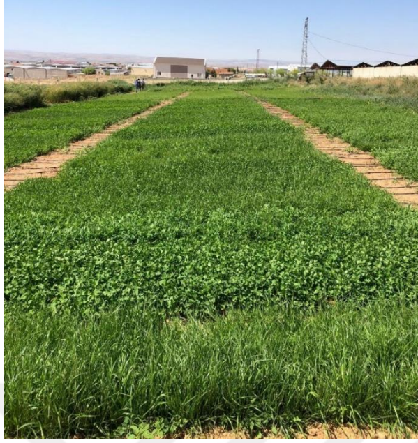
Şekil 3.2. Üst gübreleme öncesi tür ve karışımların genel görünümü

Araştırmada I. biçim zamanı tomurcuklanma ve çiçeklenme başlangıcı (baklagillerde kömeçlerin oluştuğu ve ilk çiçeklerin görüldüğü dönem), II. biçim zamanı %50 çiçeklenme (parseldeki baklagillerin %50 çiçeklendikleri dönem) ve III. biçim zamanı tam çiçeklenme (baklagillerin tamamının çiçeklendiği dönem) olmak üzere üç farklı biçim zamanı uygulanmıştır. Hasat zamanına kadar 3 kez sulama ve, bitkiler sıra aralarını kapatıncaya kadar gerektiğinde yabancı ot mücadelesi yapılmıştır. Birinci biçim 23 Ağustos, ikinci biçim 8 Eylül ve üçüncü biçim 15 Eylül 2023 tarihinde yapılmıştır. Parsellerden hasat yapılırken her parselden öncelikle kenarlarda bulunan bir sıra ve parselin başından ve sonundan 50 cm kenar tesiri olarak ayrılmıştır. Her parselden kenar tesiri dışında kalan alandan kuru ot verimini ve botanik kompozisyonu belirlemek için 500 gr yaş ot örneği alınmıştır.