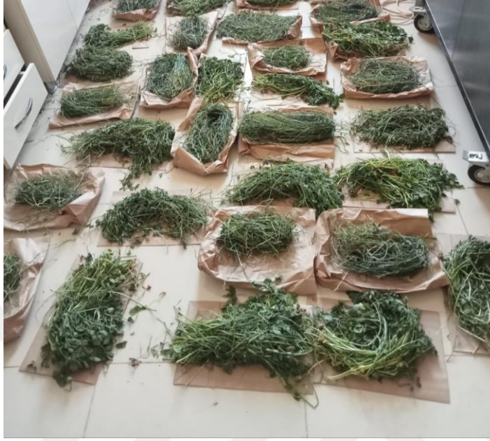
Şekil 3.5. Türlerin botanik kompozisyona ayrılması

Alınan 500 g yaş örnekler türlerine ayrılarak kurutulup tartılmış ve belirlenen baklagil kuru ağırlığı karşımın toplam kuru ot ağırlığına oranlanarak baklagil oranı belirlenmiştir (Kielly ve ark., 1994).