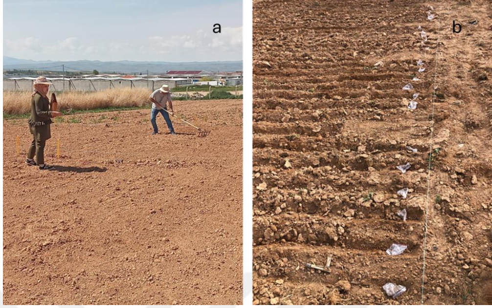
Şekil 3.1. a) Parselizasyon, b) Tür ve karışımların ekimi