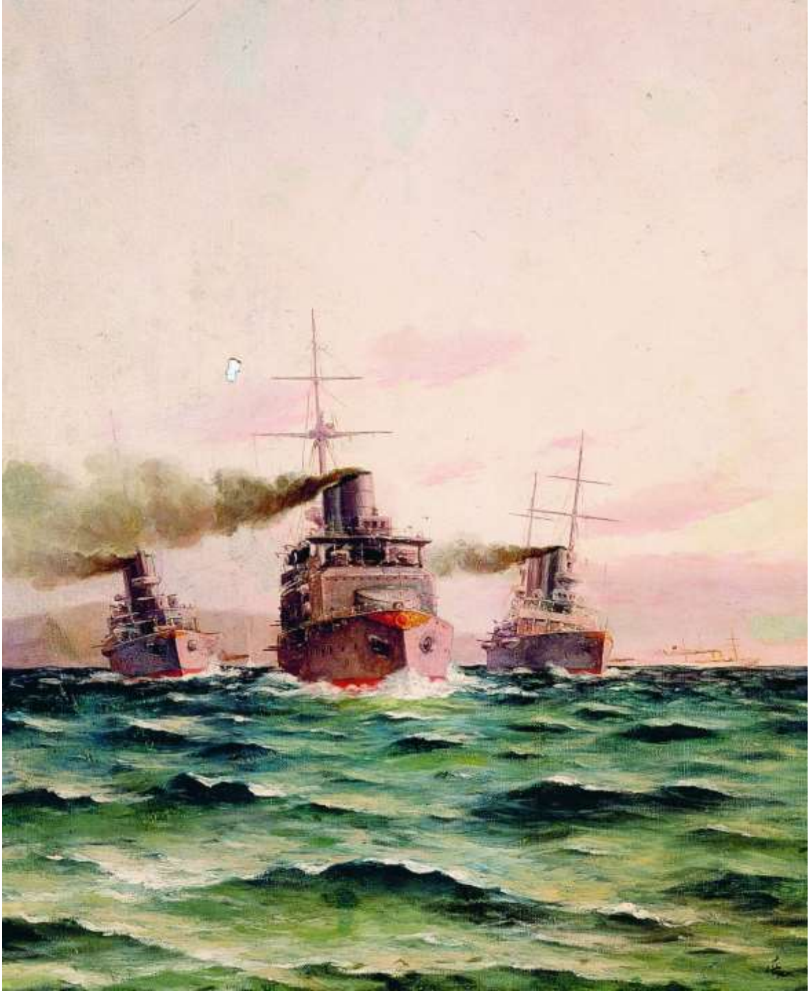
EK-III: Gamble Paşa'nın Osmanlı Donanmasında Gerçekleştirdiği Tatbikat Gemileri.