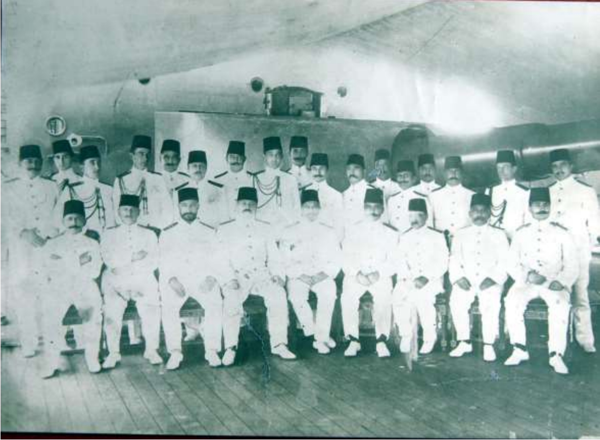
EK-I: Gamble Paşa ve Heyeti.