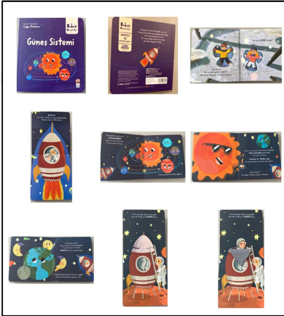
Görsel 4.16. Güneş Sistemi Kitabı Kapak ve Resimli İç Sayfa Tasarımı (Odabaşı 2024)

Güneş Sistemi kitabı iç ve dış yapı özellikleri kategorilerinde ve dış yapı özelliklerinde tasarım öge ve ilkeleri alt başlığında incelenecektir. Dış yapı özelliklerinde boyut, kâğıt, tipografi, resimleme, sayfa düzeni yer almaktadır.