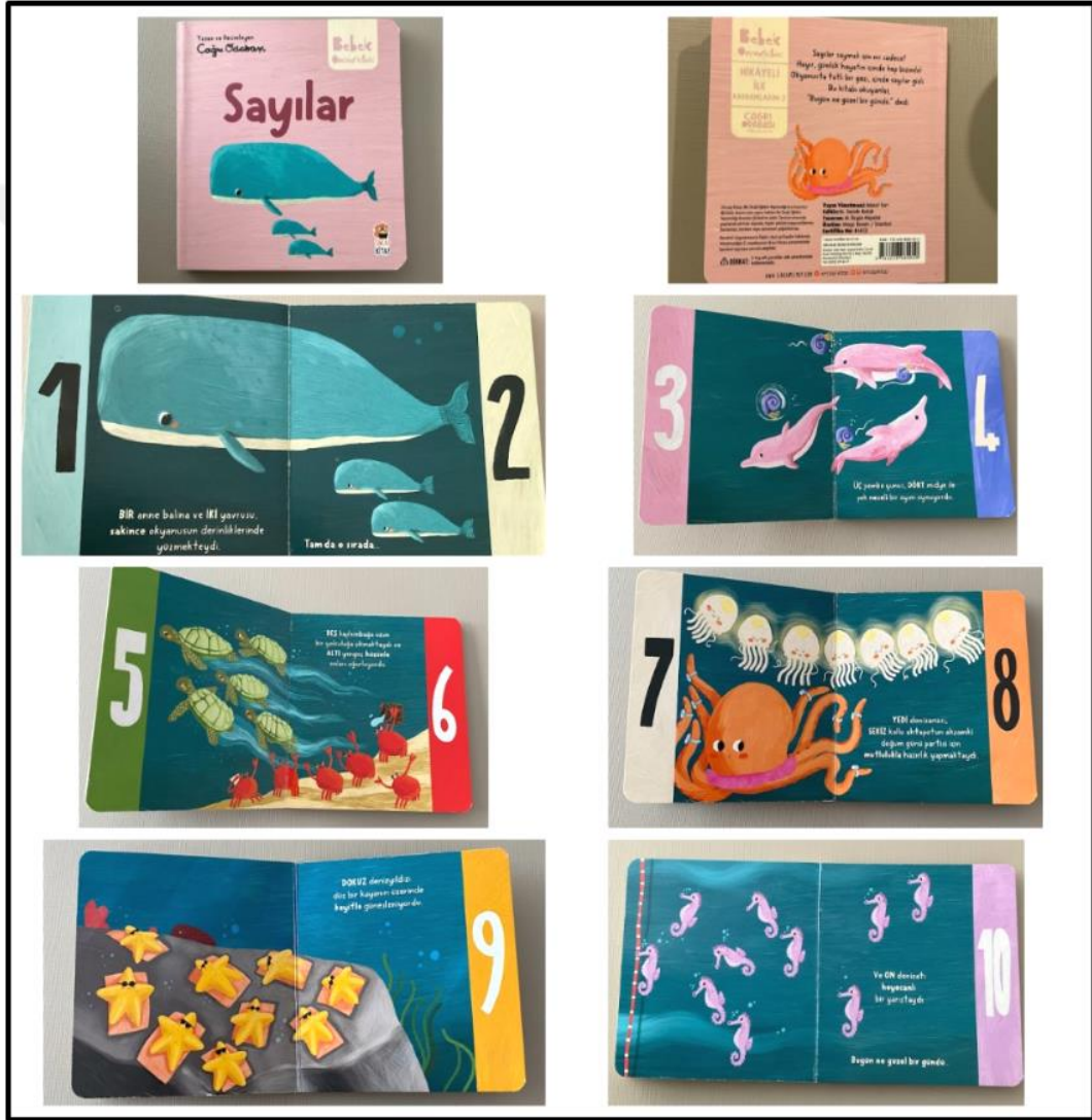
Görsel 4.5. Sayılar Kitabı Kapak ve Resimli İç Sayfa Tasarımı (Odabaşı 2022)

Sayılar kitabı iç ve dış yapı özellikleri kategorilerinde ve dış yapı özelliklerinde tasarım öge ve ilkeleri alt başlığında incelenecektir. Dış yapı özelliklerinden boyut, kapak-cilt, kâğıt, tipografi, resimleme, sayfa düzeni yer almaktadır.