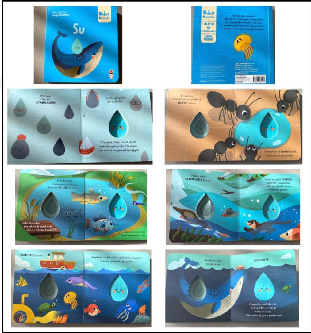
Görsel 4.14. Su Kitabı Kapak ve Resimli İç Sayfa Tasarımı (Odabaşı 2024)

Su kitabı iç ve dış yapı özellikleri kategorilerinde ve dış yapı özelliklerinde tasarım öge ve ilkeleri alt başlığında incelenecektir. Dış yapı özelliklerinde boyut, kâğıt, tipografi, resimleme, sayfa düzeni yer almaktadır.