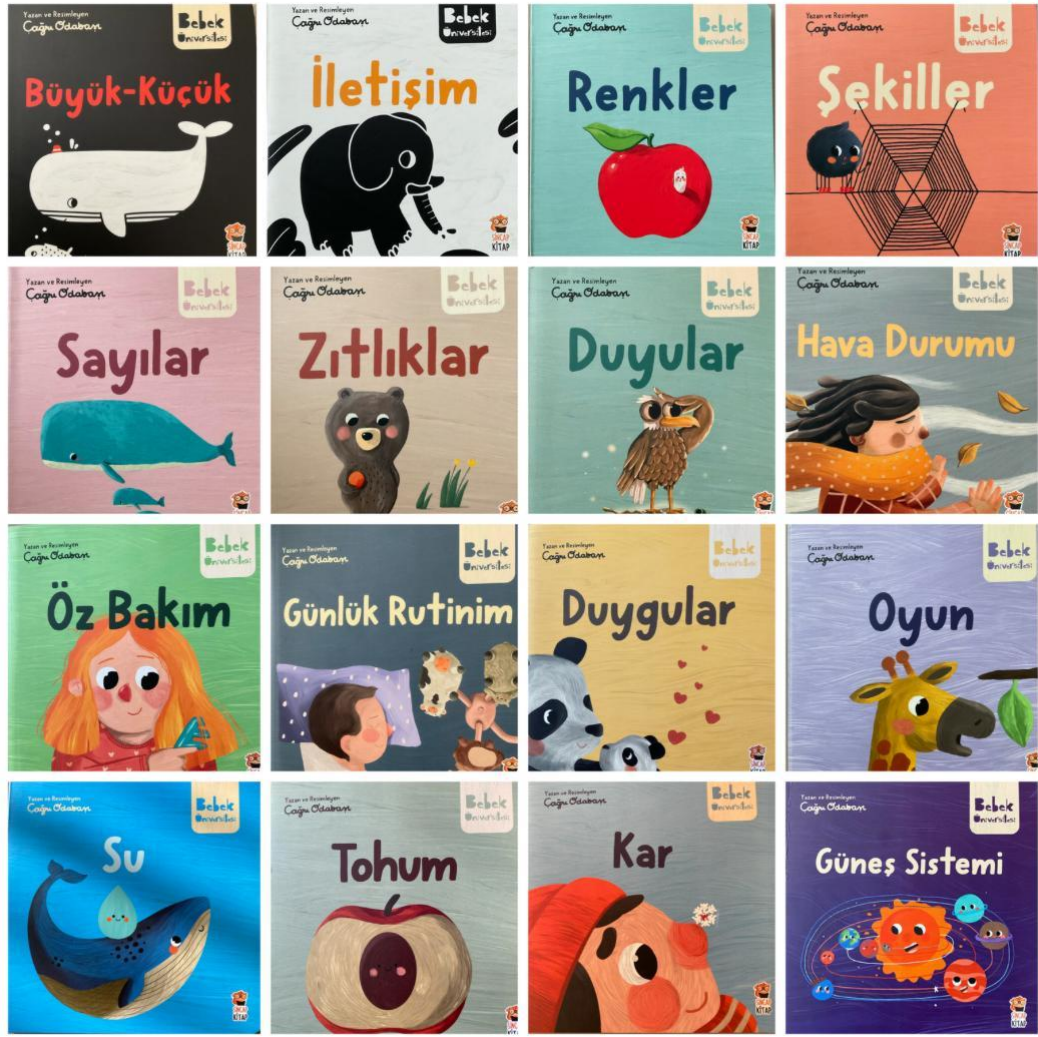
Görsel 3.1. Bebek Üniversitesi Serisi