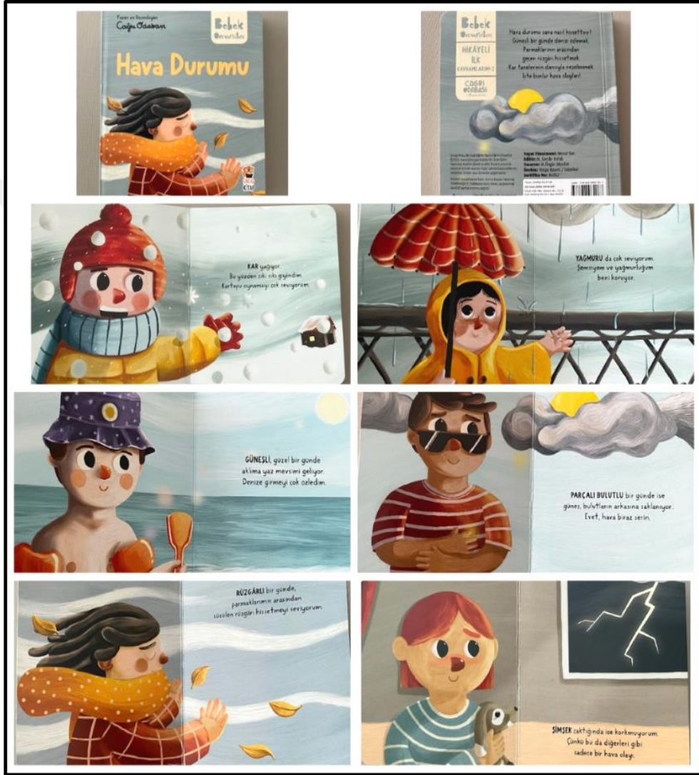
Görsel 4.8. Hava Durumu Kitabı Kapak ve Resimli İç Sayfa Tasarımı (Odabaşı 2022)

Hava Durumu kitabı iç ve dış yapı özellikleri kategorilerinde ve dış yapı özelliklerinde tasarım öge ve ilkeleri alt başlığında incelenecektir. Dış yapı özelliklerinde boyut, kâğıt, tipografi, resimleme, sayfa düzeni yer almaktadır.