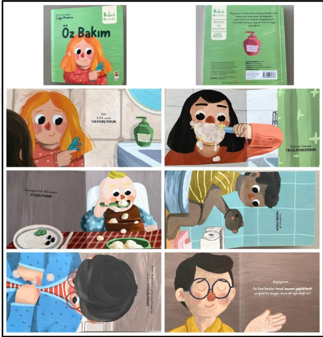
Görsel 4.10. Öz Bakım Kitabı Kapak ve Resimli İç Sayfa Tasarımı (Odabaşı 2023)

Öz Bakım kitabı iç ve dış yapı özellikleri kategorilerinde ve dış yapı özelliklerinde tasarım öge ve ilkeleri alt başlığında incelenecektir. Dış yapı özelliklerinde boyut, kâğıt, tipografi, resimleme, sayfa düzeni yer almaktadır.