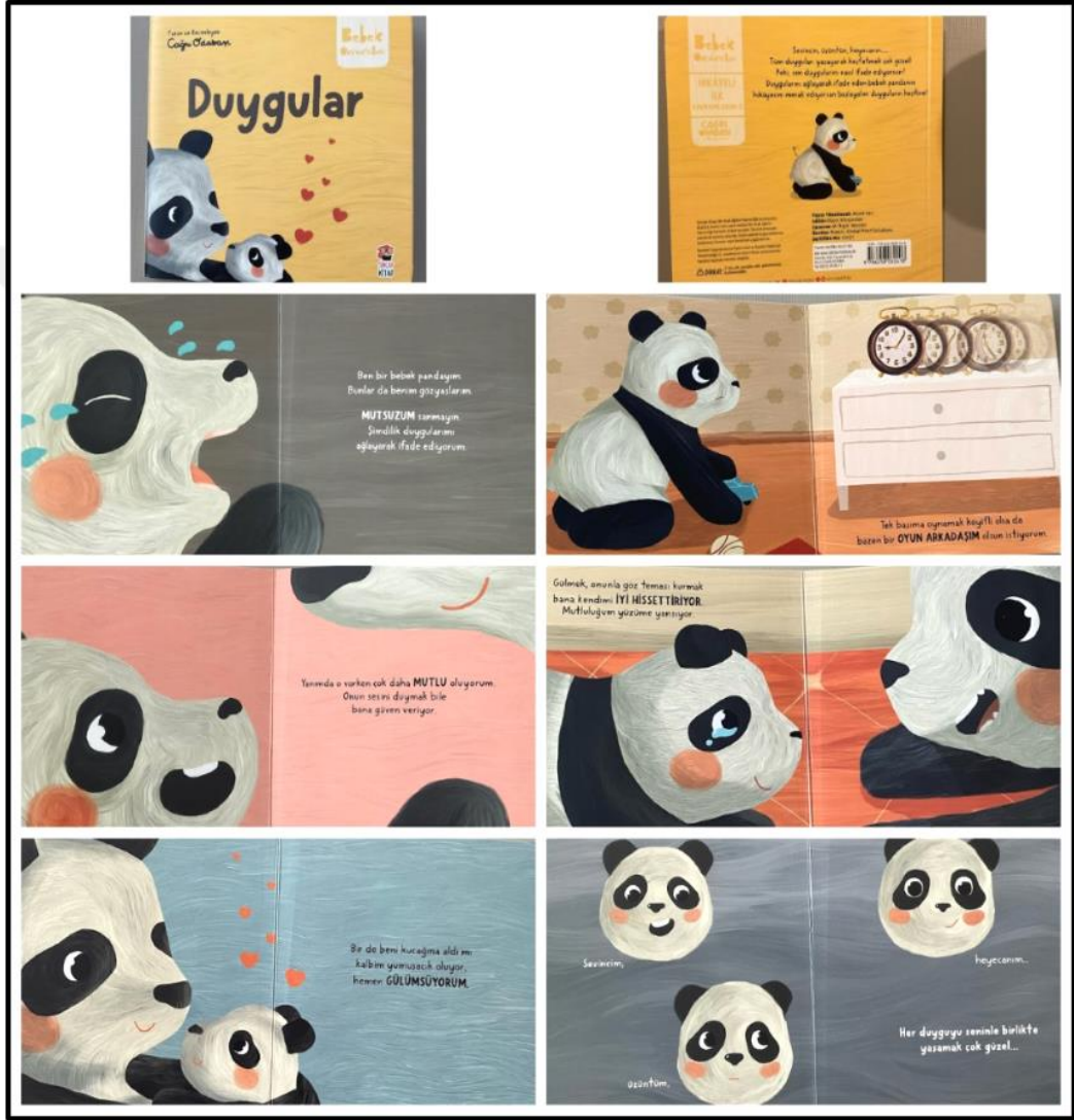
Görsel 4.11. Duygular Kitabı Kapak ve Resimli İç Sayfa Tasarımı (Odabaşı 2023)

Duygular kitabı iç ve dış yapı özellikleri kategorilerinde ve dış yapı özelliklerinde tasarım öge ve ilkeleri alt başlığında incelenecektir. Dış yapı özelliklerinde boyut, kâğıt, tipografi, resimleme, sayfa düzeni yer almaktadır.