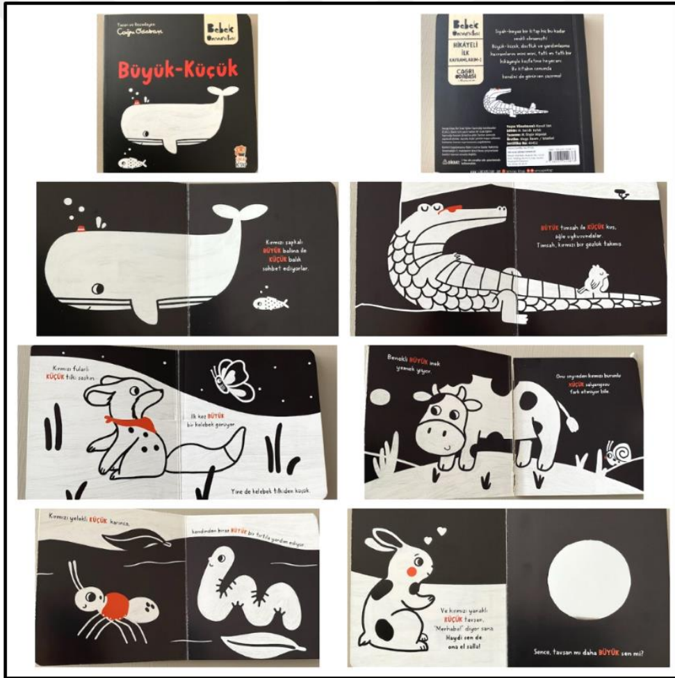
Görsel 4.1 Büyük-Küçük Kitabı Kapak ve Resimli İç Sayfa Tasarımı (Odabaşı 2022)

Büyük- küçük kitabı iç ve dış yapı özellikleri kategorilerinde ve dış yapı özelliklerinde tasarım öge ve ilkeleri alt başlığında incelenecektir. Dış yapı özelliklerinde boyut, kâğıt, tipografi, resimleme, sayfa düzeni yer almaktadır.