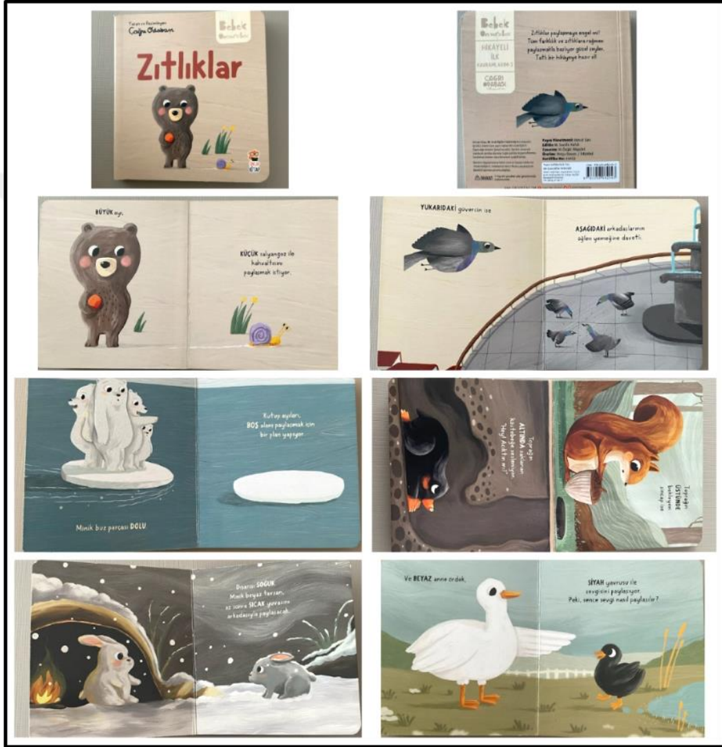
Görsel 4.6. Zıtlıklar Kitabı Kapak ve Resimli İç Sayfa Tasarımı (Odabaşı 2022)

Zıtlıklar kitabı iç ve dış yapı özellikleri kategorilerinde ve dış yapı özelliklerinde tasarım öge ve ilkeleri alt başlığında incelenecektir. Dış yapı özelliklerinde boyut, kâğıt, tipografi, resimleme, sayfa düzeni yer almaktadır.