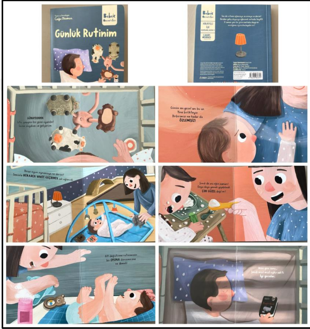
Görsel 4.9. Günlük Rutinim Kitabı Kapak ve Resimli iç sayfa Tasarımı (Odabaşı 2023)

Günlük Rutinim kitabı iç ve dış yapı özellikleri kategorilerinde ve dış yapı özelliklerinde tasarım öge ve ilkeleri alt başlığında incelenecektir. Dış yapı özelliklerinde boyut, kâğıt, tipografi, resimleme, sayfa düzeni yer almaktadır.