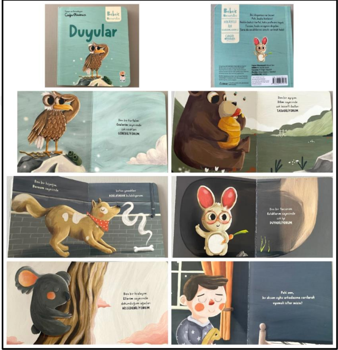
Görsel 4.7. Duyular Kitabı Kapak ve Resimli İç Sayfa Tasarımı (Odabaşı 2022)

Duyular kitabı iç ve dış yapı özellikleri kategorilerinde ve dış yapı özelliklerinde tasarım öge ve ilkeleri alt başlığında incelenecektir. Dış yapı özelliklerinde boyut, kâğıt, tipografi, resimleme, sayfa düzeni yer almaktadır.