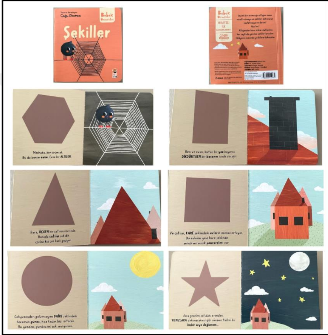
Görsel 4.4. Şekiller Kitabı Kapak ve Resimli İç Sayfa Tasarımı (Odabaşı 2022)

Şekiller kitabı iç ve dış yapı özellikleri kategorilerinde ve dış yapı özelliklerinde tasarım öge ve ilkeleri alt başlığında incelenecektir. Dış yapı özelliklerinde boyut, kâğıt, tipografi, resimleme, sayfa düzeni yer almaktadır.