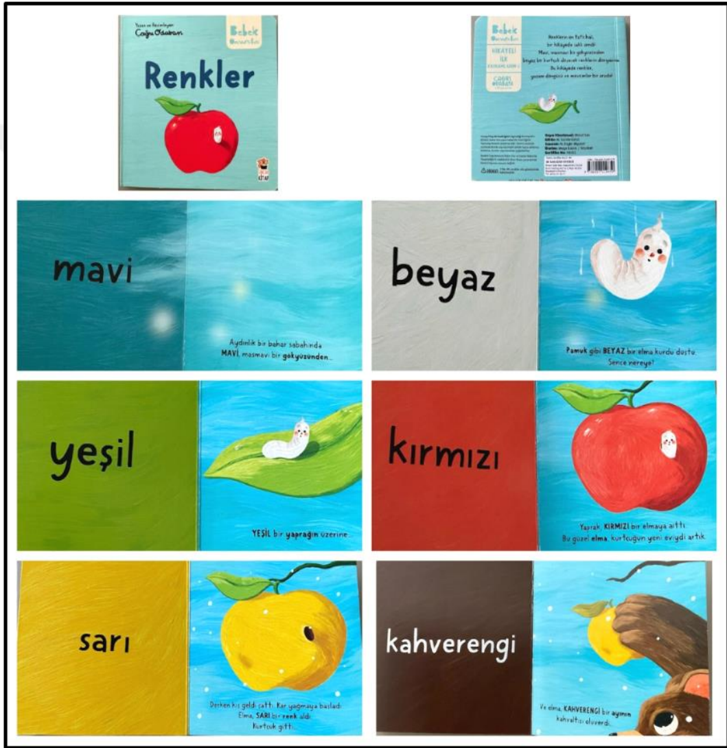
Görsel 4.3. Renkler Kitabı Kapak ve Resimli İç Sayfa Tasarımı (Odabaşı 2022)

Renkler kitabı iç ve dış yapı özellikleri kategorilerinde ve dış yapı özelliklerinde tasarım öge ve ilkeleri alt başlığında incelenecektir. Dış yapı özelliklerinden boyut, kapak-cilt, kâğıt, tipografi, resimleme, sayfa düzeni yer almaktadır.