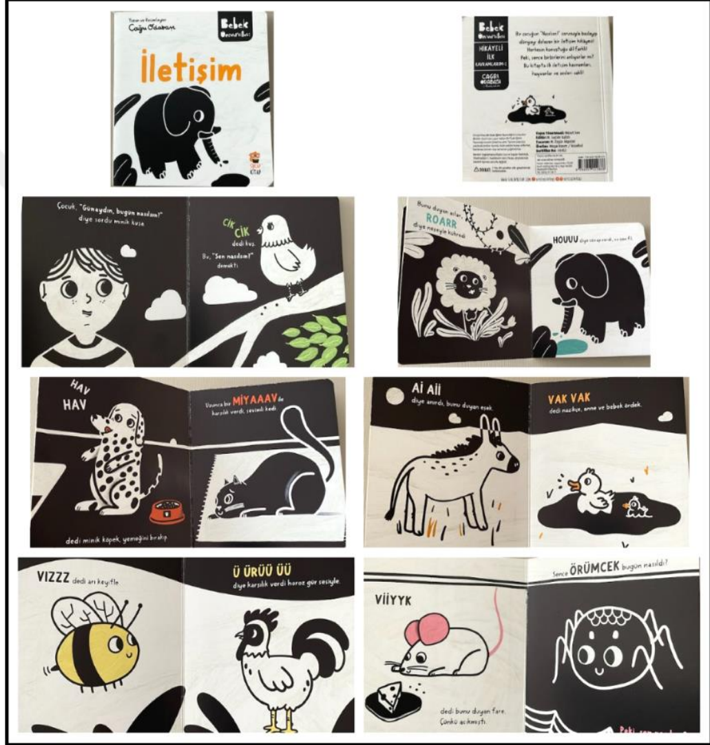
Görsel 4.2. İletişim Kitabı Kapak ve Resimli İç Sayfa Tasarımı (Odabaşı 2022)

İletişim kitabı iç ve dış yapı özellikleri kategorilerinde ve dış yapı özelliklerinde tasarım öge ve ilkeleri alt başlığında incelenecektir. Dış yapı özelliklerinden boyut, kapak-cilt, kâğıt, tipografi, resimleme, sayfa düzeni yer almaktadır.