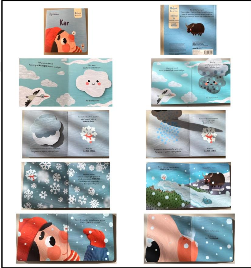
Görsel 4.13. Kar Kitabı Kapak ve Resimli İç Sayfa Tasarımı (Odabaşı 2024)

Kar kitabı iç ve dış yapı özellikleri kategorilerinde ve dış yapı özelliklerinde tasarım öge ve ilkeleri alt başlığında incelenecektir. Dış yapı özelliklerinde boyut, kâğıt, tipografi, resimleme, sayfa düzeni yer almaktadır.