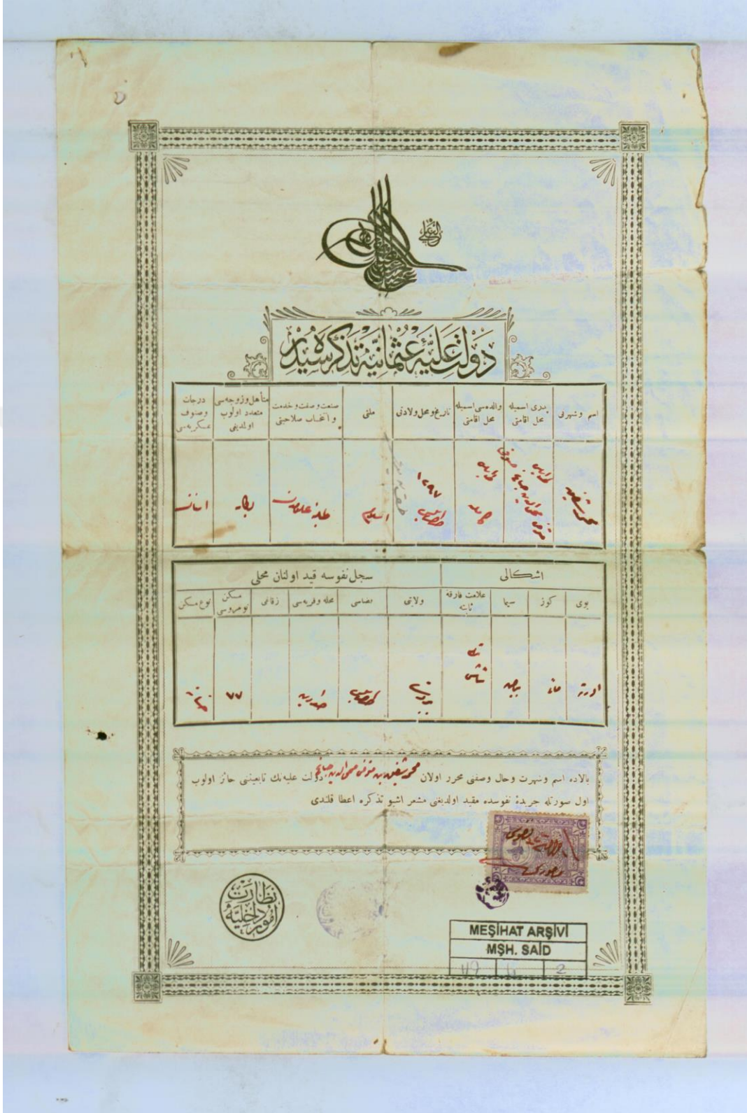
Ek 6. Mehmed Şefik Efendi'ye ait tezkere sureti 153