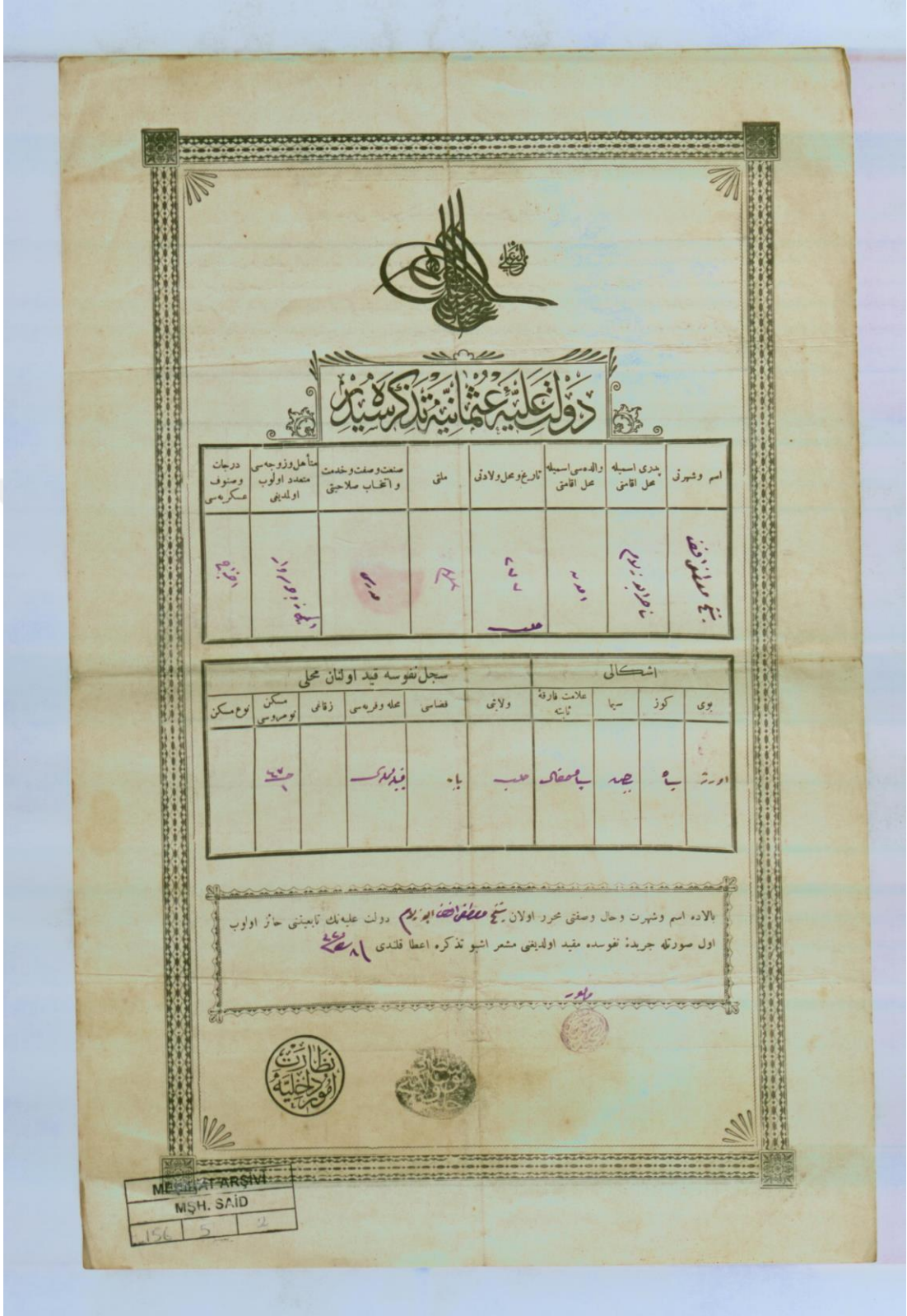
Ek 7. Şeyh Mustafa Efendi'nin tezkere sureti 154