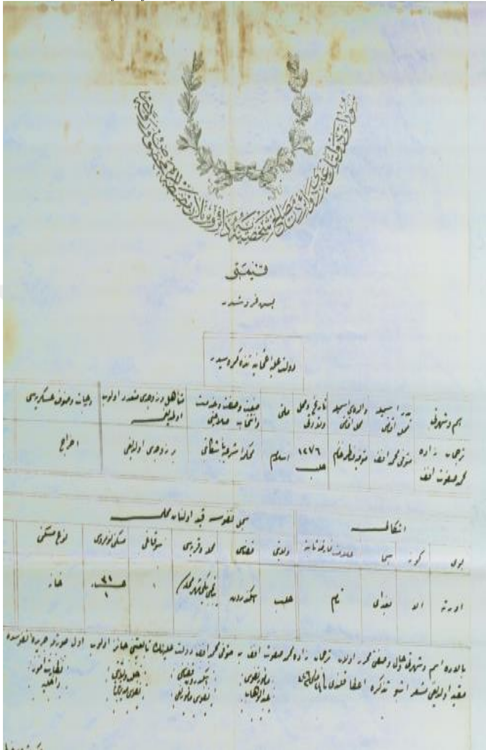
Ek 8. Muhammed Safvet Efendi'nin tezkere sureti 155