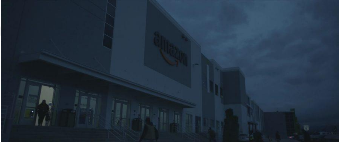
Resim 8: Nomadland filminde Amazon şirketini gösteren bir görsel

Jessica Bruder'in çalışmasında belirtildiği üzere, Amazon depolarında çalışan işçilerin günlük maratonları, on saatlik vardiyalar boyunca beton zeminler üzerinde kilometrelerce yürümeyi, ağır yükleri kaldırmayı ve sık sık eğilip bükülmeyi içeriyor. İşçiler, bir günde on beş milden fazla mesafe kat edebilirken, zaman zaman elli pound'a kadar ağırlıkları kaldırmaları bekleniyor. Çalışma koşulları bazen 90 dereceyi aşan sıcaklıklara ulaşabiliyor, bu da işin zorluğunu daha da artırıyor (Bruder, 2017: 51).