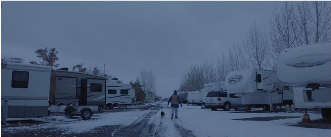
Resim 7: Nomadland filminden karavan park görseli