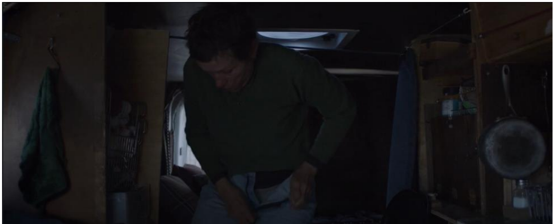
Resim 11: Fern'in yaşadığı yerde tuvaletini yaptığı bir sahne

" Nomadland " filminde Fern'in karavanıyla yaşarken karşılaştığı sorunlar, göçebe hayatın gerçekliklerini ve bu yaşam tarzının getirdiği zorlukları gözler önüne serer. Hijyen ve mahremiyet gibi temel yaşam standartlarından ödün vermek zorunda kalması, Fern'in özgürlüğü ve bağımsızlığı seçerken yüzleştiği bedellerden biridir. Ev gibi sabit bir yaşam alanının konforundan uzak, seyyar bir tuvalet kabı kullanmak zorunda kalmak, bu yaşam tarzının sıkıntılı yönlerini açıkça ortaya koyar.