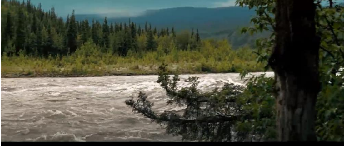
Resim 6: Nehrin coşkun anını gösteren bir an

Bu kritik olay, karakterin doğaya duyduğu büyük hayranlık ve saygının, aynı zamanda onun en büyük zayıflığına dönüşebileceğini gösterir. Doğayla kurulan derin bağ, ona özgürlük ve iç huzuru sağlasa da doğanın güçleri karşısında insanın ne kadar kırılgan olduğunu da ortaya koyar. Filmdeki bu trajik dönüm noktası, doğanın sınırsız gücü ve öngörülemezliği karşısında, insanın hazırlıksız yakalandığında nasıl acımasız bir sonla karşılaşabileceğini vurgular.