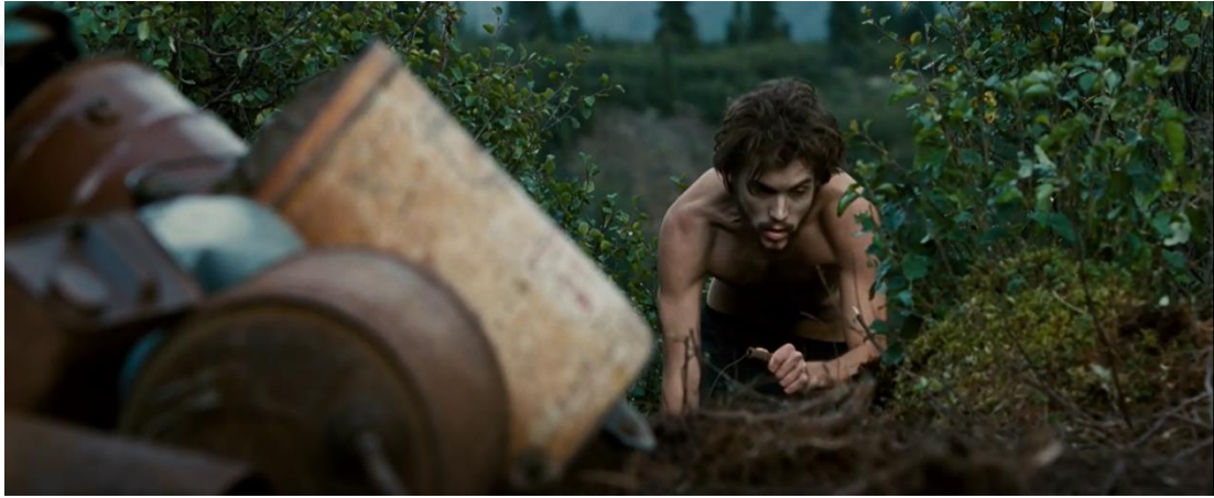
Resim 1: Into the wild filminden bir kare

halinin birbirine nasıl bağlandığını vurgulayarak, "manzara ve ruh hali" temasını öne çıkarır. Ona göre film, McCandless'in Amerika'nın özgürlüğünü keşfetmek için otostop yaparak, trenlere binerek ve geçici işler alarak çıktığı yolculuğu, geniş ve derin manzara ve ruh hali tasvirleriyle anlatıyor. Uzun ve diyalogsuz sahneler akıcı bir şekilde birbirine geçiyor. Bradshaw'a göre Krakauer'in doğayı insanın ruh haliyle etkili bir şekilde ilişkilendirmesi, filmde başarıyla ifade ediliyor. McCandless'in zayıflaması ve güçten düşmesi, filme yansıtılan doğanın sert ve kayıtsız yapısıyla uyum içinde ilerliyor. Bu, Bradshaw'ın doğanın tasviri ve insan duyguları arasındaki ilişki hakkındaki görüşünü destekliyor. Yiyecek kaynakları tükendikten sonra, McCandless'in zayıflaması ve bitkinliği gösteriliyor.