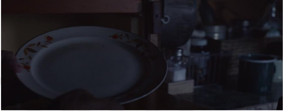
Resim 13: Fern'in babasından kalma temek takımından bir görüntü

Fern, babasının ona aldığı yemek takımını karavanında saklar. Bu yemek takımı, Fern'in babasının ona verdiği son hediye ve hatıradır. Fern, babasını çok sevmiş ve onunla yakın bir ilişki kurmuştur. Babasının ölümü, Fern'in hayatında büyük bir kayıp ve acı olmuştur. Fern, babasının yemek takımını saklayarak, onun anısını yaşatmaya çalışır. Fern, babasının yemek takımına özlem duyar.