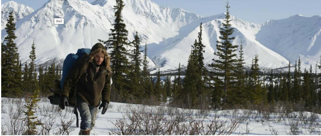
Resim 2: Into the wild filminden Alaska manzarası

Peter Bradshaw (2007), " Into the Wild "ın biyografik bir doğa ve hayatta kalma filmi olarak, diğer film türlerindeki doğa tasvirlerine kıyasla türün gerekliliklerine uygun bir doğa betimlemesi yaptığını doğru bir şekilde belirtiyor. Ancak, Drenthen (2009: 305) bu tür filmleri (gerçek olaylara dayanan hayatta kalma filmleri) karşılaştırırken, " Into the Wild "da kullanılan doğa tasvirinin, diğer filmlere göre daha az etkili olduğunu düşünüyor.