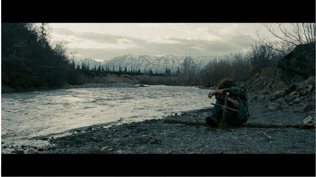
Resim 3: Into the Wild filminde nehir görüntüsü

Yine Lepik'in (2014: 48) belirttiği üzere McCandless'in günbatımında vahşi atları izlediği anlar gibi güzel müzikler eşliğinde, onun mutluluk ve özgürlük hissini vurgulamak üzere tasarlanmıştır. Filmin belki de vahşetin gerçek anlamda ilk kez hissedildiği nokta, McCandless'in uygarlığa dönüş yolunda, birkaç ay öncesinde kolayca geçtiği nehrin karşısına çıktığı sahnedir.