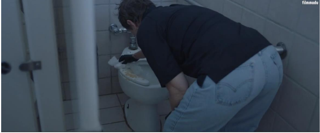
Resim 9: Nomadland filminde kamp temizliği sahnesi

Zhao'nun filmi, dolaşan iş kampı çalışanlarını idealize ederek, onları mülklerini özgürleştirici karavanlara ve RV'lere çeviren, iş ve seyahati birleştiren bireyler olarak sunuyor. Film, bu insanları 2008 ekonomik krizinin mağdurları olarak değil, kendi kendini keşfetme ve kendini gerçekleştirme yolculuklarındaki cesaret ve iş ahlakı ile öne çıkan kişiler olarak betimliyor. Zhao'nun filmi, gezginlerin yaşam tarzının kurtarıcı yönlerini öne çıkararak, bu topluluğun karşılaştığı zorlukların üstesinden gelme kapasitesini abartılı bir şekilde sunuyor (2022: 5).