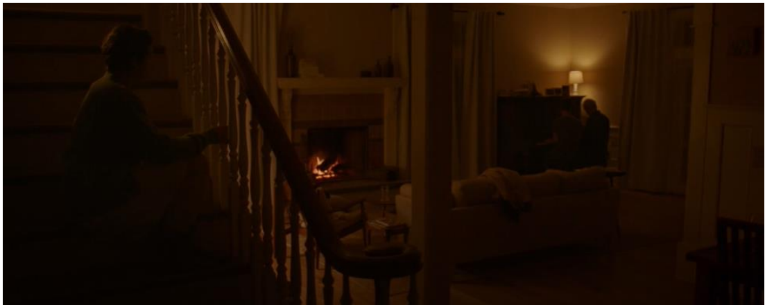
Resim 10: Fern'in arkadaşının mutlu aile evini terk etmeden önceki son anları

" Nomadland " filminde Fern'in hikayesi, modern yaşamın getirdiği konformizmden ve kısıtlamalardan uzak, bağımsız bir yaşam biçimine olan derin bağlılığını vurgular. Fern için karavanıyla yaşamak, sadece bir yaşam tarzı seçimi değil, aynı zamanda kişisel özgürlüğünü ve bağımsızlığını ifade etmenin bir yoludur. Bir evde yaşamak, ona göre sıkıcı ve kısıtlayıcı bir alternatif haline gelmiştir. Bu, Fern'in eski öğrencisinin evinde geçirdiği zamanla net bir şekilde ortaya çıkar. Ailesel ve toplumsal sıcaklığın, konforun ve güvenliğin sunulduğu bu ortamda bile, Fern kendini sınırlanmış ve özgürlüğü kısıtlanmış hisseder. Bu durum, onun karavanına ve göçebe yaşamına geri dönme kararını tetikler.