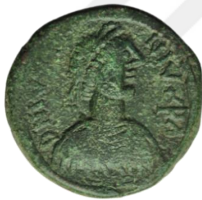
Kat No: 11