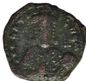
Kat. No: 42