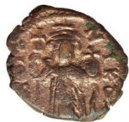
Kat. No: 38