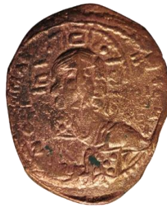
Kat. No: 58