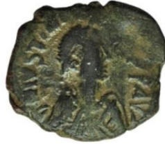
Kat. No: 9