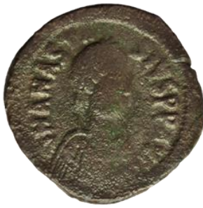
Kat. No: 2