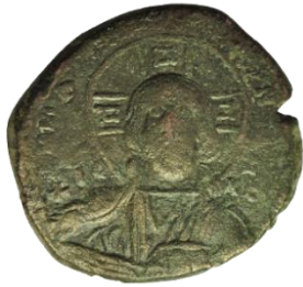
Kat. No: 56