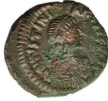
Kat No: 8