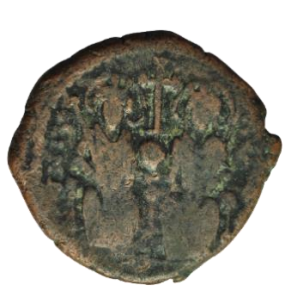
Kat. No: 20