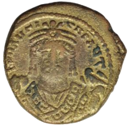
Kat. No: 31