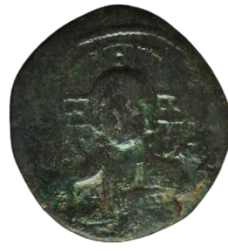
Kat. No: 46