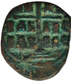
Kat. No: 60