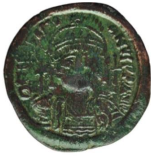
Kat No: 7