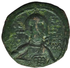
Kat. No: 69