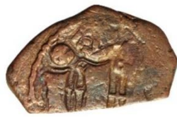
Kat No: 36