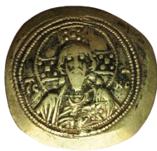
Kat. No: 72