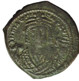
Kat. No: 30