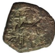
Kat. No: 39