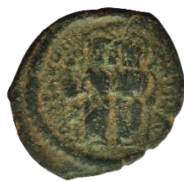
Kat. No: 25