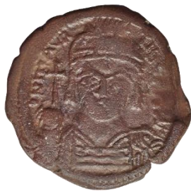
Kat. No: 24