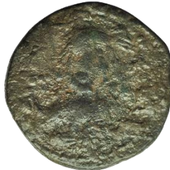
Kat. No: 70