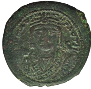
Kat. No: 29