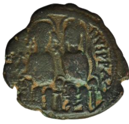
Kat. No: 15