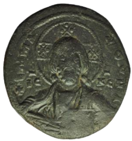
Kat. No: 52