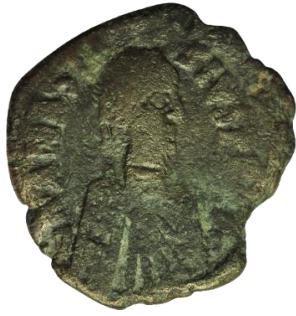
Kat. No: 1