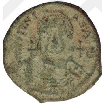
Kat No: 12