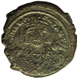
Kat. No: 28