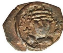
Kat. No: 37