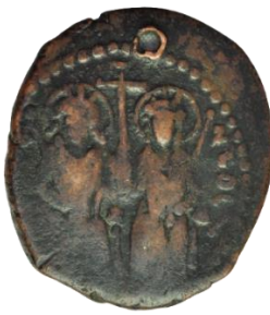
Kat. No: 21