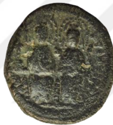
Kat. No: 18