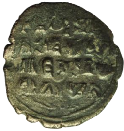
Kat. No: 47