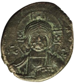
Kat. No: 51