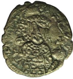
Kat. No: 44