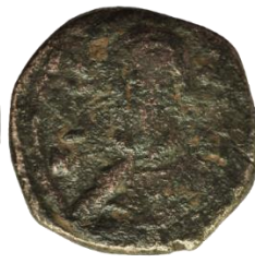
Kat. No: 71