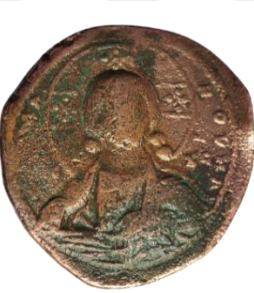
Kat. No: 54