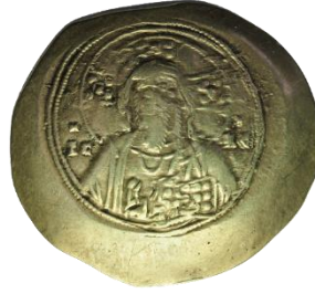
Kat. No: 74