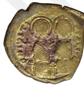
Kat No: 13