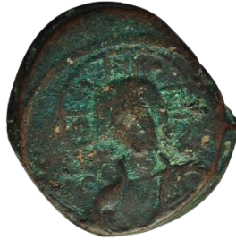
Kat. No: 57