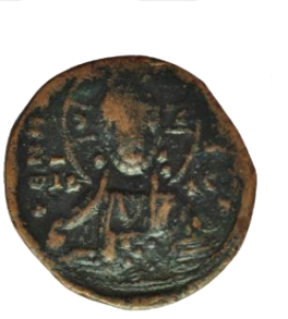
Kat. No: 55