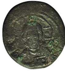
Kat. No: 63