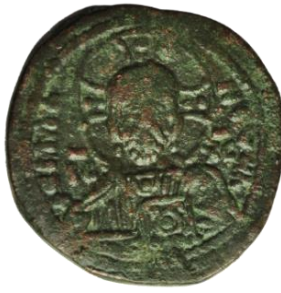
Kat. No: 45