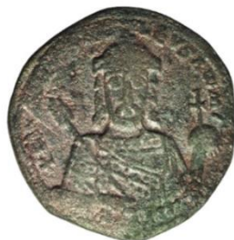
Kat. No: 41