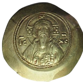
Kat. No: 73