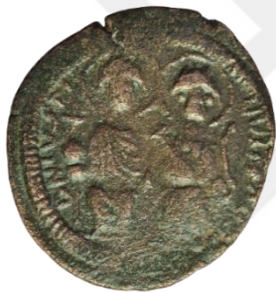
Kat. No: 17