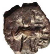
Kat. No: 40