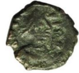
Kat No: 10