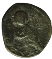
Kat. No: 68