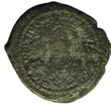
Kat. No: 32