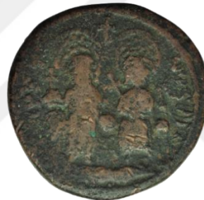
Kat. No: 19