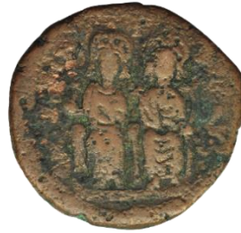
Kat. No: 16