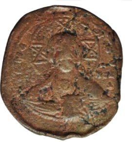
Kat. No: 53