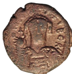
Kat. No: 26