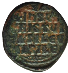
Kat. No: 49