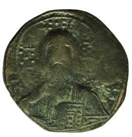
Kat. No: 50