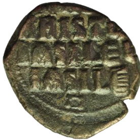
Kat. No: 59