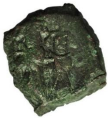
Kat. No: 35