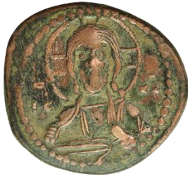
Kat. No: 62