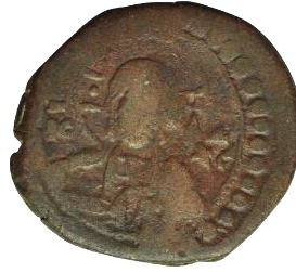
Kat. No: 64