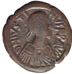
Kat. No: 3