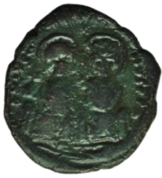
Kat No: 14