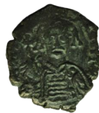
Kat. No: 23