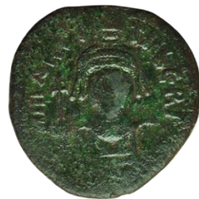
Kat. No: 27