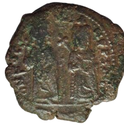
Kat. No: 33