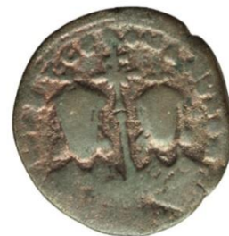
Kat. No: 43