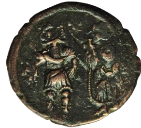
Kat. No: 34