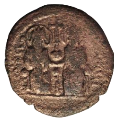
Kat. No: 22