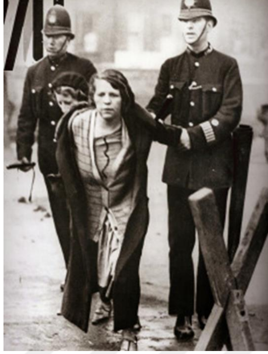
Şekil 7. Süfrajete Mücadelesi, yazhocam.com, 2023

Kadın ve erkekler arasındaki fiziksel farklılık kadının her alanda aleyhine kullanılmıştır. Bu algıyı değiştirmeye çalışan kadınlar insan bedenindeki farklılıkların insan olmakla aynı şey olmadığını, cinsiyet farklılığından dolayı bireylerin varlıklarının yok sayılmayacağını belirtmiş ve bu fikre meydan okumuşlardır. Toplumun tabularını ortadan kaldırmaya çalışan birinci dalga feminizmin en temel önceliği mülkiyet hakkının verilmesi, cinsel sömürünün ortadan kaldırılması, eğitimde fırsat eşitliğinin olması ve kadınların oy kullanması gibi temel haklarının onlara iade edilmesi olmuştur. Bu mücadele sürecinde zaman zaman itaatsizlik, sokak protestoları ve şiddet gibi politik eylemlere başvurulmuştur.