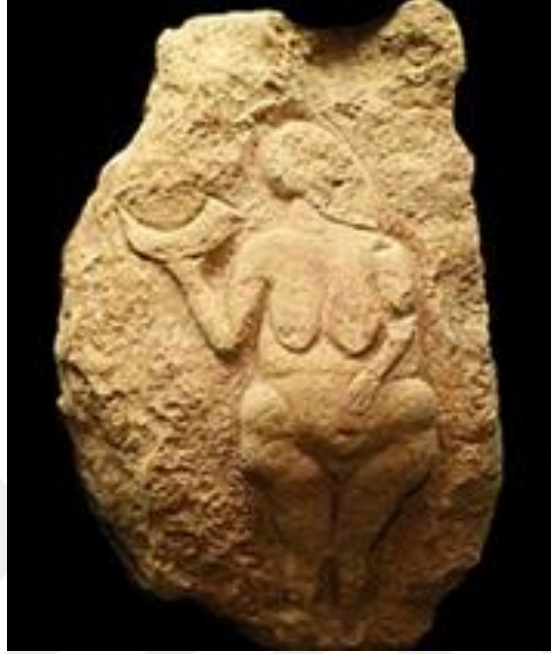
Şekil 2. Lausel Venüs'ü, upload.wikimedia.org, 2023

sembollerden biri olmuştur. Kadınların süs eşyası yapmak, hayvan derisi dikmek ve klanın zarar görmesini önlemek gibi üstlendikleri ev işi görevleri bunun yanı sıra klanın geleceğini güvence altına almadaki önemli rolleri kadınları kutsal bir konuma yerleştirmiştir.