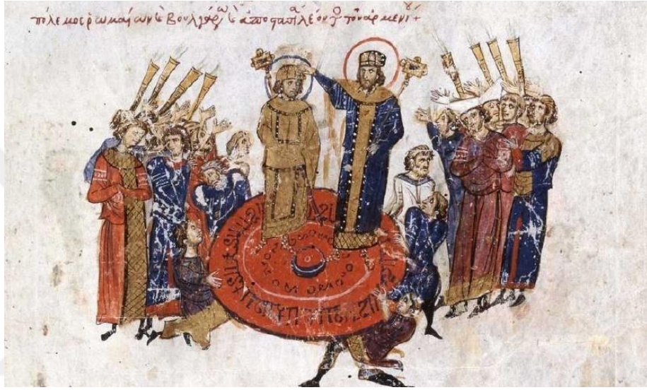
Görsel 4.6. I.Mikhael'in kalkan üzerinde havaya kaldırılması (Skyl. fol.10v)

yükseltilmiş görülmektedir. Bir önceki minyatürdeki gibi giyinmiş bir figür, imparatorun sol tarafında dikilmekte ve onu taçlandırmaktadır. Theophanes Kroniğinde I.Michael'e tacı takan kişinin patrik Nikeforos olduğunu yazmaktadır 727 dolayısıyla bu figürün bizzat patriğin kendisi olduğu düşünülebilir. Kalkanın etrafındaki kalabalığın arka tarafında trampet çalan bir grup bulunmaktadır. Havaya kaldırılmış imparatoru alkışlayan çok sayıda el çizilmiştir. 728 Ancak metnin içeriğinde kalkan üzerinde yükseltme geleneği ile ilgili bir anlatı bulunmamaktadır. 729