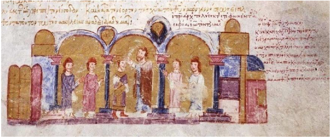
Görsel 4.11. Ioannes Tzimiskes'in taç giyme töreni. (Skyl. fol. 159r.)

Skylitzes kroniğinde, İmparator Nikeforosun halefi Ioannes Tzimiskes (969-976)'in taç giyme törenini tasvir eden bir minyatür bulunmaktadır.