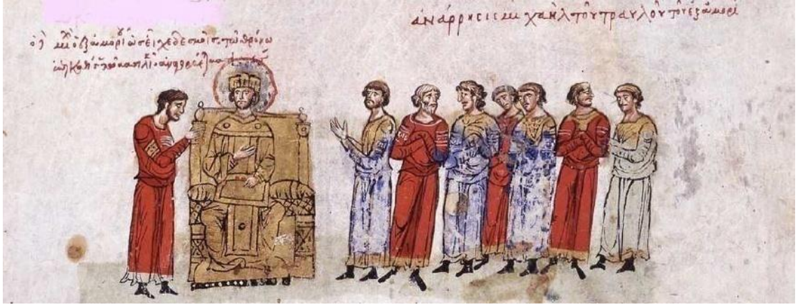
Görsel 4.8. II.Mikhael Travlos'un tahta çıkışı (Skyl. fol.26v)

Minyatürde, tahtta oturmakta olan imparatorun başının üzerinde “Çiçek işlemeli şeritler tutan Amoriondan (gelme) Mikhael, krallığa ait tahta oturmuş olarak basileus ilan edilmektedir.” 737 İfadesinin olduğu bir yazıt vardır. Sol tarafında sıraya girmiş halde resmedilmiş olan ve sivil memurlara özgü kıyafet giymiş bir grubun üzerinde “Amoriondan (gelme) Mikhael Traulos’un halka açık ilanı” 738 yazmaktadır. II.Mikhael, zindandan çıkarılarak ve “elleri hala yıkanmamış halde” Ayasofya’ya giderek piskoposun elinden tacı kabul etti ve halk tarafından alkışlandı. 739