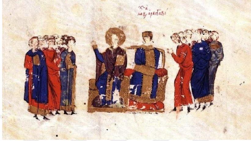
Görsel 4.5. I.Mikhael'in tahta çıkışı (Skyl. Fol.10r.)

oturmakta olduğu tahtın yanında bulunan bir başka tahtta, başında bir hale ile resmedilmiş olarak, stikharion 720 , phelonion 721 ve epitrahilion 722 giymiş halde bir figür bulunmaktadır.