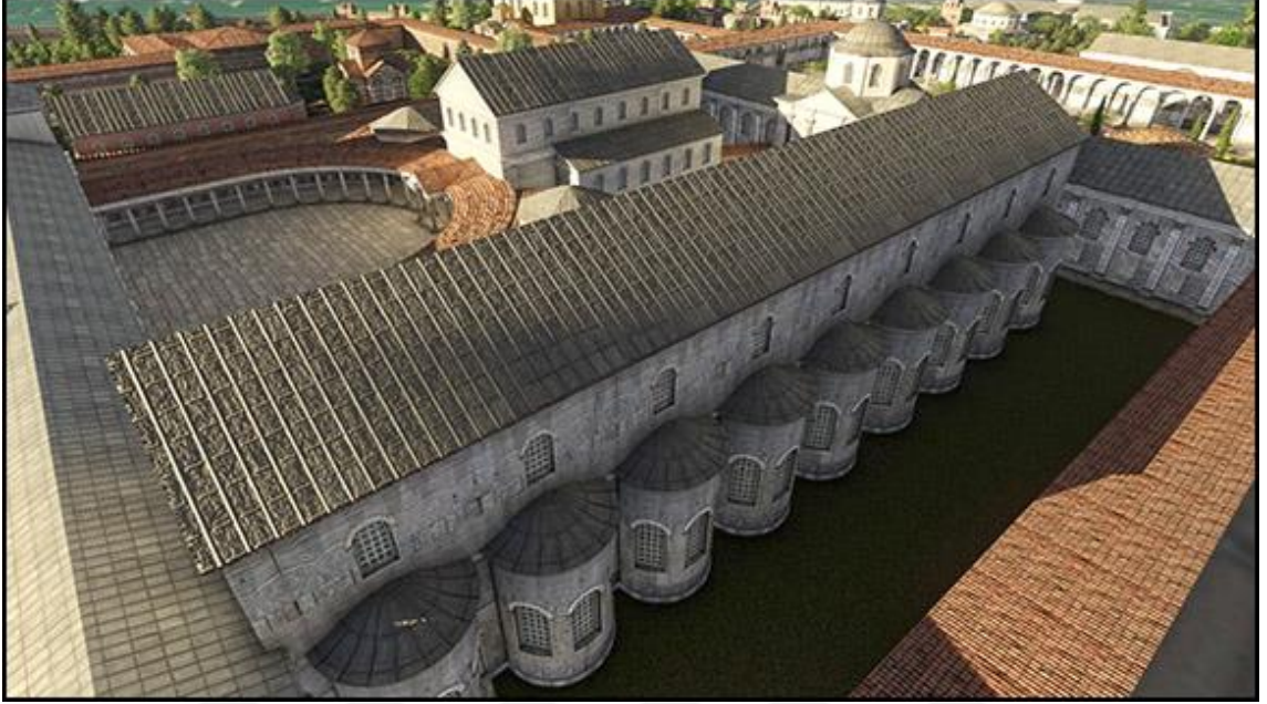
Görsel 4.3. On dokuz akkubita salonunun dış cepheden görünüşü.

beslemeyeceğine ve soğukkanlılıkla devleti yöneteceğine dair yemin etmesini istediler. Bu yemin edilir edilmez, hipodroma geçti. Araba yarışlarında senatörlerin imparatorun önünde eğildiği yer olan salona geçildi. Altın renk bir clavi ile bir sticharion, diveteson ve kemer kuşandı. Tozluk ve sandallarını giydi. Başı açık şekilde kathismaya gitti. 696