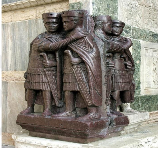
Görsel 1.2 Dört Tetrark Heykeli ( www. en.wikipedia.org)

tek başına augustus ilan edildi. 53 Ancak, Stephenson'a göre Konstantinus, askerlerin değil augustusların aday göstermesiyle, meşru bir biçimde hükümdar olmak istediği için augustus Galeriusla görüşerek kaesar olmak istedi. 54 Hükümdarlık için girişilen iç savaşların sonunda kazandığı galibiyetler sayesinde, Konstantinus, augustus ilan edildikten yedi yıl sonra tetrarşi dönemini sonlandırarak imparatorluğun tek hükümdarı oldu. 55