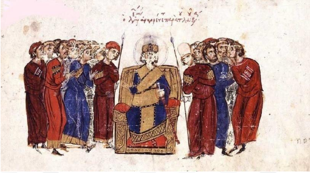
Görsel 4.7. V.Leon'un tahta çıkışı (Skyl. fol. 12v)

V.Leon olarak tahta çıkan imparator Ermeni Leon, tahta çıkmadan önce anatolikon themasının strategosuydu 732 . Bu olay, Theophanes tarafından şu şekilde anlatılmaktadır;