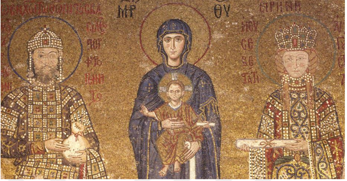
Görsel 2.3. Komnenoslar Mozaïği ( https://ayasofyamuzesi.gov.tr/tr/mozkomnenoslar-mozai%C4%9Fi )

Roma'dan miras alınan bir diğer şey de hükümdarın atanma şekliydi. Hükümdar seçimle iş başına geliyordu ve Bizans imparatorluğu ile birlikte Hıristiyanlaşan yapı içerisinde bu seçimin Tanrı'nın emri ile yapıldığına ve seçilen kişinin tanrının lütfü ile bu makama geldiğine inanılıyordu. 75 Bir İmparator, piskpos tarafından taçlandırılırken aslında Tanrı tarafından o makama atanıyordu, tacı takanlar sadece aracıydılar. 76 Roma imparatorluğu'nda askeri başarılar kişinin hükümdarlık makamına yükselmesinde büyük önem teşkil ediyordu. Hükümdarın iş başına geldiği seçim yetkisi ordu ve senatoya aitti, ordu veya senato bir kişiyi öne çıkarıyor onu alkışlıyordu. Alkışlanmak o kişinin senato ve ordu nezdinde hükümdar ilan edildiği anlamına geliyordu. Ancak hükümdarın göreve başlaması için halkın da alkışa dâhil olması gerekiyordu. 77 Tahta çıkacak imparatorun seçiminde, ordu, halk ve senatonun dünyevi alkışlama hareketi, en önemli faktör olarak kaldı. Bury, halkın alkışmalasını Roma'daki populus romanus 'un yaptığı alkışlamanın bir devamı olarak görmekte ve bunu bu geleneğin sürdürülmesine yönelik bir istek olarak yorumlamaktadır. 78 Bir kere alkışlanan imparator, büyük kudretin, imparatorluk otoritesinin sahibiydi. 79 Erken dönemlerde, askerler, zafer kazanmış liderlerini kalkanın üstüne kaldırırđı. Sonra ona, muvaffakiyet bahşedilir ve O da muzaffer olarak muzaffer tacı (lat. corona aurea ), ya da defne tacını (lat. corona