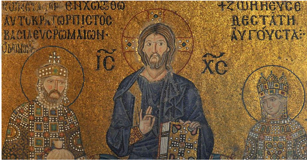
Görsel 2.2. Zoe Mozaiği ( https://ayasofyamuzesi.gov.tr/tr/mozzoe-mozai%C4%9Fi )

uyguladığı despotik yetkinin genişliğini ifade etmek şeklinde tanımlamakta ve onu Roma cumhuriyetindeki imparator unvanının karşılığı kabul etmektedir. Basileus unvanını ise Roma imparatorluğundaki augustus unvanının karşılığı olarak görür. İlerleyen yüzyıllarda ise basileus'un hükümdarı tamamen karşılayan bir unvan olmaktan uzaklaşıp, autokrator'un daha uygun bir hükümdarlık unvanı haline geldiğini düşünmektedir. 74