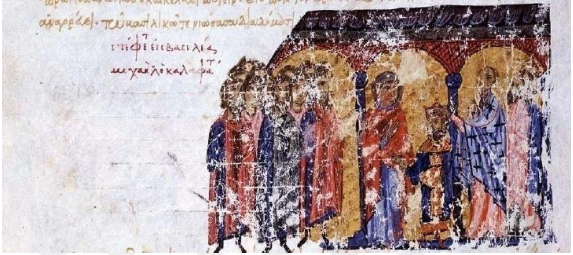
Görsel 4.12. V.Mikhael'in taç giyme töreni (Skyl. fol.218v.)

Skylitzes kroniğinde taç giyme töreni ile ilgili minyatür bulunan bir diğer imparator, V.Mikhael (1041-1042)dir.