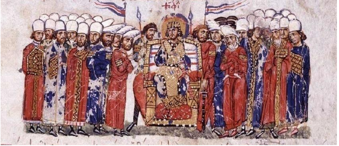
Görsel 4.8. İmparator Theophilos'un taç giyme töreni (Skyl. fol 42v.)

İmparator Theophilosun halefi ve oğlu olan III. Mikhael (842-867) taç giydiğinde, üç yaşındaydı ve Onun adına annesi Theodora naibe olarak yönetimi üstlendi. 740 Skylitzes kroniğinde onun tahta çıkışıyla da ilgili bir minyatür bulunmaktadır. “ο βα[σιλευς] μ[α]χ[αηλ] (tr. Basileus, Mikhael)” başlığı altında, sağ işaret parmağını havaya kaldırmış şekilde, muhtemelen konuşurken tahta oturmakta olan küçük bir çocuk görülmektedir. Bu duruş onun tasvir edildiğini düşündürür. Diğer tahta çıkma sahnelerinden farklı olarak ilk kez bir tahta çıkma töreni kapalı bir mekân içerisinde resmedilmiştir. Arka planda bir salon görülmektedir. Salonun çatısı görünürken imparatorun salonun tam ortasında olduğu izlenimi verilmiştir. Sağında ve solunda yine, kıyafetlerinden saray erkânı oldukları anlaşılan bir grup resmedilmiştir. İmparatorun sol tarafındaki grubun üzerinde halk, kitle anlamına gelen 741 “ο λα[ο]ς (tl. ho laos) kelimesi yer almaktadır.