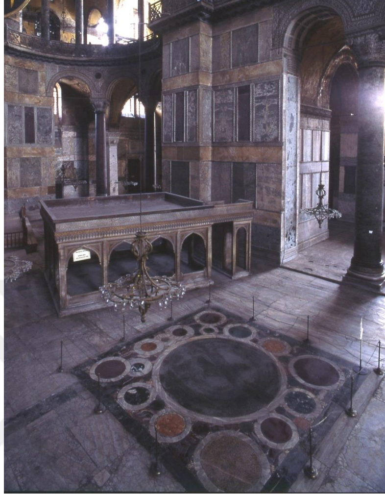
Görsel 4.13. Omphalion. ( https://ayasofyamuzesi.gov.tr/tr/i%C3%A7momphalion )

Sonuç olarak kaynaklarda, detayları ile yer edinmiş hemen hemen bütün taç giyme törenleri incelendiğinde, çok hızlı olmayan ancak çok büyük dönüşümlerin gerçekleştiği bir süreç ortaya çıkmaktadır. Ordu artık, eskisi gibi ön planda değildir. Kalkan üzerine çıkarılıp havaya yükseltme, bilindiği kadarıyla en son III. Andronikos'un taç giyme töreninde görülmüştür. Daha önce de bahsedildiği gibi kalkan üzerine çıkarılıp havaya yükseltme oldukça içerdiği mesaj güçlü olan bir harekettir. Bunun kesin bir biçimde terk edilmemiş olması ama aynı zamanda törensel geleneğin ayrılmaz bir parçası olma durumunu da koruyamamış olması ilginç bir ayrıntıdır. Taç giyme törenine sahne olan mekan olarak Ayasofya ön plandadır. Ayasofyada bulunan ve imparatorların taç giyme törenlerinde taçlarını giydikleri yer olan omphalionun büyük dairesi, imparatorların üzerine çıkartıldığı kalkanları anımsatmaktadır. Saray ve Ayasofya arasında bir hat çizmek mümkündür. Hatırlanacağı üzere erken dönem ve orta dönemin ilk yüzyıllarında taç giyme töreninin gerçekleştiği mekan ve mntıklar çok