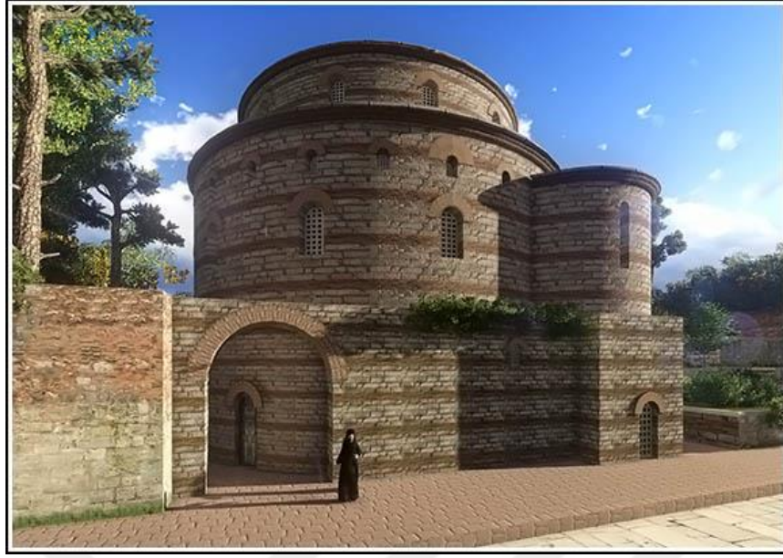
Görsel 4.2. Azizler Karpos ve Papylos Kilisesi.

Kampusta bir kortej hazırlanmaktadır. İmparator önünden haçlar ile asalar taşındığı bir arabayla yola çıkar. Patrikios unvanı taşıyan kişiler ya da imparator yanında kimi istemişse onlar imparatora eşlik ederler. Bu kortej Konstantinos forumuna vardığında, imparator arabadan iner ve eparkhos ile senato mensuplarını kabul eder. Burada ona bir taç takdim edilir. 680 İmparator buradan arabaya binerek senatörler ve archonlarla beraber horologion'un karşısındaki augustationdan 681 geçerek Ayasofya kilisesine girer. Büyük kapıdan içeri girdiler, narteks kısmına yine bir moutatorion kurulur. İmparatorun tacı, praispositos tarafından altara konur ve altın dağıtılır. Bunun ardından kendi locasına geçerek incil dinler. Piskopos, imparatorun başına tacı yerleştirir, sonra kilise törenlerinde olağan olduğu üzere, imparator ruhbana ödeme yapar ve saraya döner. 682