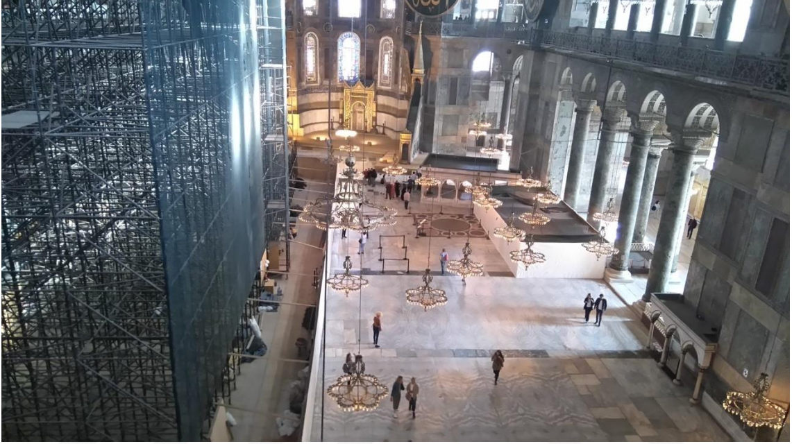
Görsel 2.6. Ayasofya'da bulunan imparatoriçe locasından omphalion ile altın görünümlü

edinilmiş bir kişi olan müstakbel hükümdara verecekleri destek de önemliydi. 109 Bu destek, dul kalan imparatoriçenin evleneceği kişinin hükümdar olabilmesini sağlayan bir geleneğe dayanıyordu. Dul imparatoriçe imparatorluğu yönetecek yeni bir eş seçme hakkına sahipti. 110 Halk arasına nadiren çıkan imparatoriçeler, düzenli olarak kiliseye giderler ve kilisede kendilerine ait özel bir yerde ayinlere katılırlardı. 111