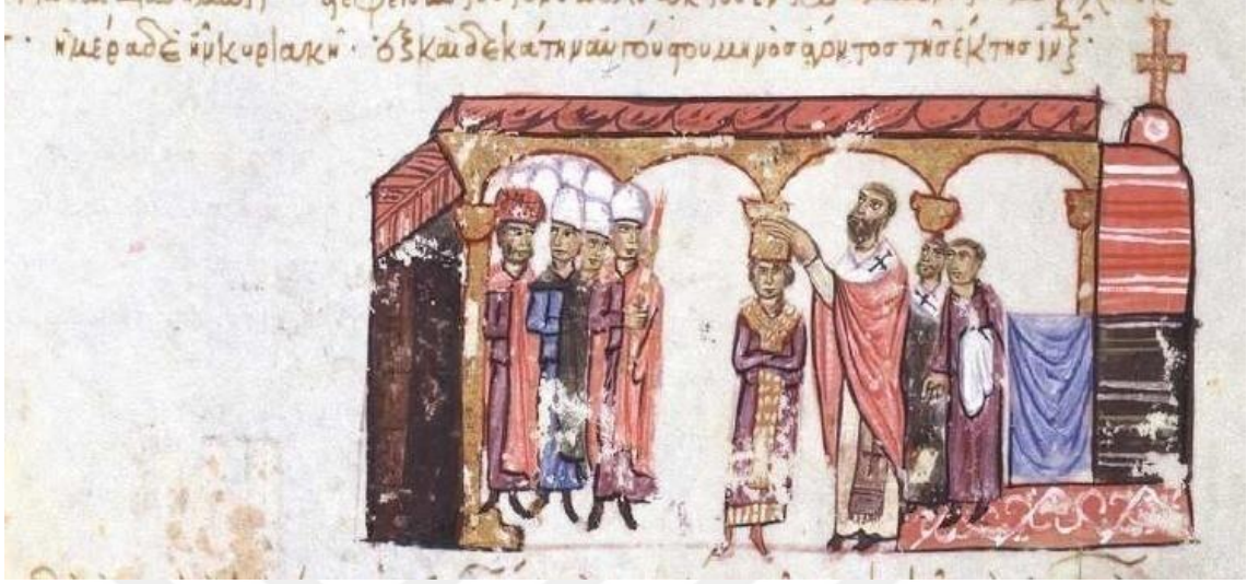
Görsel 4.10. II.Nikephoros Phokas'ın taç giyme töreni ( Skyl. fol 145v.)

Skylitzes kroniğinde imparator II. Nikephoros Phokas (963-969)'ın taç giyme törenini tasvir eden bir minyatür bulunmaktadır.