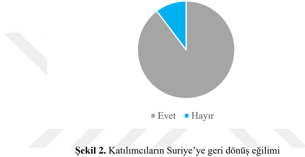
Şekil 2. Katılımcıların Suriye'ye geri dönüş eğilimi

Geri dönüş, bir ülkeden önceki transit veya kaynak ülkeye geri dönme eylemidir (Kaya, 2022, s. 77). Katılımcılara koşullar sağlandığında Suriye'ye geri dönüp dönmeyecekleri sorulduğunda 29 katılımcıdan 26'sının Suriye'ye geri dönmeyi istediği, ancak bunun bir ön koşulu olduğu tespit edilmiştir. Katılımcılar ancak Suriye'deki rejim değiştiği takdirde Suriye'ye geri döneceklerini ifade etmiştir: