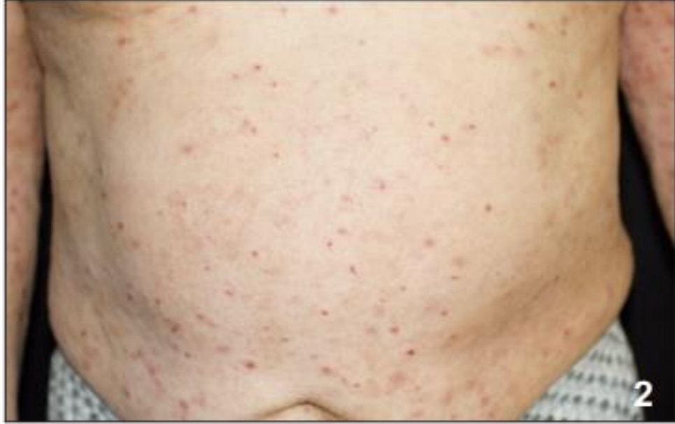
Şekil 2.2. Vücutta kaşıntılı eritemli papül, ürtikeryal lezyonlar ve ekskorye papüller ve krutlar

sonra artar ve kişiyi uykudan uyandıracak kadar şiddetli olabilir. Parmak aralarından başlayan kaşıntı bileklere, dirseklerin ekstansör bölgeleri, aksiller bölge, penis, skrotum ve kadınlarda meme areolaları, kalça, sakral bölge ve periumbilikal bölgeye yayılır.(Resim 2-5)