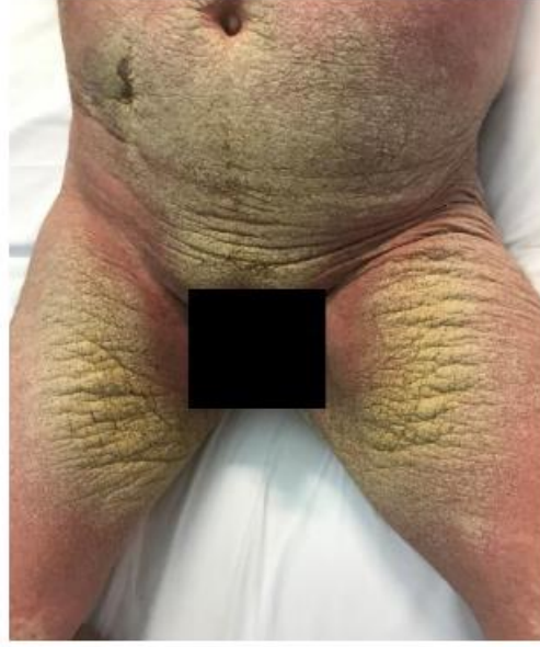
Şekil 2.6. Vücudun neredeyse tamamını kaplayan eritemin yanı sıra uylukta ve karında görülen sarı-gri yapışık skuam ve hiperkeratoz; krutlu skabiyes