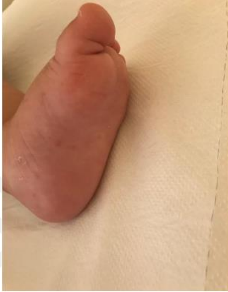
Şekil 2.5. İnfantil dönemde ayak tabanları sık tutulan vücut bölgesidir.

Muayenede en sık karşılaşılan bulgu olan ekskoriye papüller, skabiyes akarları, yumurtaları, eksuda ve dışkı gibi salgılarına karşı gelişen tip 4 alerjik yanıtın sonucudur. Bunlar, skabiyes akarının neden olduğu primer lezyonlar arasında yer almaz ve bu nedenle deri kazıntısı örneklerinde nadiren tespit edilir. Ancak erkek hastalarda glans, corona, penil shaft ve skrotumda eritemli papüller klinik olarak gözlenebilir. Bu papüller genellikle ekskoriyedir ve üzerinde hemorajik krut bulunabilir.