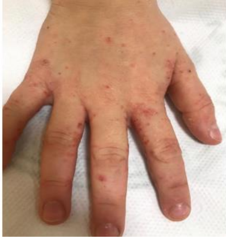
Şekil 2.4. Parmak araları ve el dorsallerinde görülen ekskoriye papüller.

Yetişkin hastalarda genellikle sırtın orta hattı, yüz ve saçlı deri etkilenmezken; bebeklerde bu bölgelerde de tutulum görülebilir.