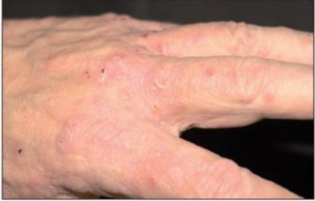
Şekil 2. 3. El parmak aralarında ekskorye papüller ve veziküller.

Uyuz akarlarına bağı gelişen hipersensitivite, simetrik ve pleomorfik lezyonların oluşumuna yol açar. Kaşıntının yoğun olduğu bölgelerde papül, vezikül, bü, pullanma, kabuklanma, püstül, nodül ve ekskoryasyonlar görülebilir.[15]