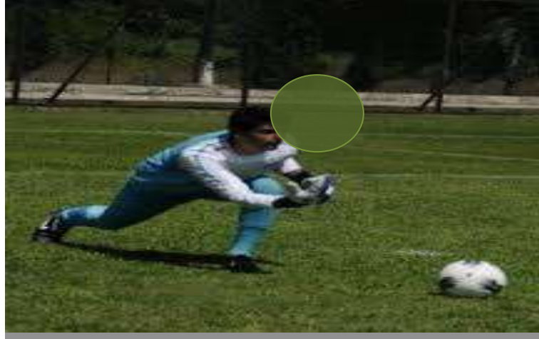
Şekil 3.12: Yuvarlama Örnek Resim

Değerlendirme kriterleri arasında, iki tenis topunu baskın el arasında yuvarlama, tutma kolunun topu parçalarının arkasında sallama, geniş bir adım atma ve tutma kolu ayak önde olacak şekilde çaprazlama, dizleri ve vücudu düzgün bir şekilde bükülme yeteneği yer alıyor (Allen ve ark. , 2017).