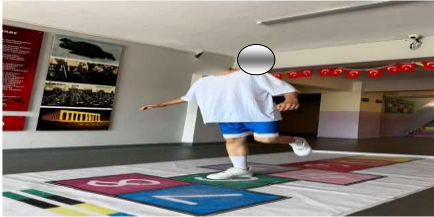
Şekil 3.3: Sek Sek Örnek Resim

Tek ayak üzerinde zıplama çevikliğiyle, atlama hünerinizi sergileyerek, ayağınızı havada itme konusundaki etkileyici becerinizi sergileyebilirsiniz. Art arda üç kez atlama yeteneği, hem tercih edilen hem de tercih edilmeyen hareketlerle kolların vücuda yakın sallanması, ilave güç için kolların bükülmesi ve ayağın vücuda