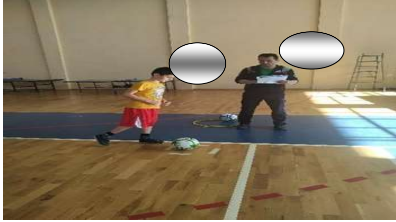
Şekil 3.8: Durarak Top Sürme Örnek Resim

Top elinizdeyken etkili gol atma becerisi, baskı yapmayın, her iki elin desteği olmadan istikrarlı kontrolü sürdürmeyi ve ayaklarınızı tutmayı içerir. Değerlendirme, topun parmak uçlarıyla dokunup itilmediğini ve ardından çizginin önünde veya boyunca yere değip değmediğini belirlemek için yapılması gerekir ve bunu en az dört kez ıskaladan başarıyla tamamlanması gerekir (Allen ve ark. , 2017).