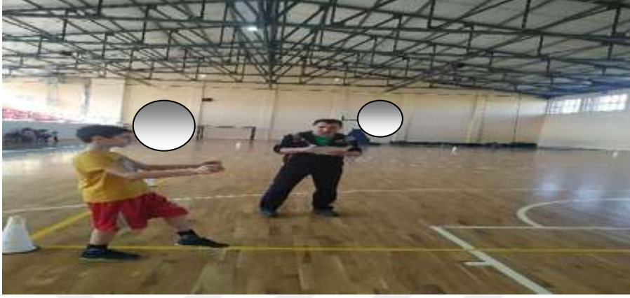
Şekil 3.2: Galop Örnek Resim

Galop, vuruş yürüyüşünün uygulanmasını içeren hızlı ve doğuştan gelen üç yönlü bir harekettir. Kollarınız beceri ve yeteneğe sahiptir. Belirli kriterlerle değerlendirildiğinde, aynı çizgide eğilme, kısa süreliğine iki ayağı yerden kaldırma, dört nala koşuda ardışık bir ritmi sürdürme, ikinci adımı ilk adımın arkasına koyma hareketi bu bağlamda önemli görülüyor (Allen ve ark. , 2017).