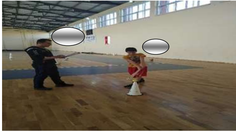
Şekil 3.7: Topa Sopayla Vuruş Örnek Resim

Beyzbol tarzı bir vuruş yapmaya çalışıma becerisidir. Yeteneklerin değerlendirilmesinde; sopayı tutarken baskın el üstte, diğer el onun altında bulunur. Daha az baskın yan yumruk omuz genişliğinde açık olan ayaklar aynı yönde bir nokta etrafında döner. Omuz ve kalça rotasyonu ağırlığı arka ayaktan ön ayağa transfer ve topa doğrudan temas kriterler değerlendirilir (Allen ve ark. , 2017).