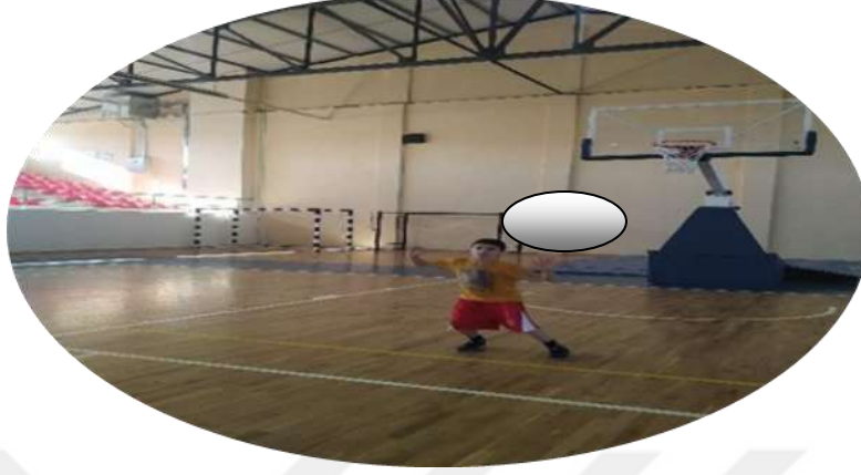
Şekil 3.6: Kayma Örnek Resim

Kayma sırasında minimum 4 adımın sürdürülmesinin değerlendirilmesi, vücudun hareket yönü göz önünde bulundurularak, düz zeminde bir noktadan diğerine düzgün bir şekilde süzülme yeteneğini içerir. Bu, gelen ayağın ilkiyle değiştirilmesini ve sağa ve sola dönüş yapılmasını içerir (Allen ve ark. , 2017).