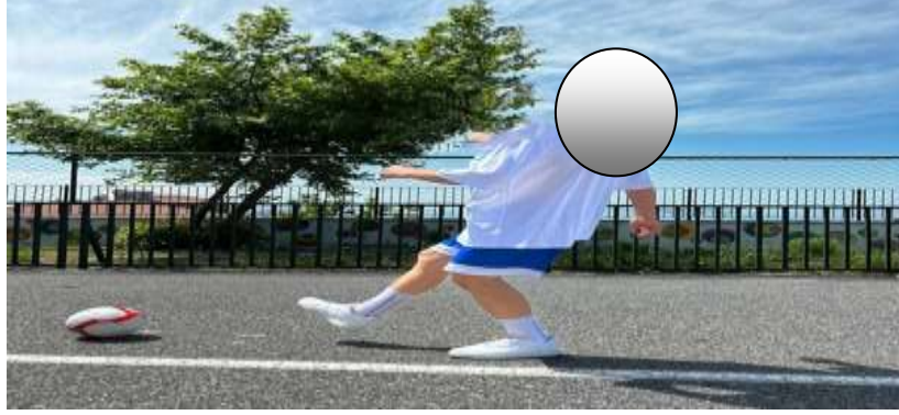
Şekil 3.10: Duran Topa Ayakla Vurma Örnek Resim

Yakalama kriterlerinin değerlendirilmesi, kolların ileri ve bükülü hareketini kullanarak, topu yakalamak için uzanarak ve yalnızca ellerin göğüs hizasında temas artışı sağlayarak top yakalama yeteneğinin değerlendirilmesini içerir (Allen ve ark. , 2017).