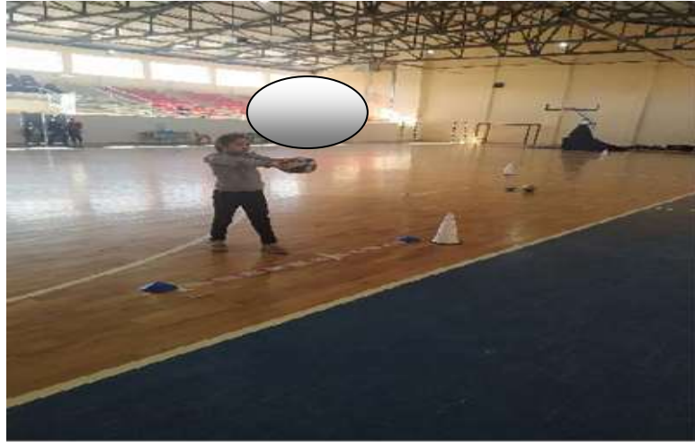
Şekil 3.9: Yakalama Örnek Resim

Yakalama kriterlerinin değerlendirilmesi, kolların ileri ve bükülü hareketini kullanarak, topu yakalamak için uzanarak ve yalnızca ellerin göğüs hizasında temas artışını sağlayarak top yakalama yeteneğinin değerlendirilmesini içerir (Allen ve ark., 2017).