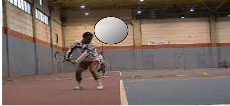
Şekil 3.11: Fırlatma Örnek Resim

Baskın eli kullanarak tenis topunu kullanarak hassas bir şekilde vurarak belirli bir hedef alıyor. Tutma kolu kalça-omuz rotasyonu ile dönerek topu arkadan bırakmaya hazırlanırken, bu süre kolunun hareketini ve vücut ağırlığını gözlemleyerek ileri pas kriterlerini değerlendirilmesidir (Allen ve ark. , 2017).