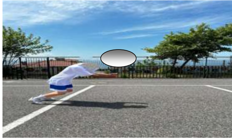
Şekil 3.5: Durarak Uzun Atlama Örnek Resim

Sabit bir pozisyondan her iki ayakla kendini ileri doğru iterek becerinin uygulanması. Becerinin gereksinimleri harekete hazırlanmayı içerir. Değerlendirme, dizlerin bükülmesinin, sıçramalar sırasında baş üstü kaldırma ile hızlı kol