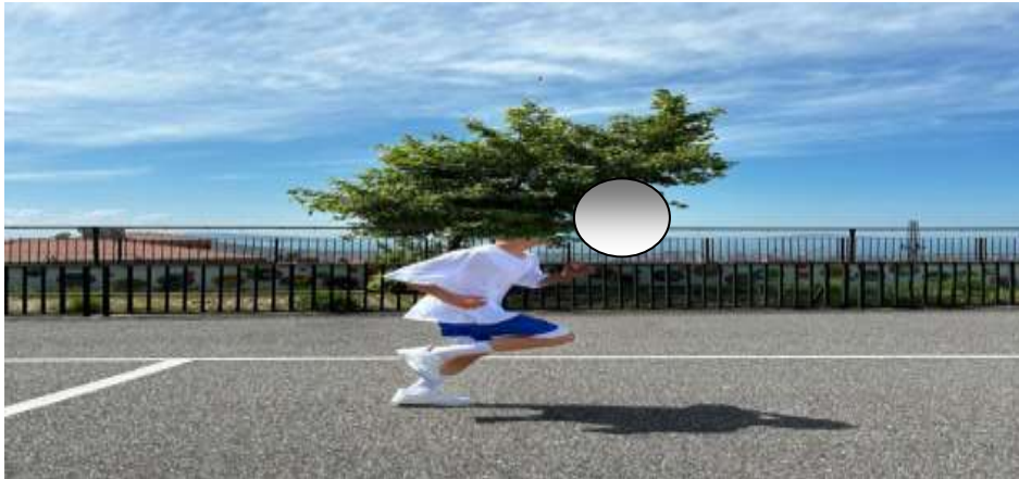
Şekil 3.1: Koşu Örnek Resim

Öğrenciye belirli bir mesafeden maksimum hızda koşması talimatı verilir. Performans kriterleri arasında ilk kol-bacak çapraz hareketi sırasında dirseklerin