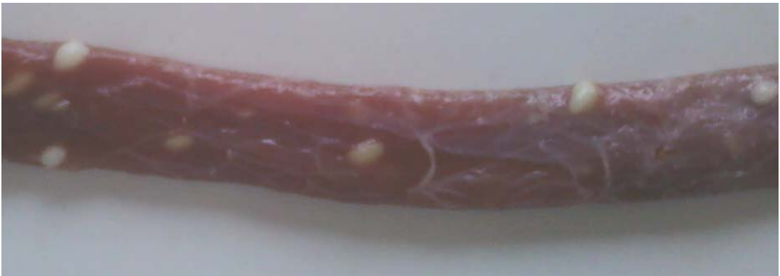
Şekil 4. Özafagusta makroskopik kistlerin görünüşü (4-5 yaşında ♂ Kıvırcık ırkı koyunlar)