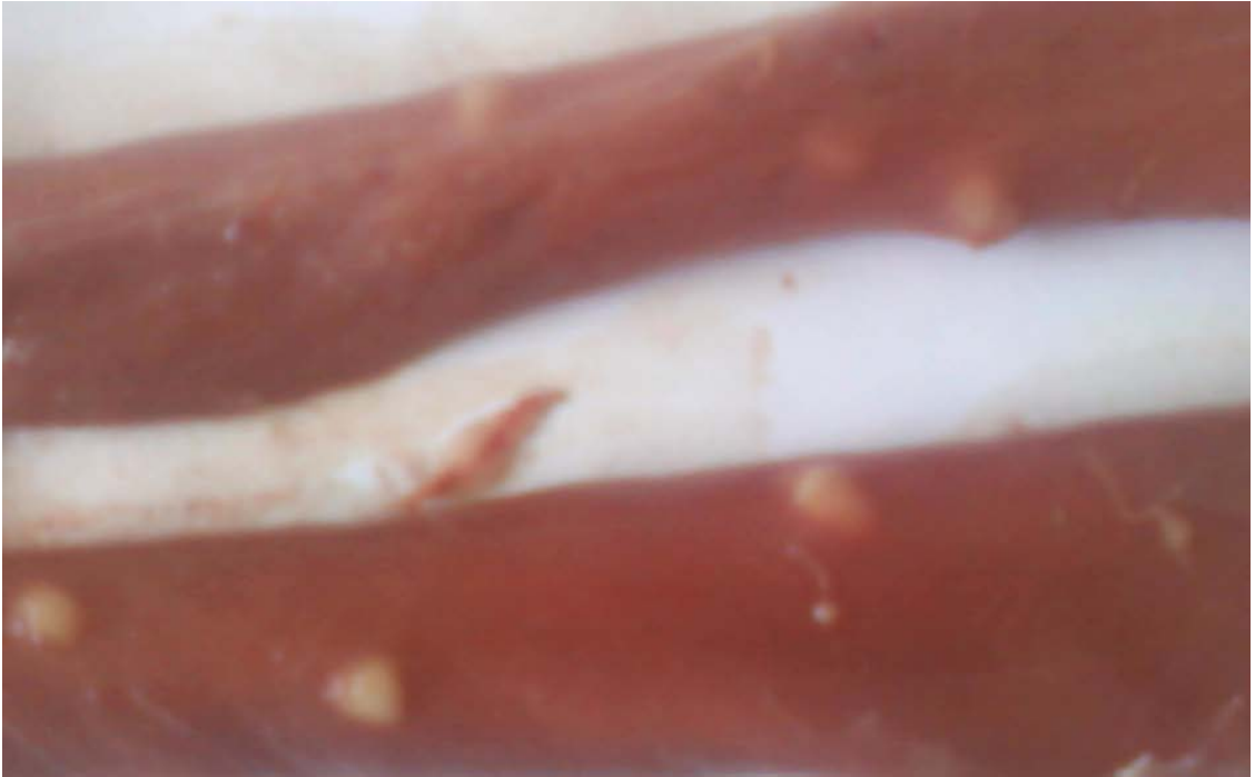
Şekil 3. Özafagusta makroskopik kistlerin görünüşü (5-6 yaşında ♀ Kıvırcık ırkı koyunlar)