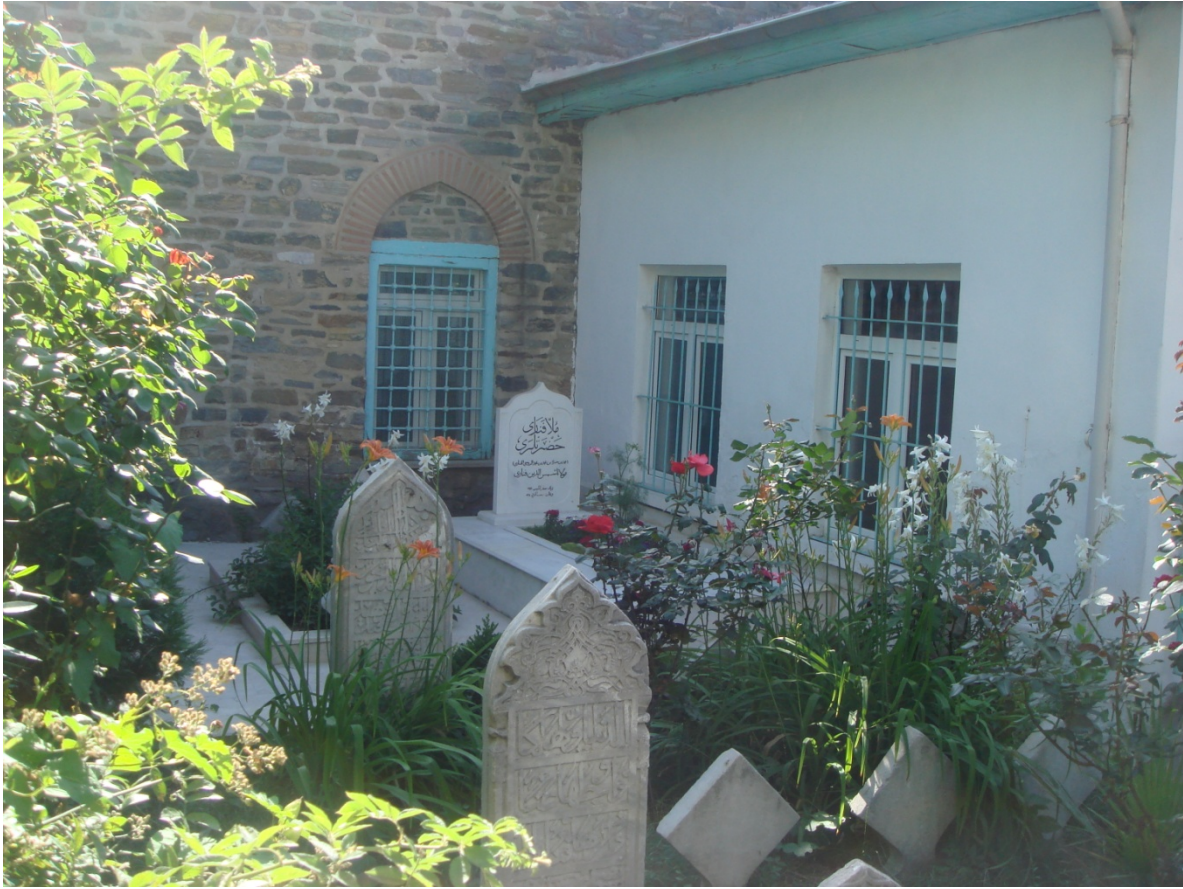
EK 10- Molla Fenârî haziresinden bir görünüm.