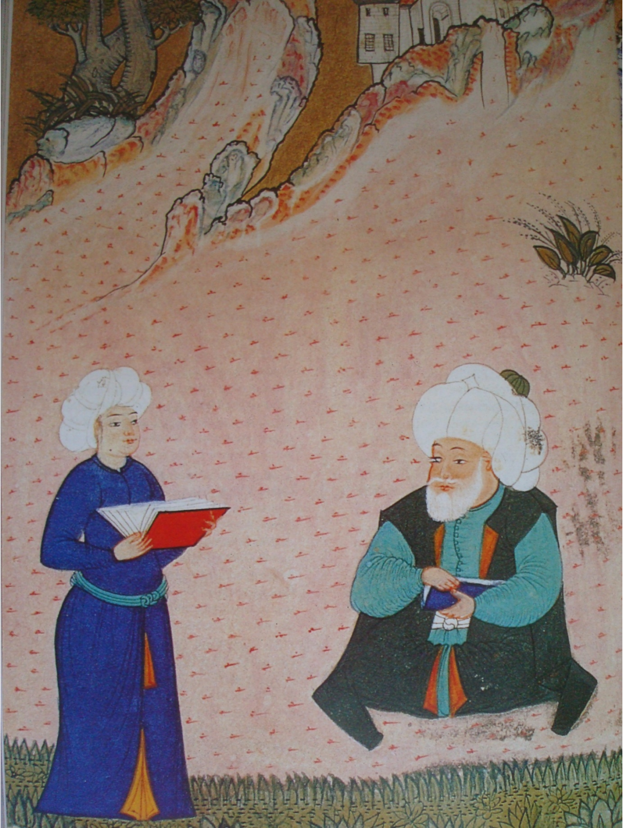
EK 8- Alaaddin Ali Fenârî ve bir talebesini resmeden minyatür.