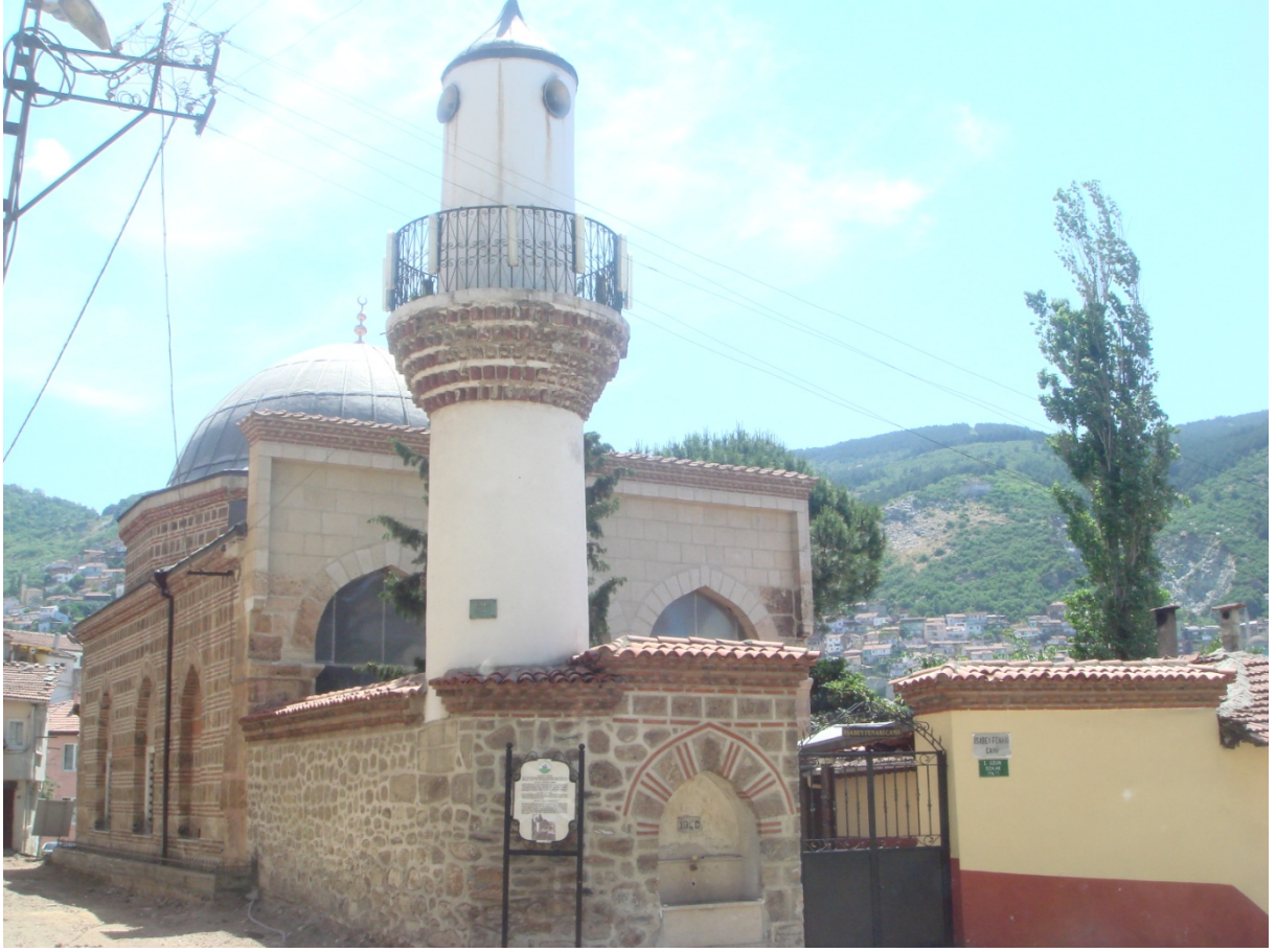
EK 12- İsa Bey Fenârî Camii, Bursa.