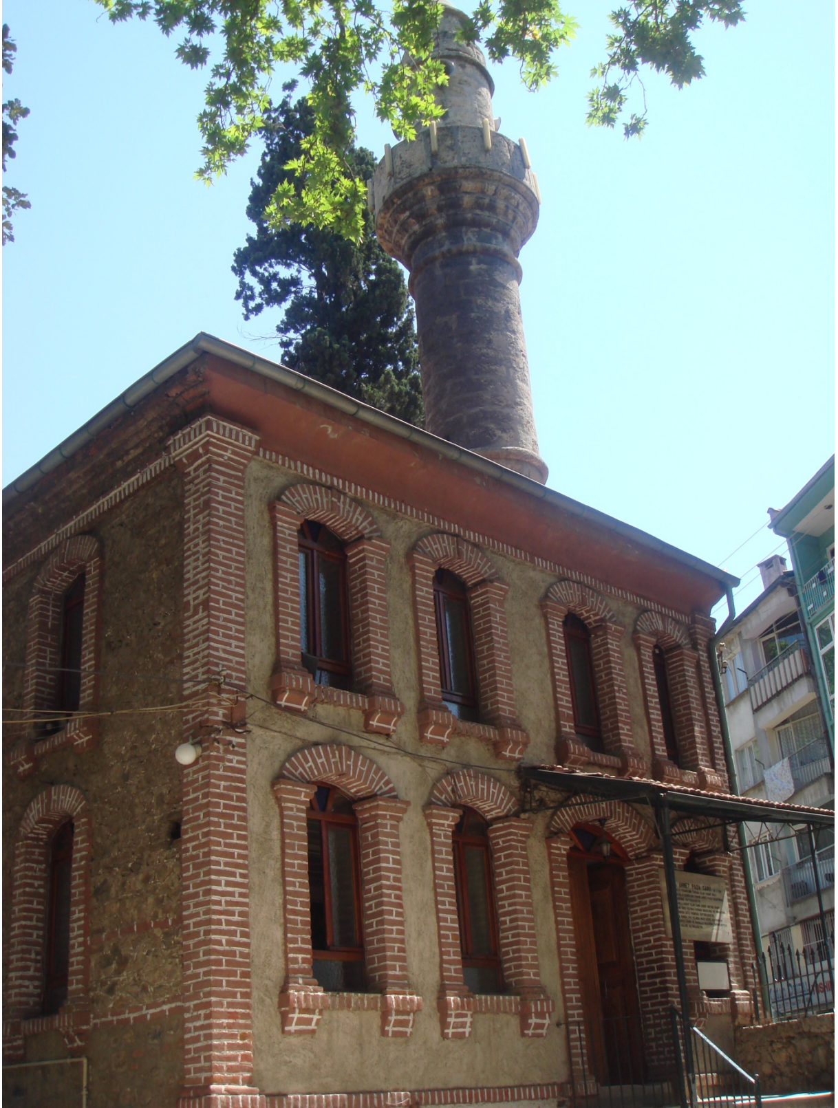
EK 11- Ahmed Paşa Fenârî Camii, Bursa.