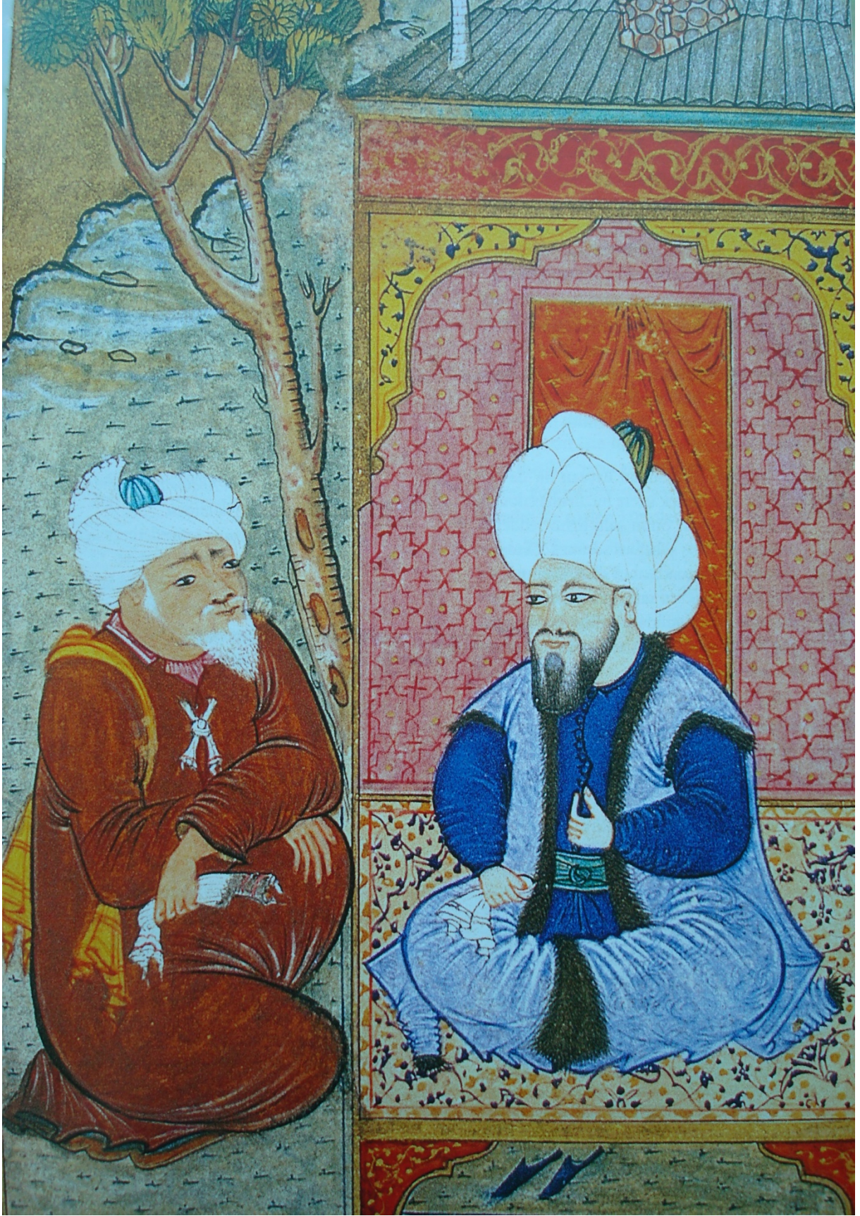
EK 7- Molla Fenârî ve Yıldırım'ı resmeden bir minyatür. TSMK. Hazine 1283 Şakâ-yık-ı Nu'mâniye vr.22a.