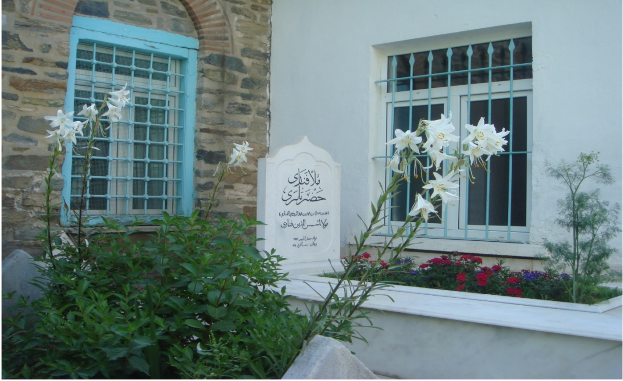
EK 9 -Molla Fenârî'nin mezar taşı.