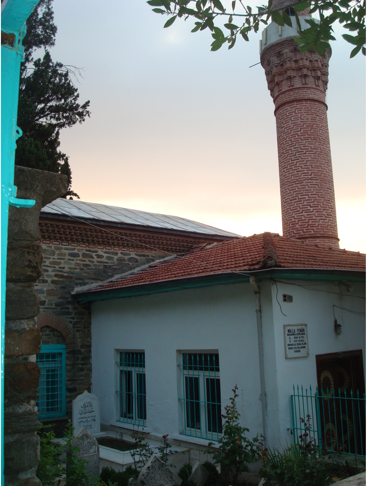
EK 13- Molla Fenârî Camii, Bursa.