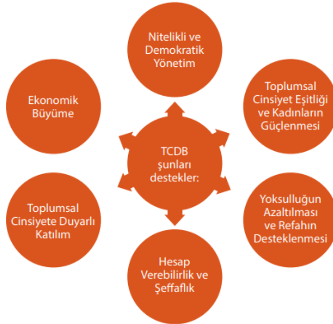
Resim 2.2.: Toplumsal Cinsiyete Duyarlı Bütçelemenin Yararları