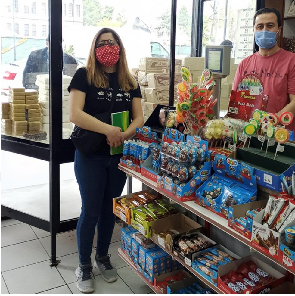
Çankırı'nın meşhur olan tuzu