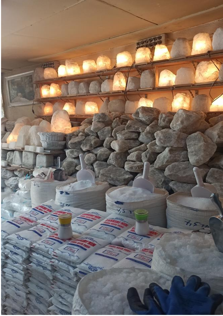
Çankırı'da attar dükkanlarına ait fotoğraflar