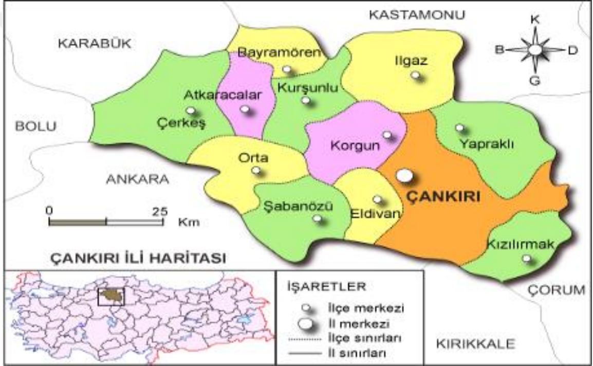
Harita 1: Çankırı ili haritası ( http://cografyaharita.com/turkiye_mulki_idare_haritalari2.html )

Ülkemizin İç Anadolu Bölgesi'nde yer alan Çankırı güneyinde Ankara, batısında Bolu, kuzeybatısında Karabük, kuzeyinde Kastamonu, doğusunda Çorum ve güneydoğusunda ise Kırıkkale illeri ile çevrelenmiştir. Bu şirin ilimiz coğrafi konum olarak 40-41° kuzey paralelleri ile 32-34° doğu meridyenleri arasında bulunmaktadır. Kızılırmak ana havzası ile Batı Karadeniz ana havzası arasında yer alan Çankırı'nın rakımı 730 metre olup toplam yüzölçümü 7.388 km 2 genişliğindedir. (Çankırı Valiliği , 2014, s.1)