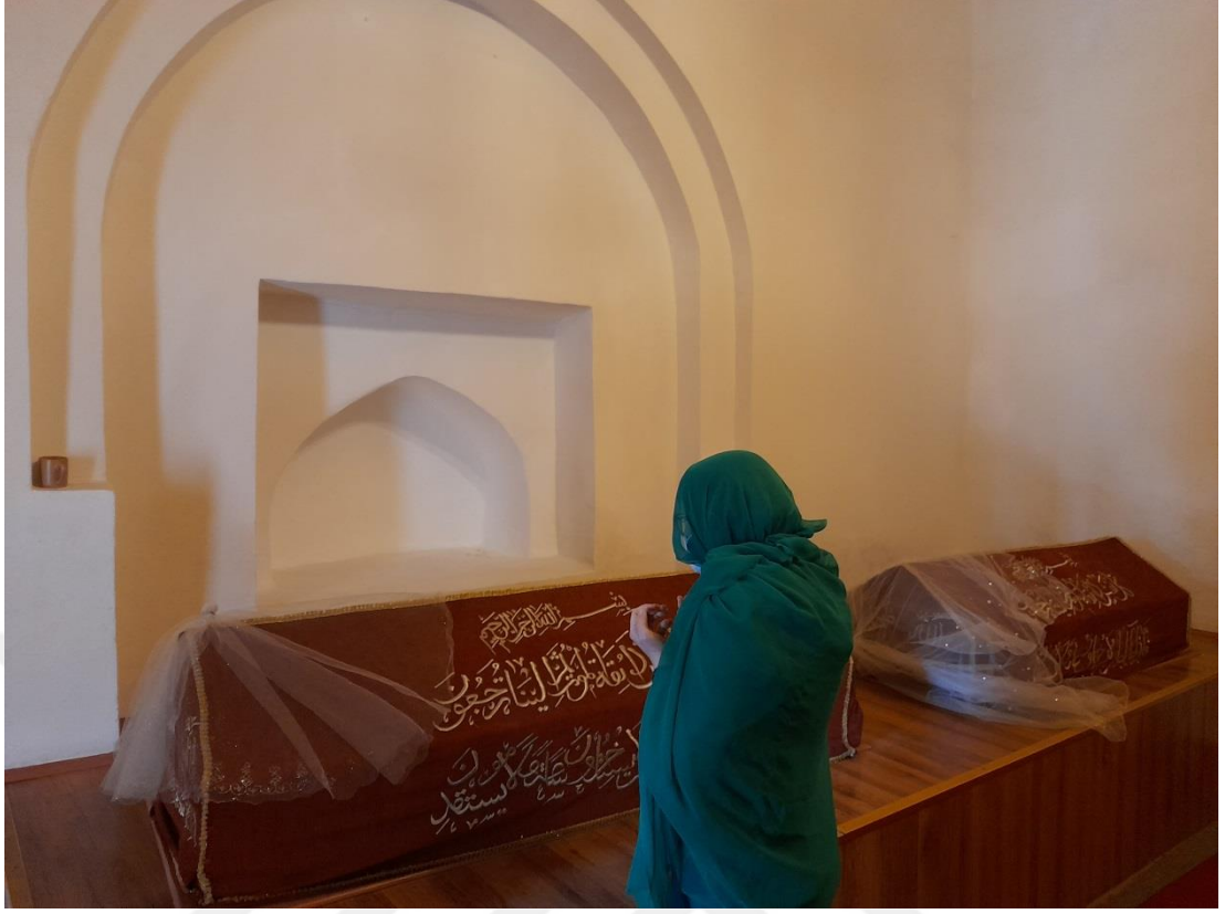
Fotoğraf 2 Karatekin Türbesi'nde dua edip dilek dileyen kadın