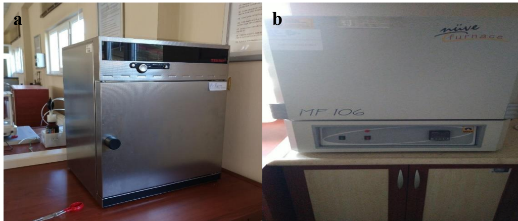
Şekil 3.4 Kurutma fırını (etüv, a), kül fırını (b)

Çalışmalarda kullandığımız şeftali budama artıkları ve patlıcan bitki artıklarından elde ettiğimiz peletlerdeki nem oranlarının tayini kurutma işlemini gören Şekil 3.4.a ‘da verilen fırında (ETÜV) yapılmıştır. Kül oranlarının tayini ise Şekil 3.4.b ‘de verilen kül fırını (Nüve MF 106) ile yapılmıştır (Şekil 3.4).