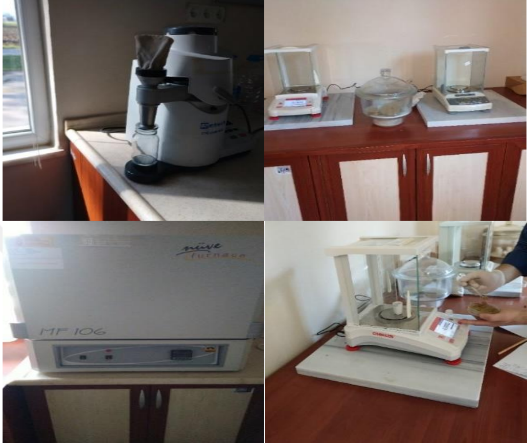
Şekil 3.11 Fırında kül değerleri tespiti.

Dayanıklılık; Dayanıklılık testi için 3.15 mm çaplı yuvarlak delikli eleğe 500 g pelet örnekleri koyularak 10 dk süreyle çalkalandı. Daha sonra test cihazının sol tarafında bulunan hazneye yerleştirilmiştir. Cihaz çalıştırılarak 10 dk süreyle parçaların hazne içerisindeki testi başlatılmıştır. Aynı işlemi 3 karışım içinde 3 kez tekrarlanmıştır. Cihaz 10 dk çalıştıktan sonra durdurularak içindeki pelet materyali 3.15 mm çaplı yuvarlak delikli elek kullanılarak tekrar elenmiştir. Peletlerin dayanıklılık direnci Anonim (2010) standardına göre belirlenmiştir. Peletlere ait mukavemet dirençleri aşağıdaki formül ile yüzde (%) cinsinden hesaplanmıştır.