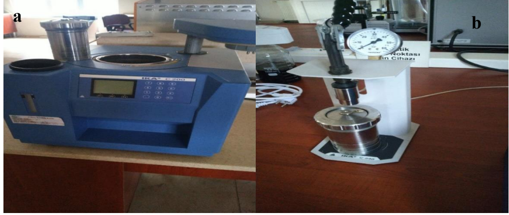
Şekil 3.5 Kalorimetre (a), oksijeni dolduran cihaz (b)

Peletlere ait sağlamlık mukavemetleri 0.5 beygir gücünde motor, motorda bulunan redüktörün devri 50 min -1 , kafese ait ölçüler 300x300x125 mm ve kafesin iç merkezine doğru çaprazlama simetrik olarak yerleştirilen 50 mm eninde olan, 230 mm uzunluğunda bulunan bir levhaya (baffle) ve Anonim (2010), standardına sahip dayanıklılık test cihazı kullanılarak gerçekleştirilmiştir. Baca gazı emisyon ölçümleri için peletlerin yakılması için gerekli soba ve 5 tane elektro magnetik sensörü bulunan taşınabilir gazölçüm makinesi Optima7 kullanılmıştır (Şekil 3.6).