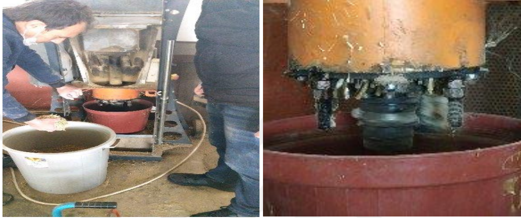
Şekil 3.3 Pelet makinesi

Şeftali budama artıkları ile patlıcan budama artıklarının pelet haline getirilmesinde 3 kW motor gücüne sahip, materyalin büyüklüğüne göre saatte 50-100 kg olan pelet 6 mm çapında ve 1040 mm boyunda ayarlı pelet yapan makina tercih edilmiştir. Şekil 3.3’de pelet imalatında kullanılan makine verilmiştir. Bu makina; düz kalıplı dairesel sıralı deliklerden, sıkıştırma silindirlerinden, pelet boyunu ayarlamaya yarayan ünitenen, elektrik kontrol panosundan ve materyal deposunda oluşmaktadır.