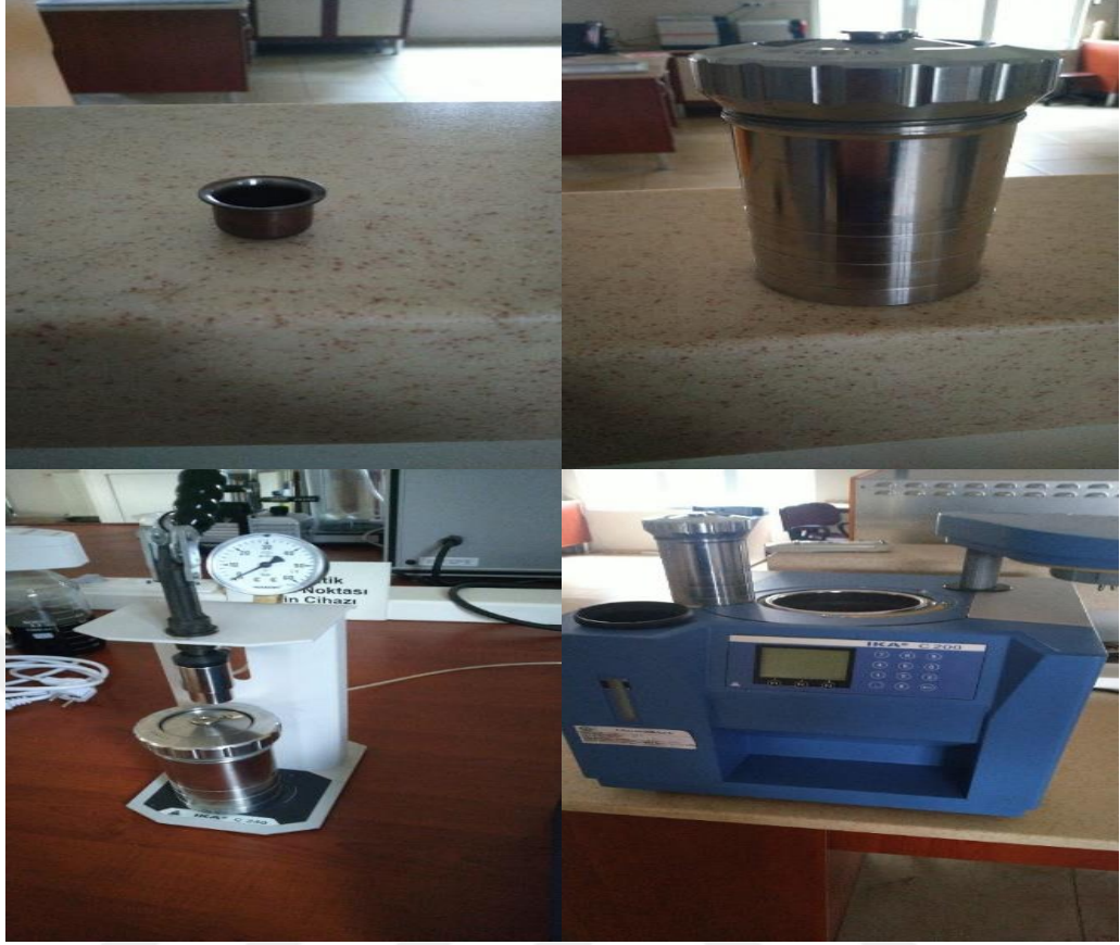
Şekil 3.10 Kalorimetre cihazı ile alt ısıl değerlerin tespiti.

Kül; Porselen malzemedan yapılmış krozeler 550-600 °C’ de kül fırınında en az 4 saat bekletilerek desikatöre koyulmuş, soğutulduktan sonra ölçümleri yapılmıştır. Daha sonra krozeler sabit ağırlığa gelmesi için kül fırınına bırakılarak beklemeye geçilmiştir. Krozelerimiz arzu edilen ağırlığa gelince ortalama 1’er g ağırlığında hazırlanan numuneler (etüvde kurutulmuş) tartılarak ve fırına bırakılmıştır. Burada üç farklı zaman diliminde üç farklı sıcaklıkta beklemeye tabi tutulmuştur. Fırının ısısı oda ısısından 105 °C’ye artırılarak bu ısıda 12 dk beklemeye geçilmiştir. Isı 10 °C/dk yükseltilek 250 °C’ye artırılarak 30 dakika bekletilmeye tabi tutulmuştur. Sıcaklık 20 °C/dk artırılarak 575°C’ye çıkartılmış ve bu ısıda 180 dk bekletilmesinin ardından ısının 105°C ye inmesi beklenerek ve krozeler desikatöre koyularak soğutulduktan sonra ölçümleri yapılmıştır. Kül miktarları, Anonim, (2013) ölçütüne göre kül fırınındaki işlemler vasıtası ile belirlenmiştir. Kül muhteviyatı aşağıdaki formül ile tespit edilebilmektedir.