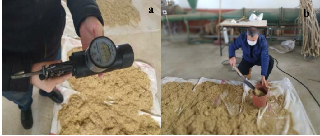
Şekil 3.8 Parçalanmış şeftali budama artıkları (a), Parçalanmış patlıcan bitki artıkları (b).

Öğütülmüş şeftali budama artıkları (şekil 3.8.a) ve patlıcan bitki artıkları (şekil 3.8.b) plastik kovalara konulmadan önce yoğunlukları, nem içerikleri ve kuru madde miktarları belirlenmiş ve peletleme denemelerini yapmak üzere hazır hale getirilmiştir. Deneme materyalleri ile peletleme işlemine geçmeden önce şeftali budama artıkları ve patlıcan bitki artıkları 5 kg materyal ayarlanmıştır. Karışım oranları da 5 kg denk gelecek şekilde şeftali budama artıklarının ve patlıcan bitki artıklarının karışım peletleri; sırasıyla %80 şeftali budama artıkları %20 patlıcan bitki artıkları, %60 şeftali budama artıkları %40 patlıcan bitki artıkları, %40 şeftali budama artıkları %60 patlıcan budama artıkları belirlenen oranlarda hazırlanarak homojen olması açısından kovalarda karıştırılmış ve peletlenmeye hazır hale getirilmiştir. Pelet karışım oranları, isimleri ve kısaltmalar Çizelge 3.1’de verilmiştir.