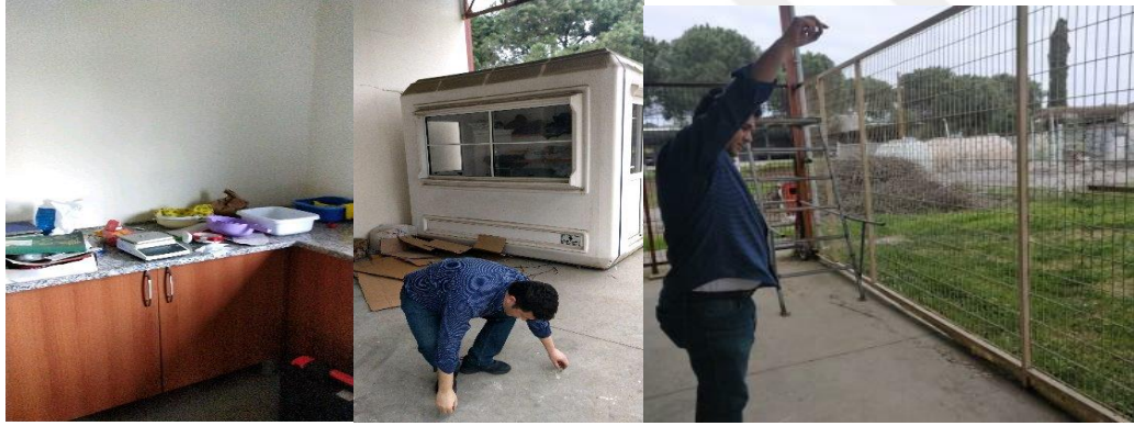
Şekil 3.13 Pelet kırılma direnci testi

m_a : Analizden sonra elenen pelete ait ağırlık (g)