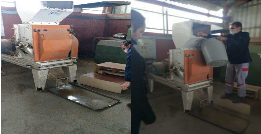
Şekil 3.2 Çekiç özellikli değirmen

Çalışmadaki analizler Samsun Karadeniz Tarımsal Araştırma Enstitüsünde bulunan tarımsal enerji çalışmaları yapılan bölüme yürütülmüştür. Şeftali budama artıkları ve patlıcan bitki artıklarına ait hammadde materyalleri saatte 2.5 ton hammaddeyi öğütebilen 22 kW motor gücüne sahip ve 2, 4, 6, 8 mm eleklerine sahip öğütme haznesinde 24 adet çekiç bulunan ve adını buradan alan Şekil 3.2’de öğütümün yapıldığı değirmenin resimleri verilmiştir.