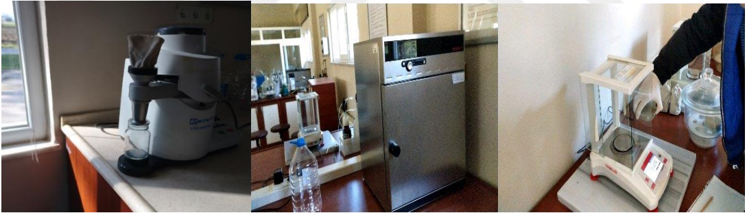
Şekil 3.12 Pelet nem miktarı testi için kullanılan cihaz.

m_{p3} : Kurutma sonrası kuru örnek kabı ve örnek ağırlığıdır (g).