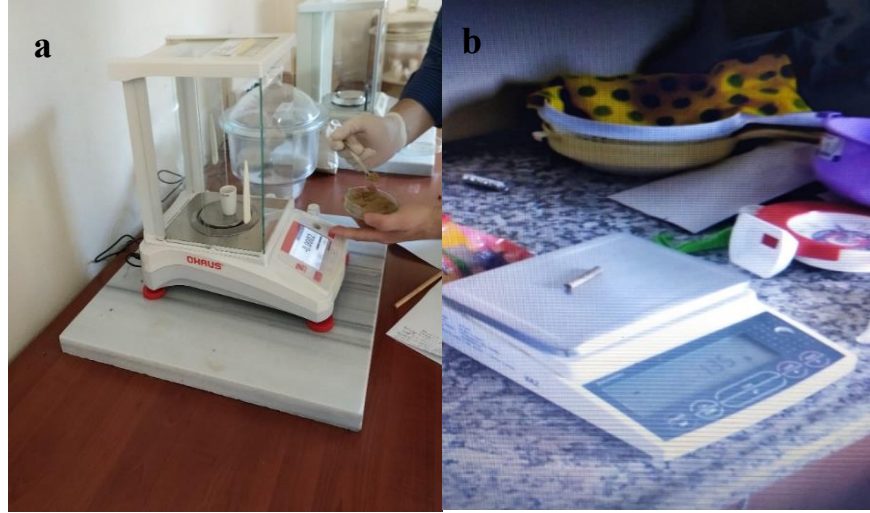
Şekil 3.7 0,01 g hassasiyetli (a) ve 1 g hassasiyetli teraziler (b).