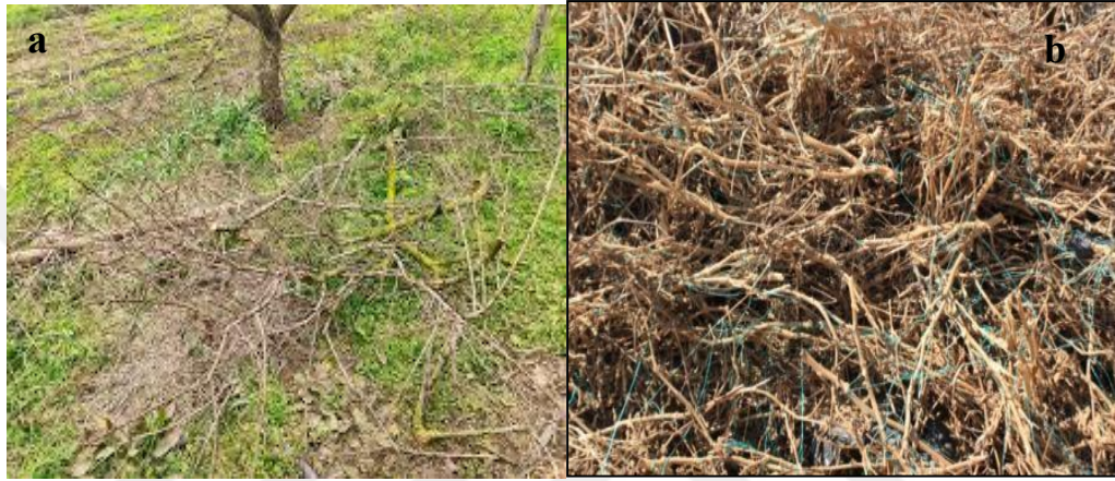
Şekil 3.1 Şeftali budama artıkları (a), Patlıcan bitkisi artıkları (b)

Çalışmada şeftali ağacına ait budamadan arta kalan materyaller ile patlıcan bitkisine ait artıklar kullanılmıştır. Çalışmada kullanılan şeftali dalları ve patlıcan bitki artıkları Samsun ilinin Canik ilçesine bağlı Demirci mahallesinden temin edilmiştir. Şekil 3.1’de çalışmada kullanılan şeftali budama artıkları ve patlıcan bitkisi artıklarının görselleri verilmiştir.