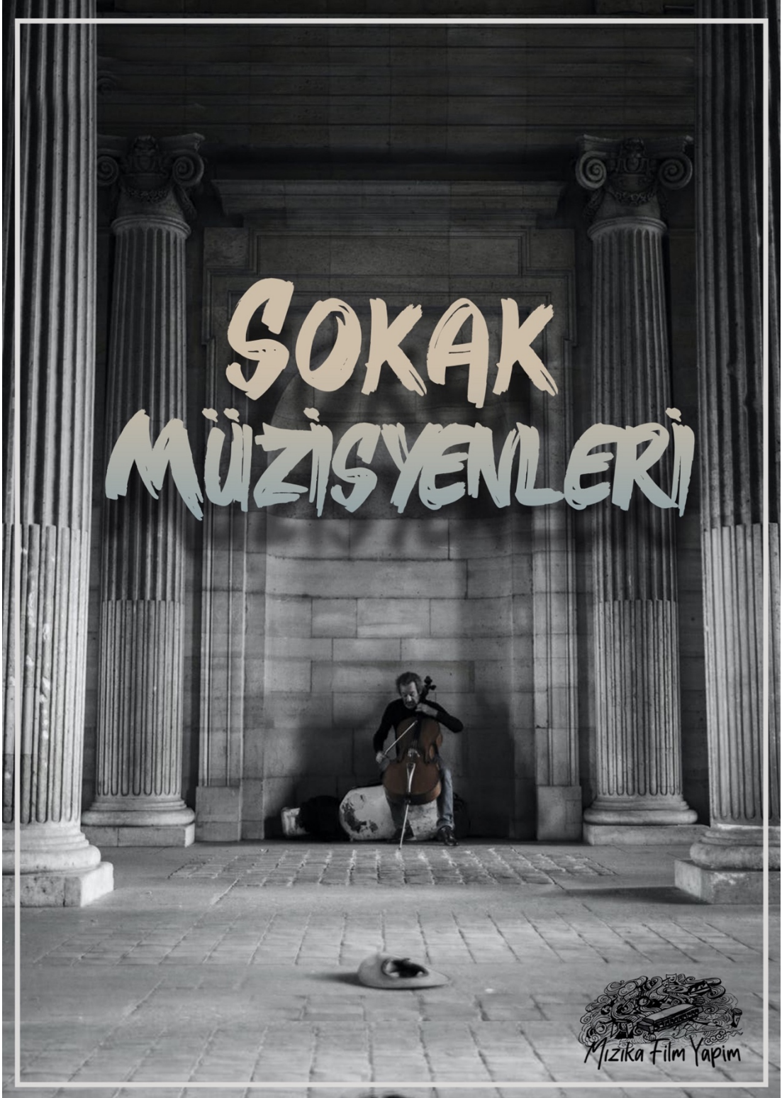
Görsel 3: Çalışmanın Afiş Tasarımı