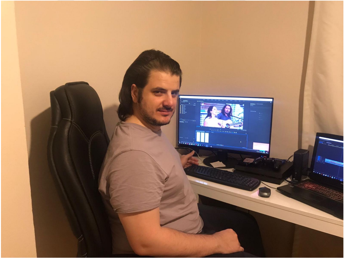
Görsel 2: Kurgu Aşaması