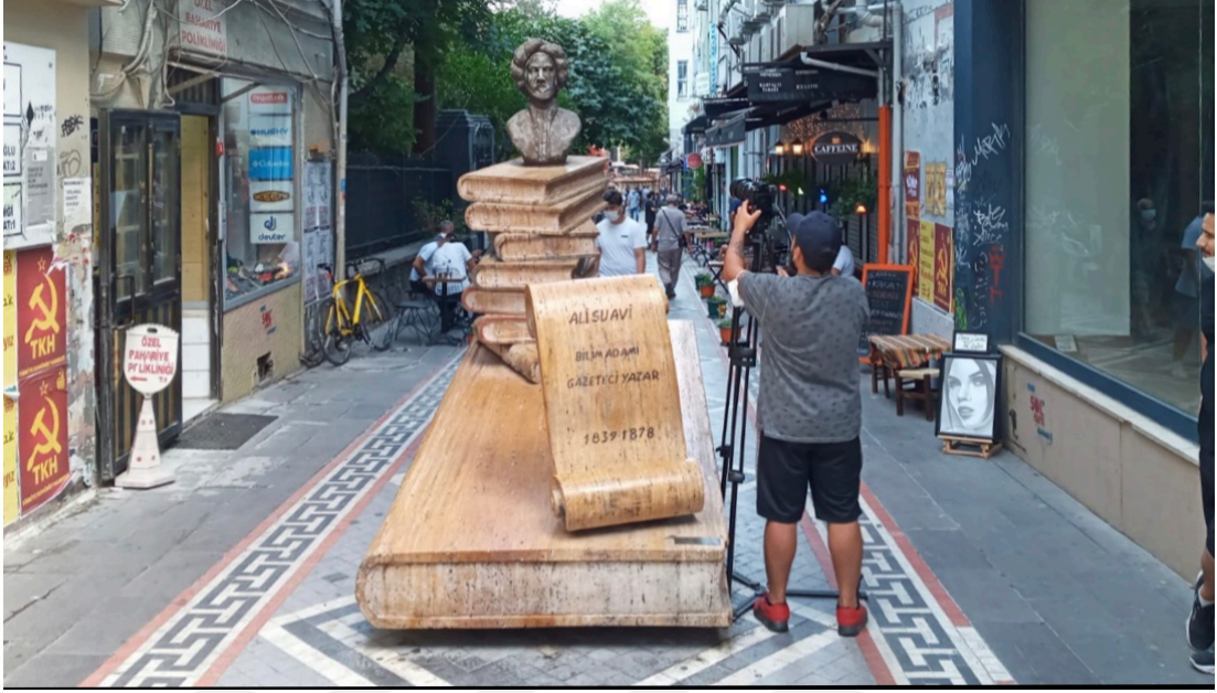
Görsel 4: Kadıköy Detayları Çekiminden