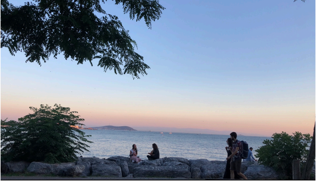
Görsel 7: Moda Sahili Müzisyenler Son Performans