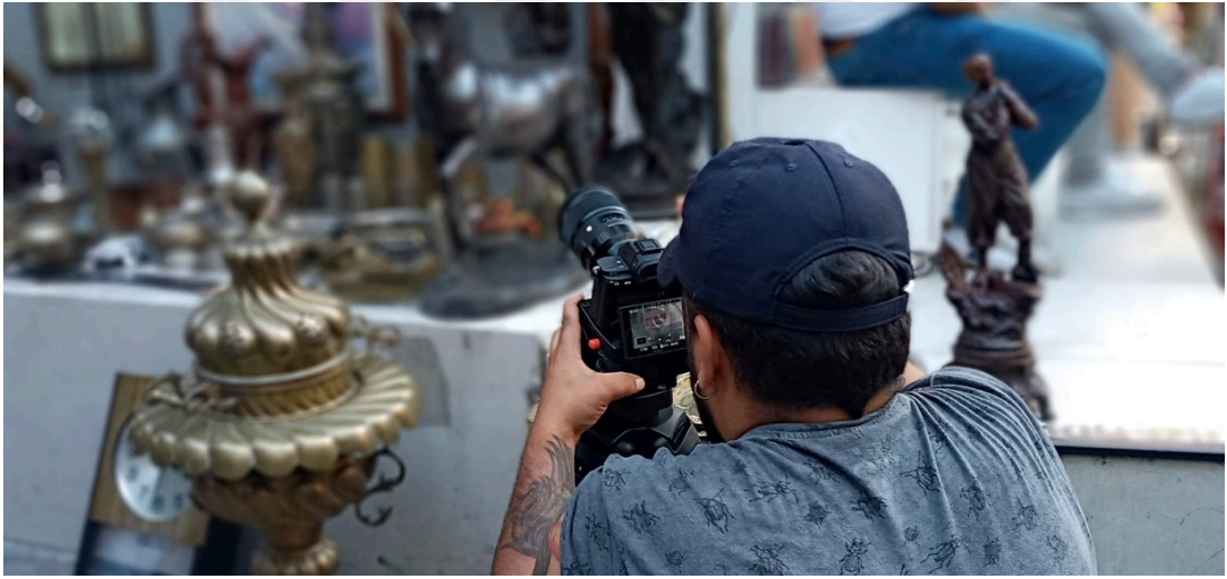
Görsel 5: Kadıköy Detayları Çekiminden