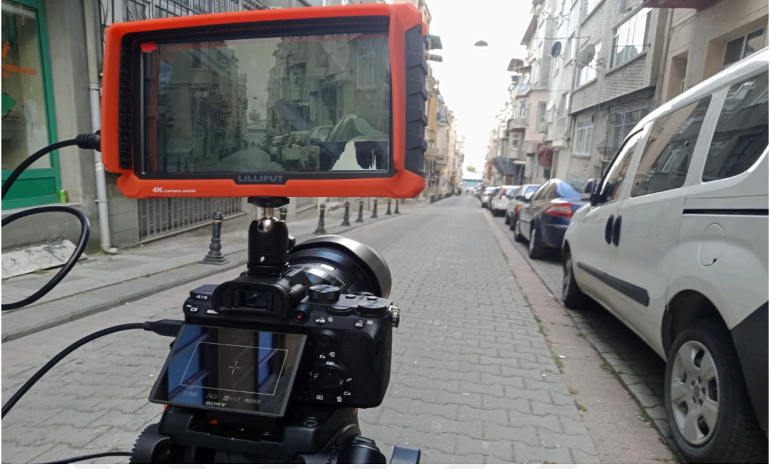
Görsel 6: Kadıköy Detayları Çekiminden