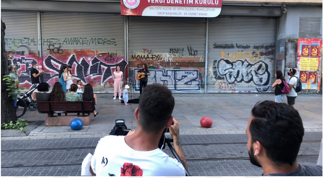
Görsel 8: Müzisyenler Bahariye Performansı