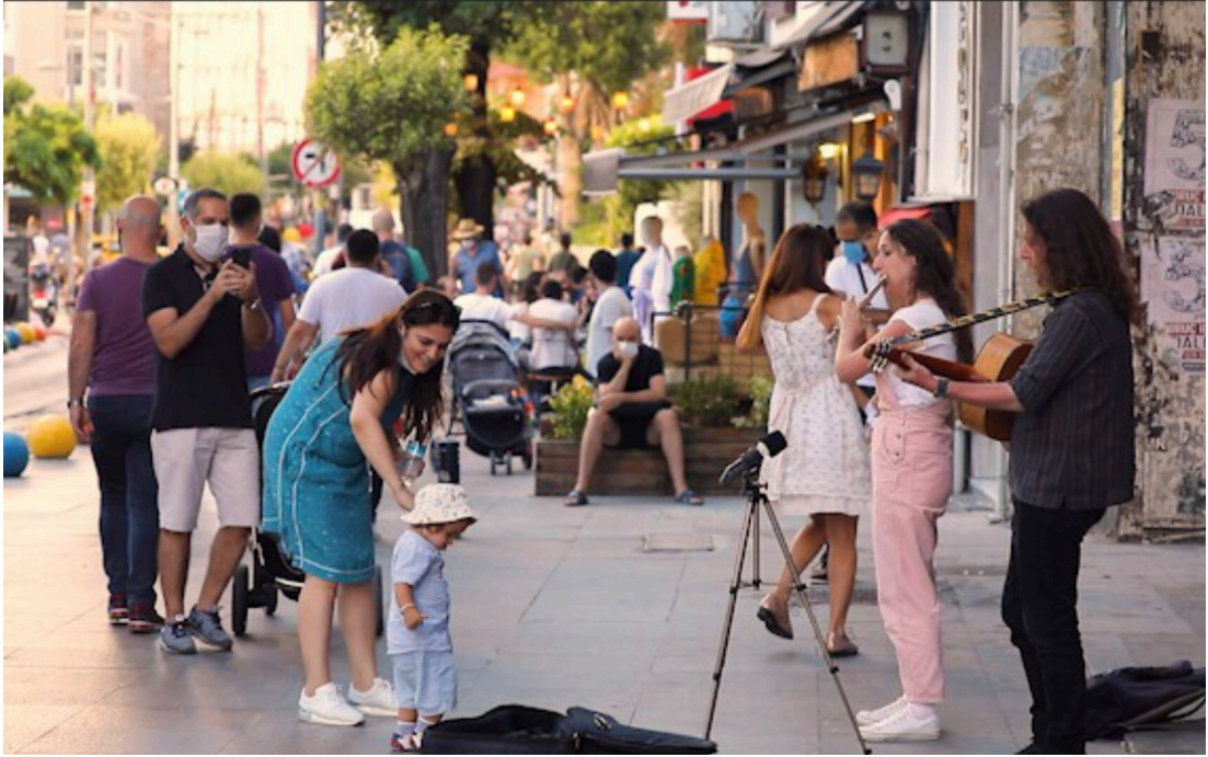
Görsel 9: Müzisyenler Bahariye Performansı