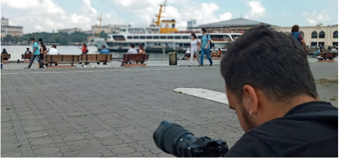
Görsel 10: Kadıköy Rıhtım Açılış Sahnesi