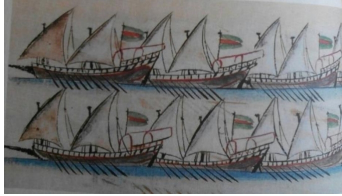
Resim 3. Firkateler 130