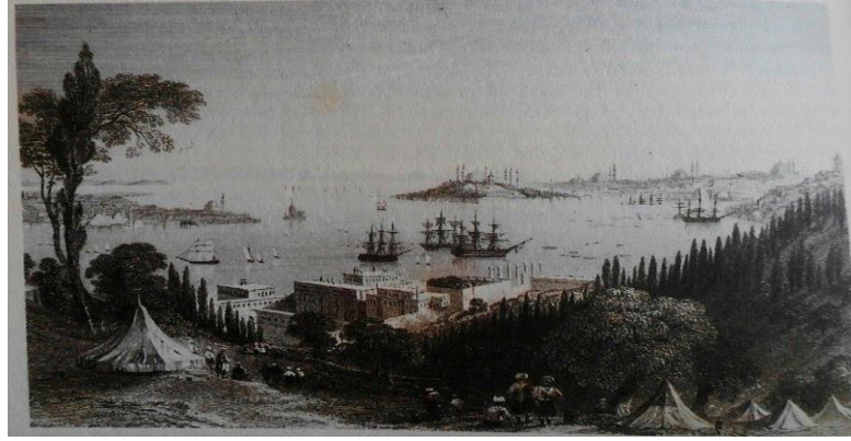
Resim 2. Haliç ve Tophane önlerinde Osmanlı kalyonları 115

Kalyon, gemi modeli olarak kadirga örnek alınarak yapılmış olup diğer yelkenli savaş gemilerine göre gövdesi uzundur. Kalyonlarda kadirgalardan farklı olarak en önemli ihtiyaç malzemesi yelkendi. 116 Kadirgalar ise gayet uzun ve dar, kısmen su seviyesinde denecek kadar alçak ve hareketleri pek seri olan gemilerdi. 117 Bu vasıta, süratli hareket eden gemilerden olduğu için yelken turunda da kullanılmaktaydı. Kadirgalar, insanın binmesine mahsus ve gazâ ile cihad için binilen seçkin atlara, kalitalar da deve ve katırlara benzemektedir. 118