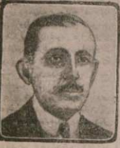
آقره وار هم به نطق ایراد ایدین نامور کارانه

بر نطق مارک دهلاوردتا ، آقره برم نامور کارانه آرزولمری تقدیر آقهدی ، دیور آراسر ، ایتایا خارجه نظریهاری (دهلاوردتا) طرفند برنق کور اوله ایراد ایدین نطق خلاصهسی تبلیغ ایجیشل ایدی . ( دوزولنال دودان ) مکر نطق شره دایر اولان فلسفی