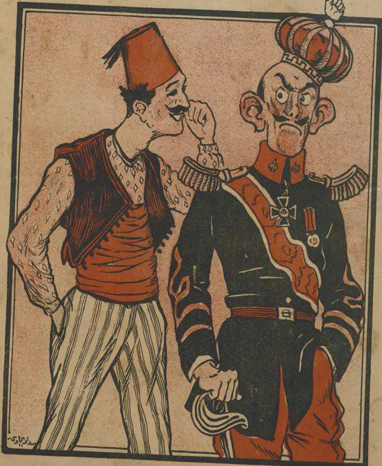
— نصلش دودو کم آقرہہ کپرکن آباغی قوندرمی سیدی !

*** مرہفہ درماتندہ بختیہ کوئٹہ لیدر اوتور ، مسلکندہ مستقل ادنی ، سیاسی ، مزاح غزہ سیدر ***