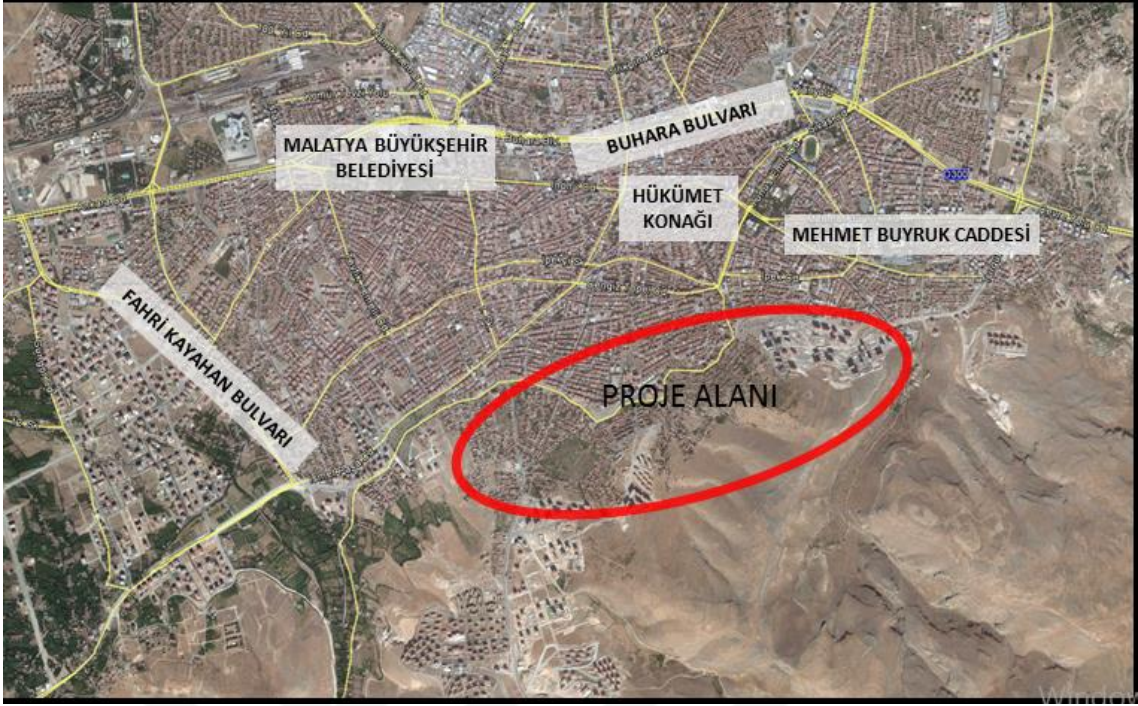
Resim 9: Kentsel Dönüşüm ve Gelişim Planlama Şube Müdürlüğü