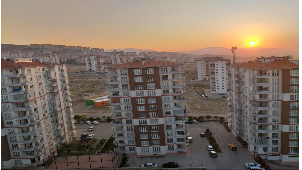
Resim6. Yüksekten Gün Batımı