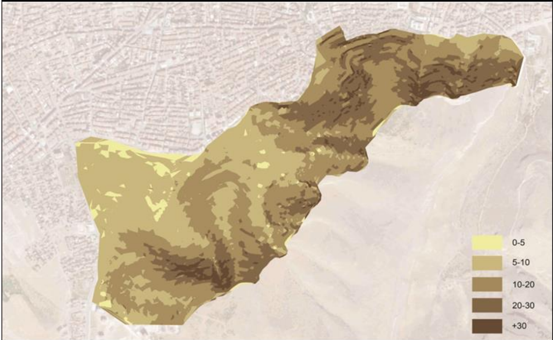
Resim 10: Eğimin Kent Merkezinden Çeperlere Doğru Attığı Görülmektedir