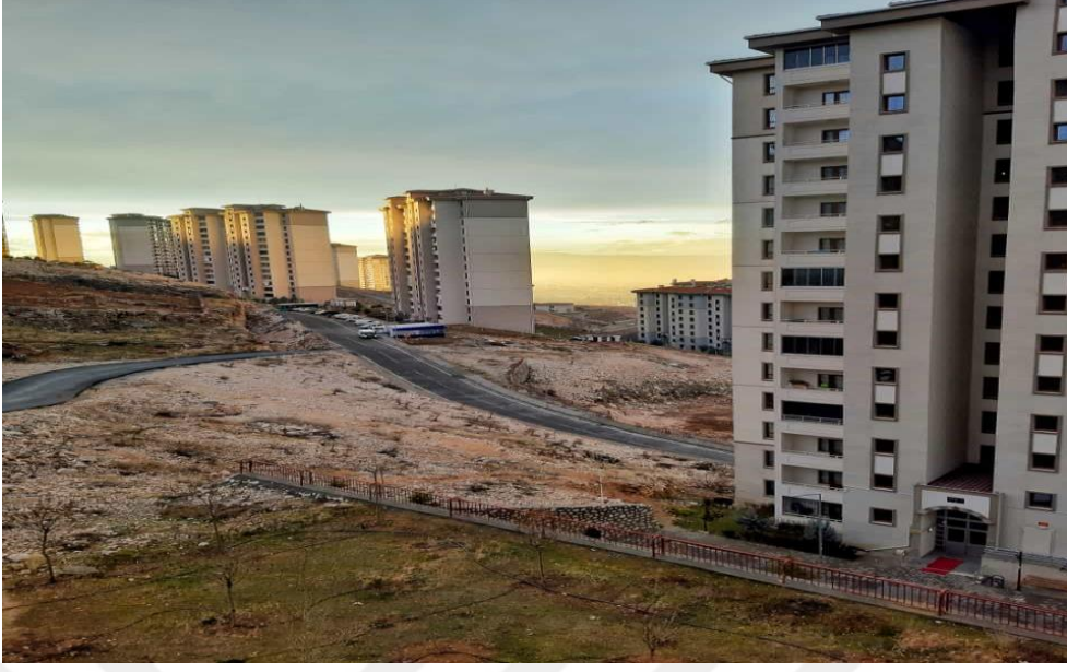
Resim 7: Binaların Yoğunluk Açısından Görünümü