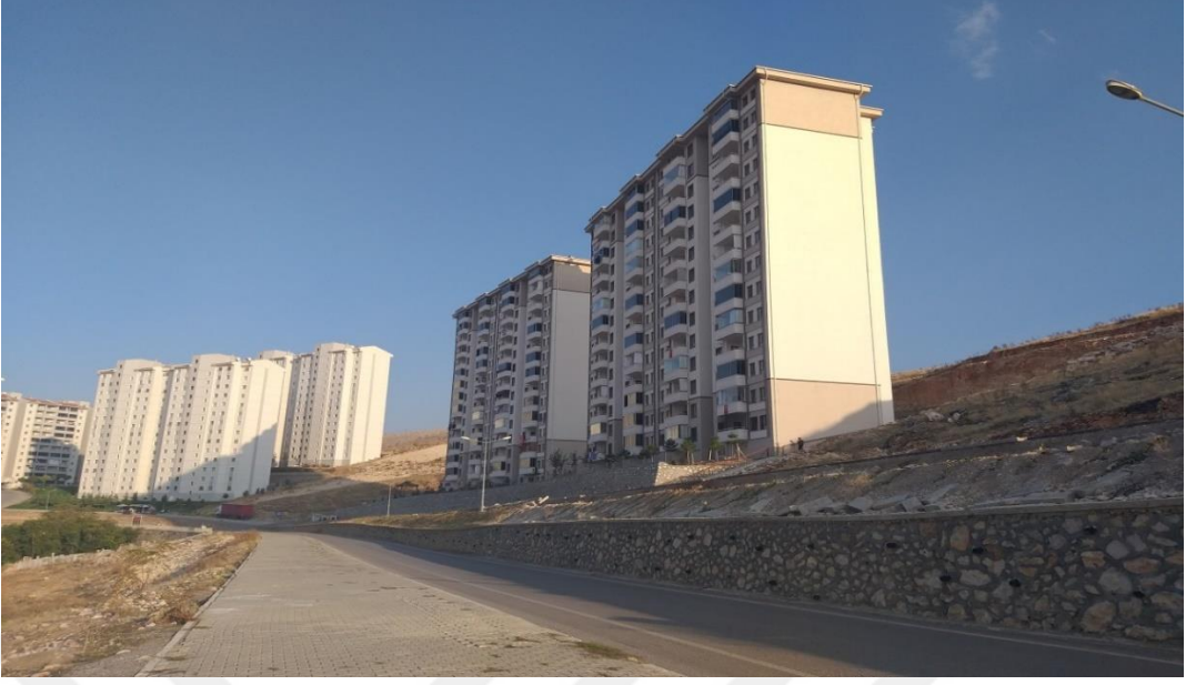
Resim 3. Kentsel Dönüşümden Sonra Yapılan Sitelerin Yüksekliği