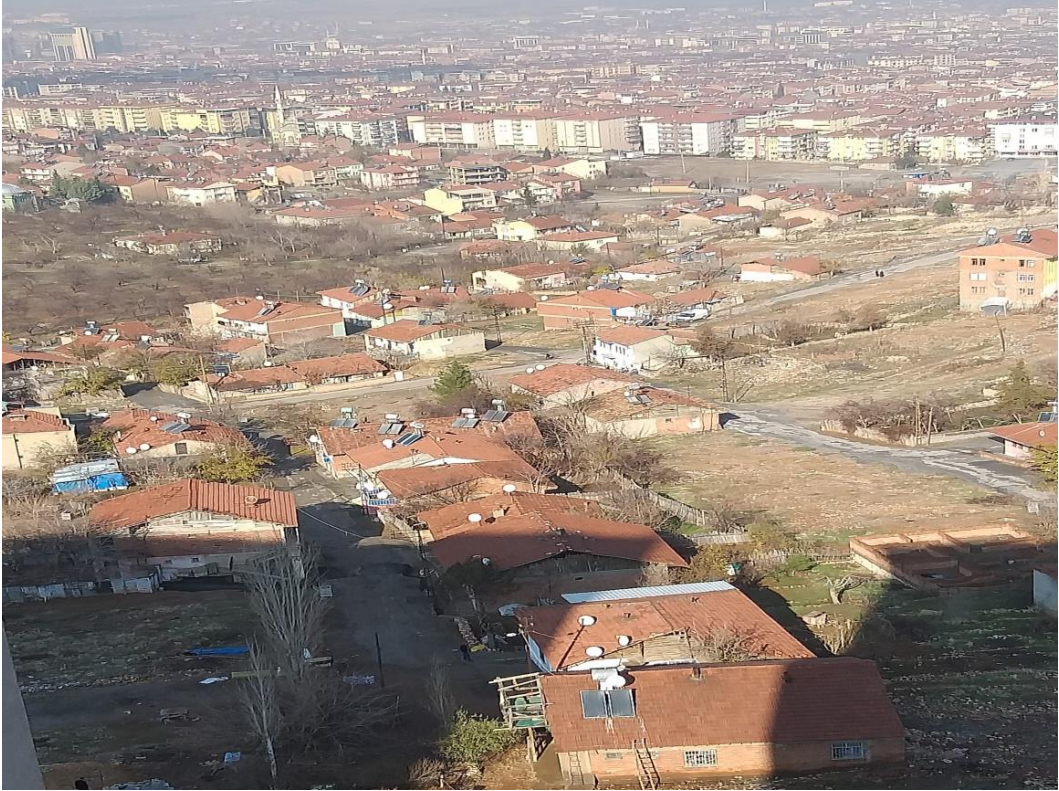
Resim 2. Göç İle Gelen Bireylerin Kendi İmkanları İle Oluşturdukları Alanlar