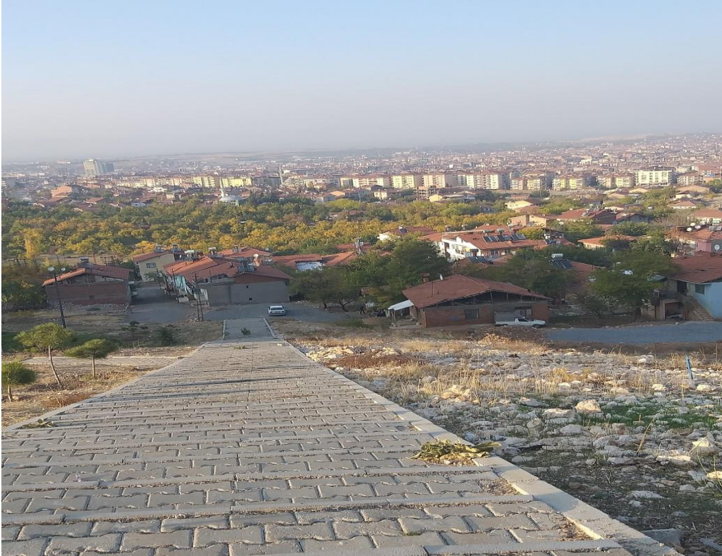
Resim 4. Dik Yokuşlar