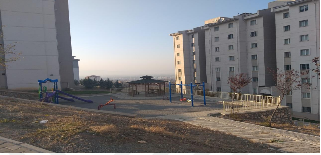
Resim 1. TOKİ Tarafından Yapılan Sitelerin Parklarından Bir Görüntü