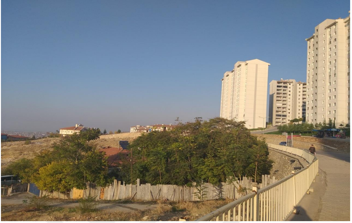
Resim 5. Site ve Müstakil Evleri Ayıran Yol