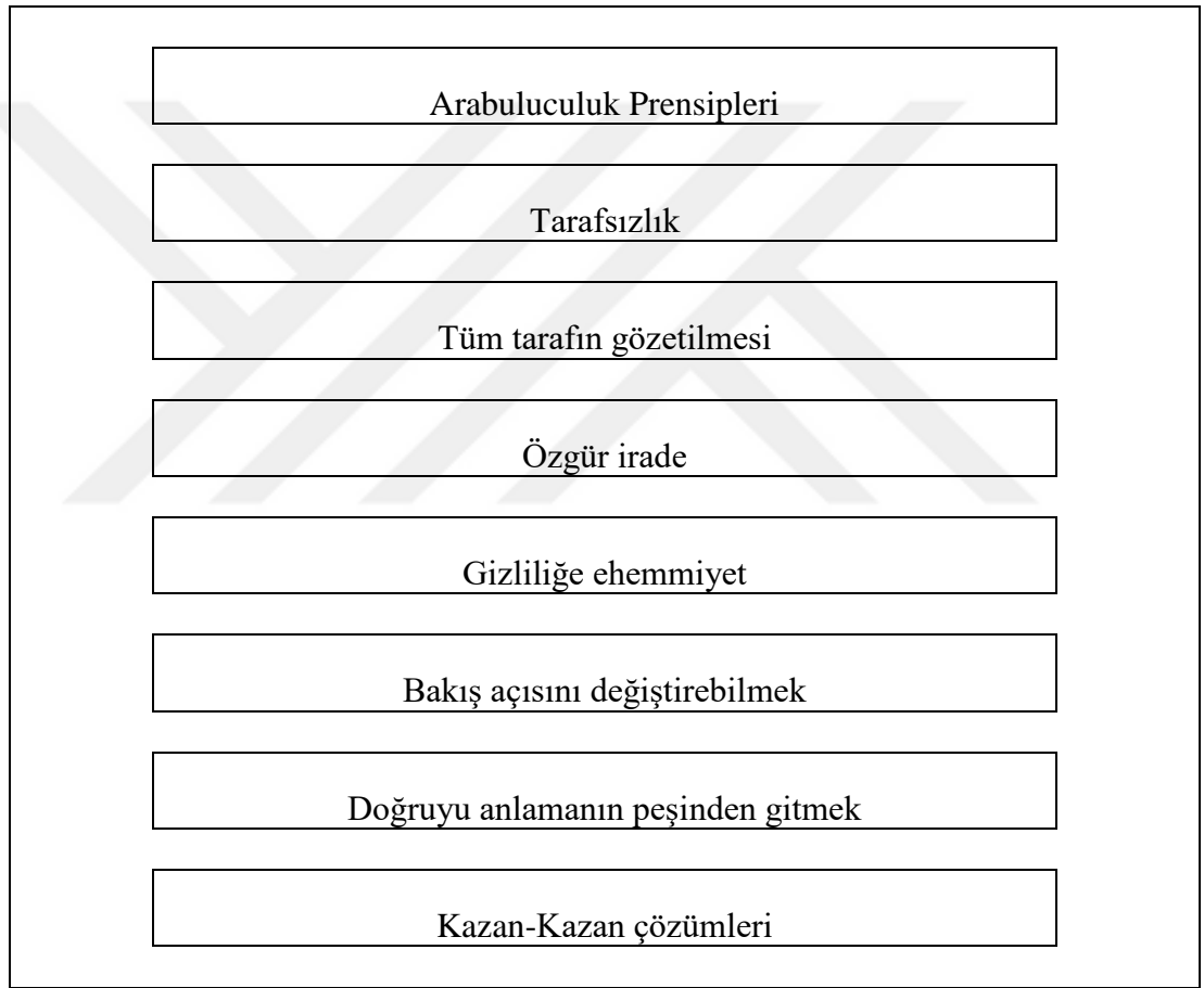
Şekil 2: İş Hayatında Arabuluculuk ve Prensipler

İş hayatında yaşanan uyuşmazlıklarda arabuluculuğa duyulan ihtiyaç kapsamında arabuluculuğun temel prensiplerinin belirleyici bir rolü vardır. Bu prensipler aşağıdaki şekil üzerinde gösterildiği gibidir.