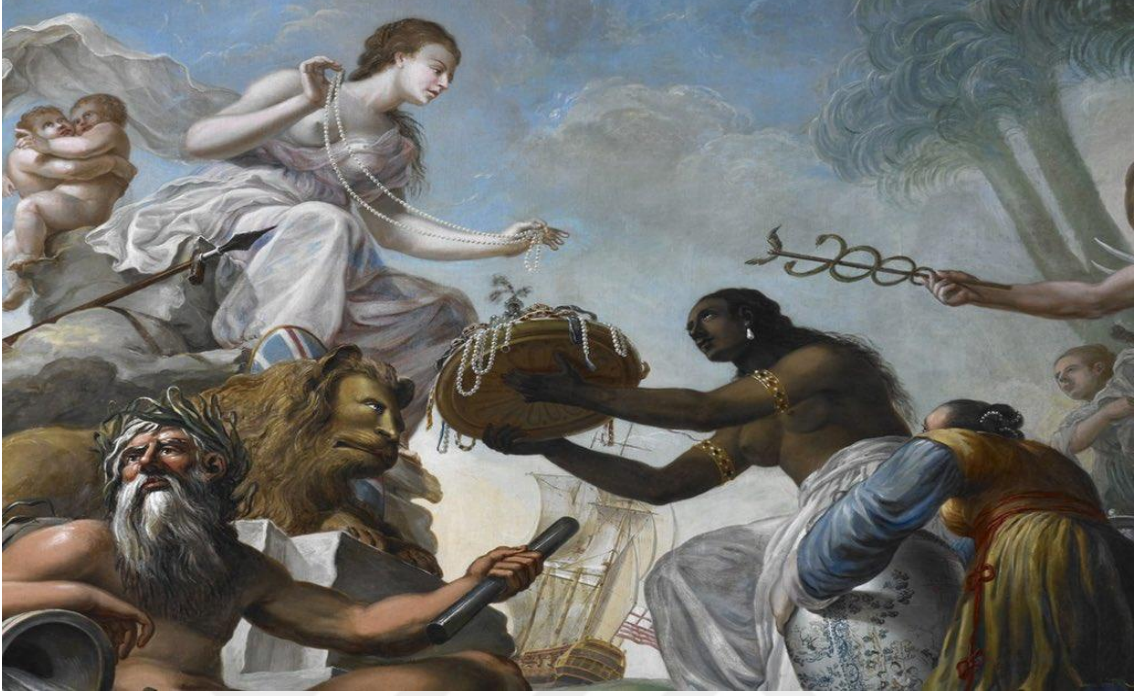
Kaynak: British Library, Spiridione Roma, East Offering its Riches to Britannia.

Bengal'in işgali sonrası İngilizler Hindistan'da egemen güç haline gelmiş ve rakiplerinin ülkeden tamamen çıkartılması için çalışmalara başlamışlardır. Öncelikle Bengal ile beraber Bihar ve Orissa gibi güçlü bölgelerde egemenlik ele geçirilmiş ve bu bölgelerde kurulmuş olan FDHK ve HDHK yerleşimleri hedef alınmıştır. İlk olarak Chandernagore'de bulunan ve daha önce etkisiz hale getirdiği Fransızları sonrasında ise Biderra bölgesinde bulunan Hollandalıları Bengal'den tamamen temizledi. Karşısında kendisine karşı koyacak başka bir Batılı güç bırakmadı.