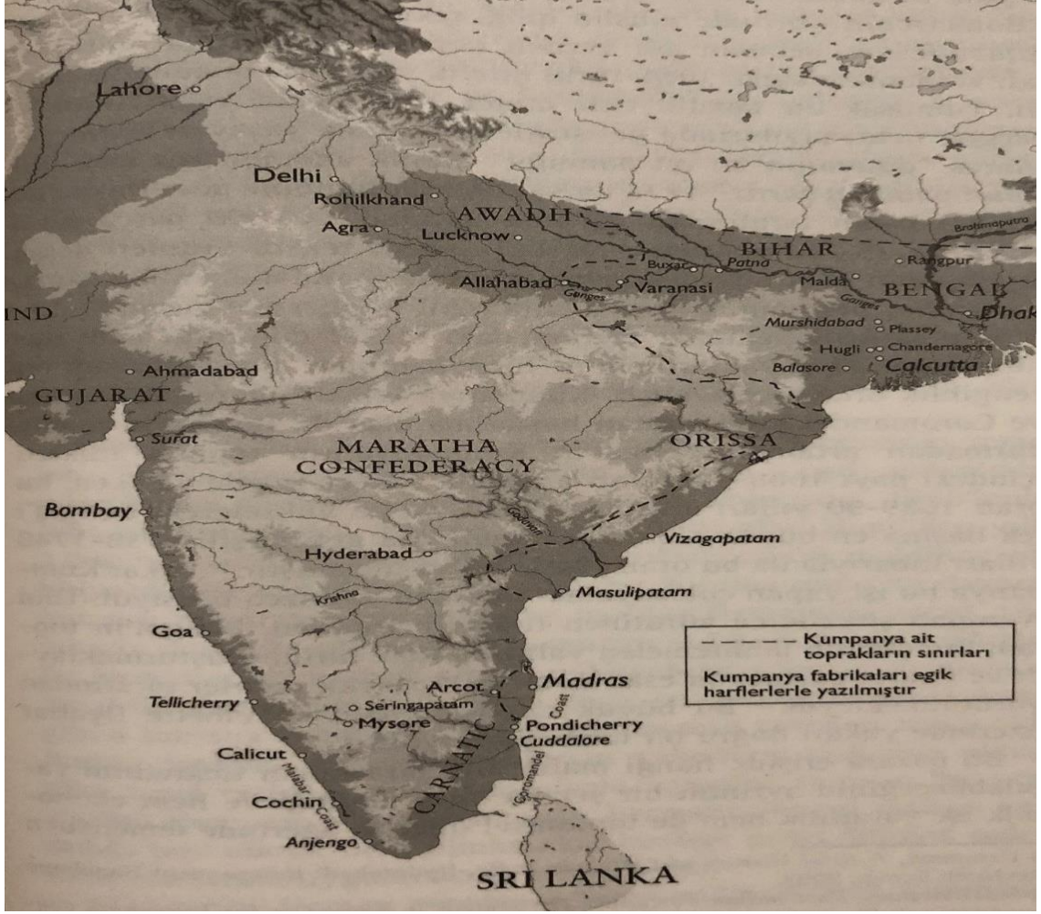
Harita 2: 1760 Sonlarında Hindistan