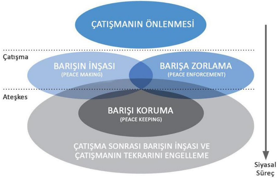
Şekil: 1: BM Çatışma Önleme Görseli

üzere özellikle çatışma ve/veya ateşkes dönemlerinde farklı barış operasyonu yöntemleri, sürdürülebilir barışın inşası için bir arada işletilmektedir (UN Peacekeeping, 2008: 18; Dilek ve Romya, 2009: 91; Kutlu, 2018: 67).