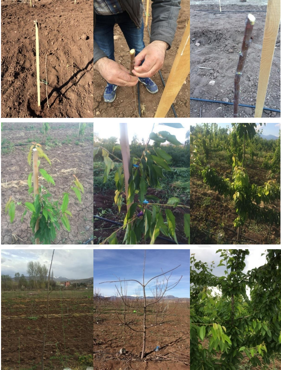
Şekil 3.3 Deneme alanında VCL budama sisteminin görünümü