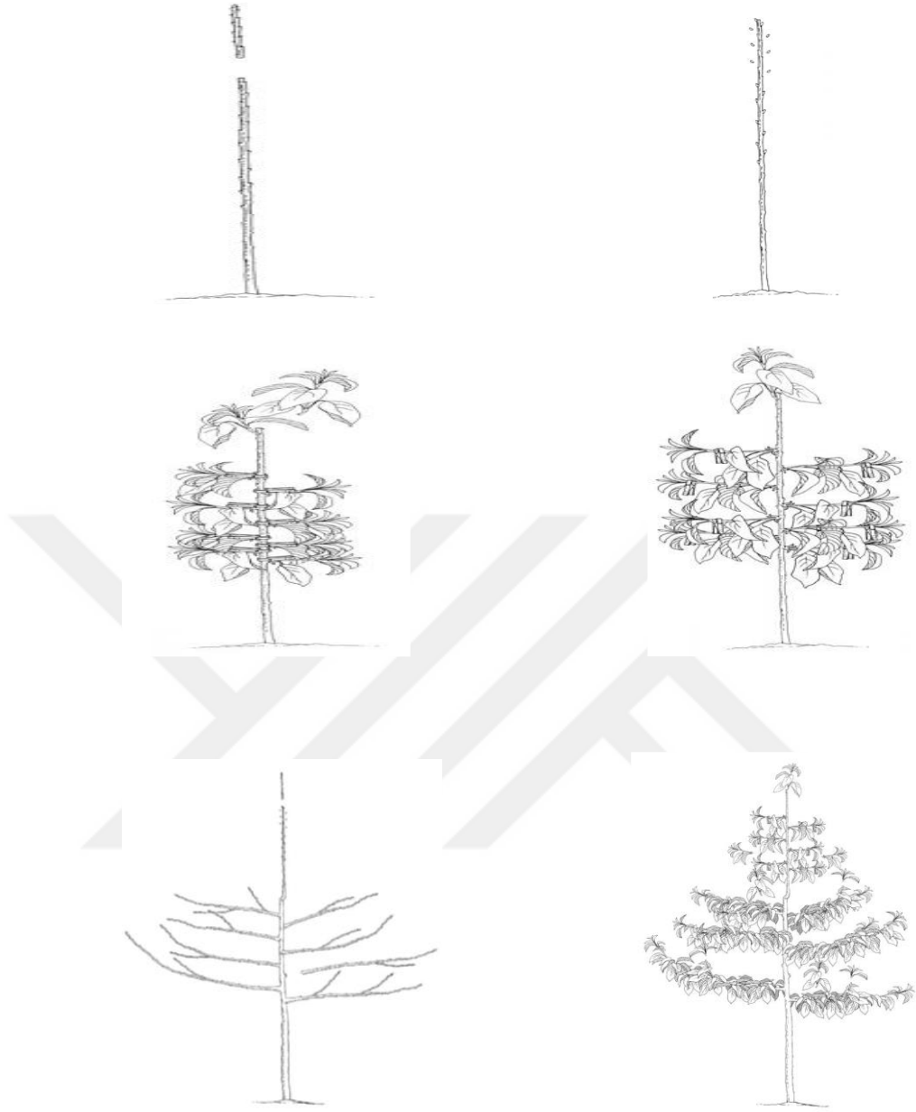
Şekil 3.2 VCL budama sisteminin gelişim safasına göre görünümü