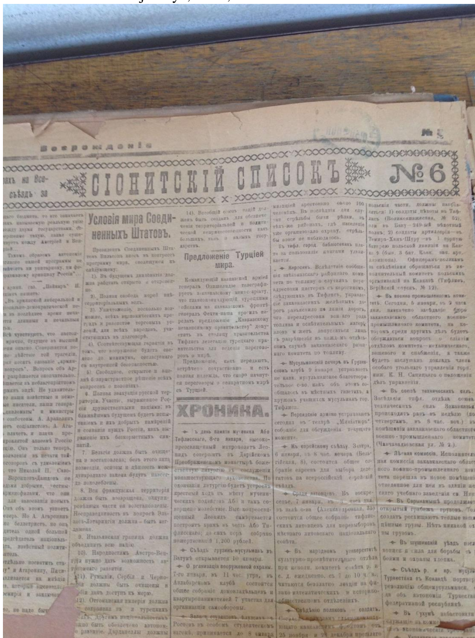
Güney Kafkasya Hükümeti'nin Türkiye'ye Barış teklifi