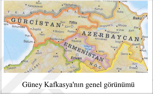
Güney Kafkasya'nın genel görünümü

Kafkasya, Karadeniz ve Hazar denizi arasında yer alan, Avrupa ile Asya'nın sınırında bulunan bölgedir. Kafkas sıradağlarında, Avrupa'nın en yüksek dağı olan Yalbus (Elbrus) Dağları bu bölgede bulunmaktadır. Kafkasya bölgesi siyasi ve coğrafi olarak Kuzey Kafkasya ve Güney Kafkasya olmak üzere ikiye ayrılır. Güney Kafkasya ülkeleri olan Gürcistan, Azerbaycan, Ermenistan bağımsız ve egemen devletlerdir. Kuzey Kafkasya ise Rusya Federasyonu içindedir 1 .