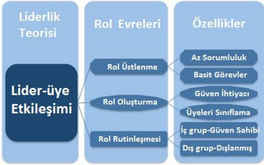
Şekil 1.3. Lider-üye Etkileşimi ve Rol Evreleri