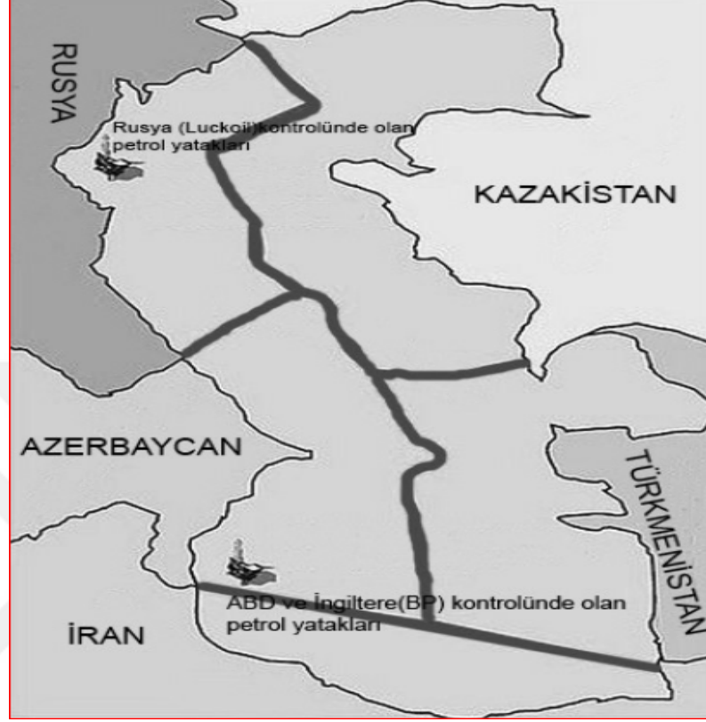
Şekil 2. Hazar'ın Orta Hat Prensibi Doğrultusunda Sınırlandırılması

Kaynak: Halit Mammadov, “Bölgesel Politikalar Açısından Azerbaycan-İran İlişkileri”, USAK , Cilt:8, Sayı:15, 2013, s.62.