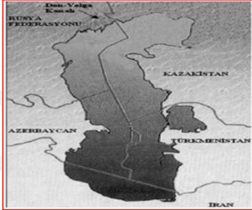
Şekil 4. Göl Statüsüne Göre Sınırlama