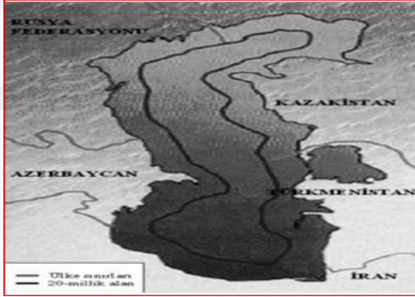
Şekil 3. Deniz Statüsüne Göre Sınırlama

Kaynak: http://www.turksam.org/tr/makale-detay/1185-orta-asya-enerji-ve-guc-mucadelesinde-4-hazar-zirvesinin-onemi , (e.t.27.07.2016)