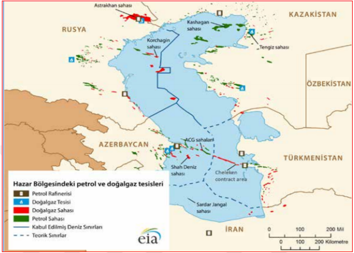
Şekil 1. Hazar’da bulunan petrol ve doğalgaz sahaları ve kıyıdaş devletler