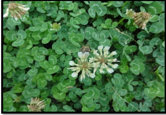
Şekil A. 22: Trifolium repens L.