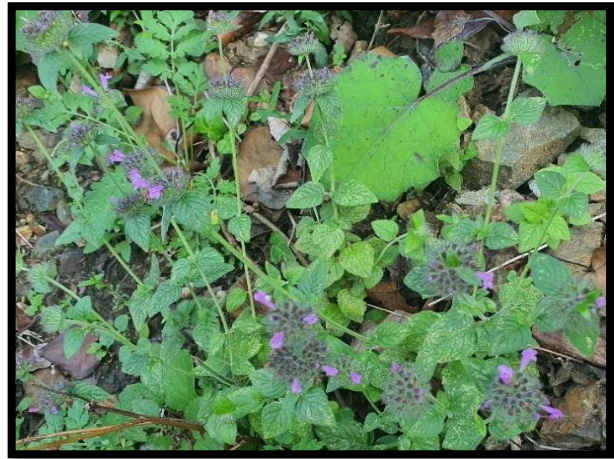
Şekil A. 30: Clinopodium vulgare L.