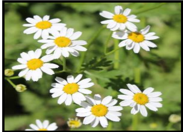
Şekil A. 12: Tanacetum corymbosum (L.) Sch.Bip.