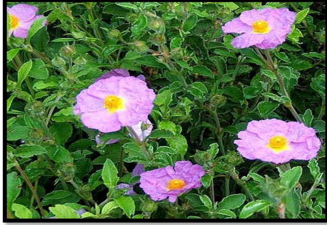
Şekil A. 16: Cistus creticus L.