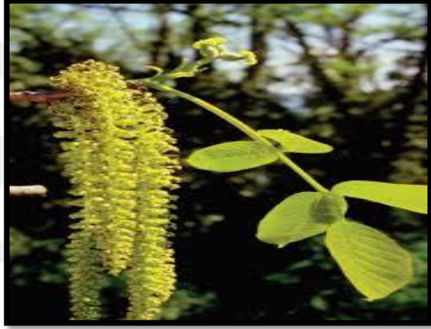
Şekil A. 29: Juglans regia L.