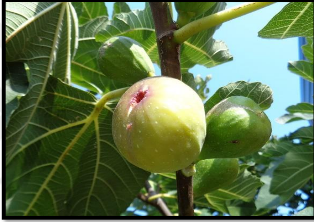
Şekil A. 35: Ficus carica L.