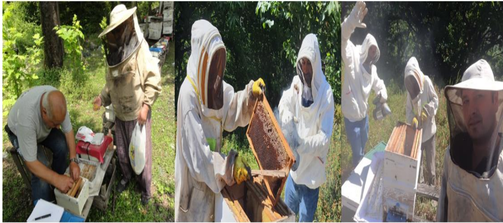
Şekil 4.1: Doğançay köyünde arıcılık yapanlara ait görseller.

Sakarya ili Geyve İlçesi Doğançay köyünde arıcılık faaliyetlerinde bal verimi yüksek bitki taksonlarını belirlemek amacıyla öncelikle 24 soruluk anket formu hazırlanarak yörede arıcılık yapanlar ile görüşmeler yapılmıştır. Doğançay köyünde toplamda 34 kişi ile görüşülmüştür. Anket araştırmasına katılanların bazı demografik özelliklerine bakıldığında; %5'i kadın, %95'i erkektir. Anket çalışmasına katılan arıcılık yapan katılımcıların ağırlıklı olarak yaş ortalaması 41-50 arasındadır. Anket araştırmasına katılanların %32'si yükseköğretim mezunudur. Anket çalışmasına katılan deneklerin %9'u emekli, %18'i çiftçi, %24'ü memur, %26'sı işçi, %23'ü diğer meslek mensubudur (Şekil 4.1).