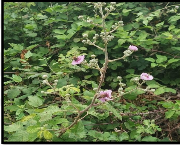
Şekil A. 47: Rubus sanctus Schreb.