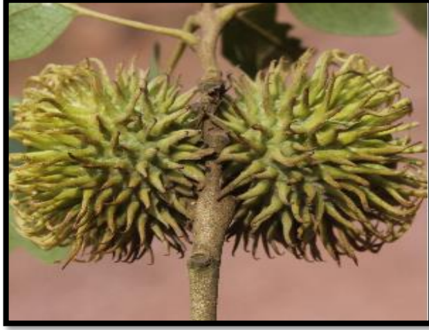
Şekil A. 25: Quercus cerris L.