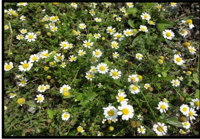
Şekil A. 6: Anthemis chia L.