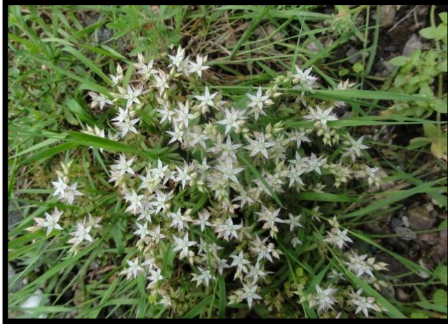
Şekil A. 18: Sedum hispanicum L.