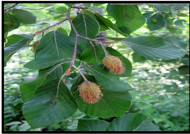
Şekil A. 24: Fagus orientalis Lipsky.