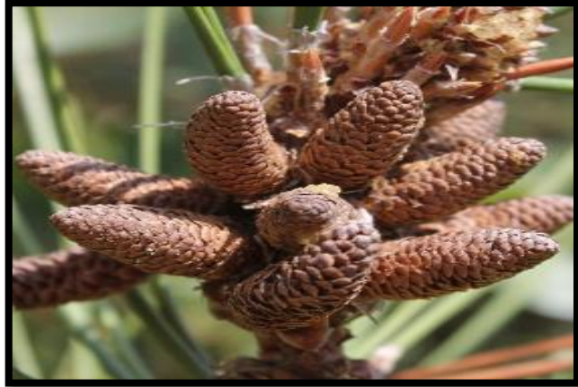
Şekil A. 39: Pinus nigra Arnold.