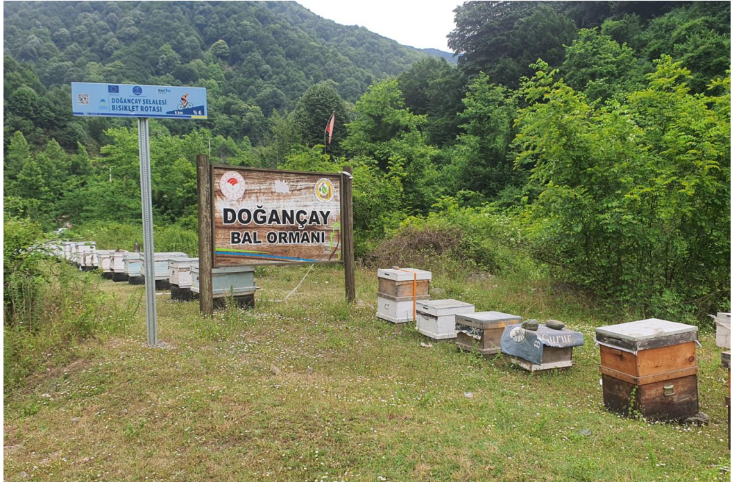
Şekil 3.1: Doğançay Bal Ormanı.

Araştırma 2024 yılı vejetasyon döneminde Sakarya İli Geyve İlçesi Doğançay-Maksudiye yöresinde Doğançay Bal Üretim Ormanında yapılmıştır (Şekil 3.1). Araştırma sahası Doğançay Mahallesi 1500 metre mesafede olup, mahallenin doğusunda yer almaktadır. Araştırma sahasının en düşük rakımı 150 m, en yüksek rakımı 790 m'dir. Doğançay mahallesinin arazi yapısı kırıklı ve çok eğimli olup, bölgede tarım ve hayvancılık faaliyetleri kısıtlı olarak yapılmaktadır. Araştırma sahası olarak belirlenen alan (% 20-110 eğim), meyil gurubunda yer almakta olup erozyon yoktur (OGM, 2015a). Toplam çalışma alanı 454,50 ha'dır. Doğançay Bal Üretim Ormanı Sakarya Orman Bölge Müdürlüğü, Geyve İşletme Müdürlüğü, Doğançay İşletme şefliğine bağlı 53, 54, 55, 56, 57, 69, 70, 71, 72, 74 ve 75 nolu bölmelerde yer almaktadır (Şekil 3.2).