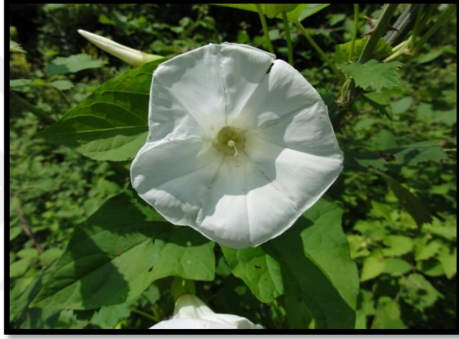
Şekil A. 17: Calystegia silvatica (Kit.) Griseb.