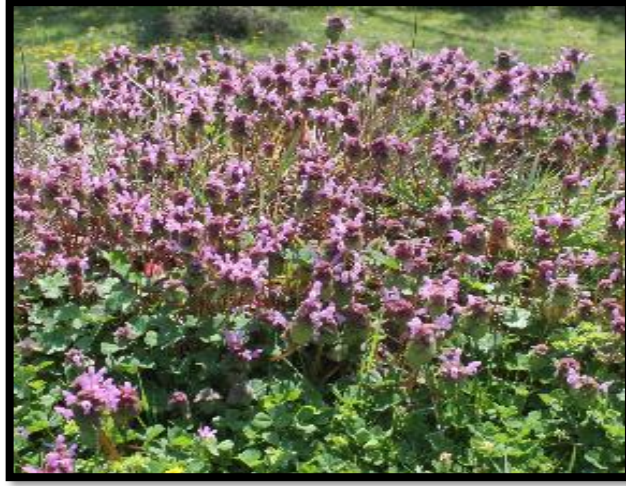
Şekil A. 31: Lamium purpureum L.