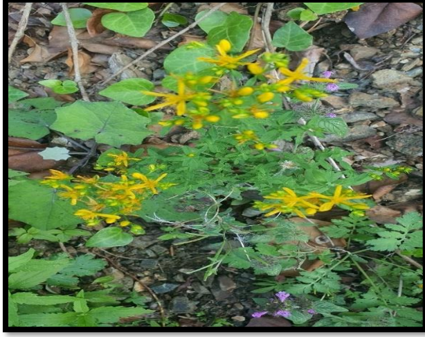
Şekil A. 28: Hypericum perforatum L.