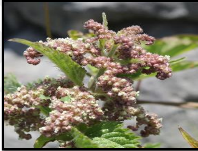
Şekil A. 50: Urtica dioica L.