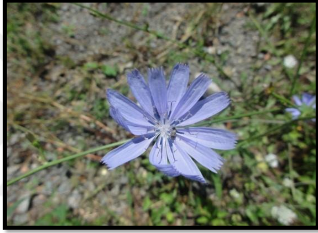
Şekil A. 8: Cichorium intybus L.