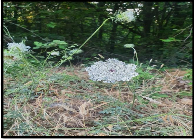
Şekil A. 2: Daucus carota L.