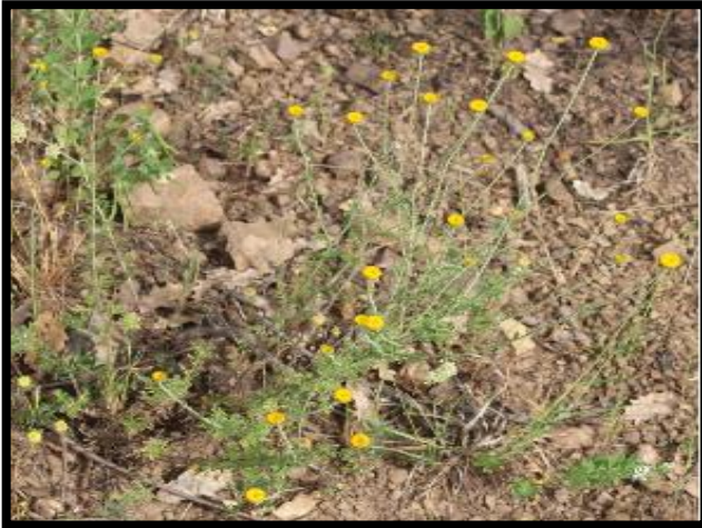
Şekil A. 9: Cota tinctoria