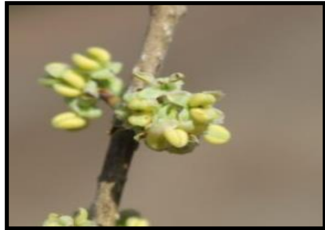
Şekil A. 36: Phillyrea latifolia L.