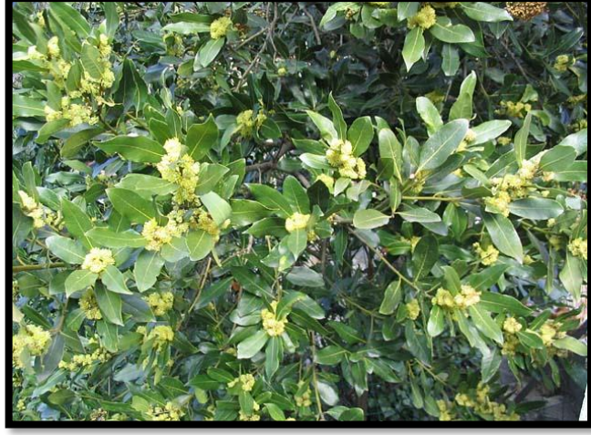
Şekil A. 34: Laurus nobilis L.