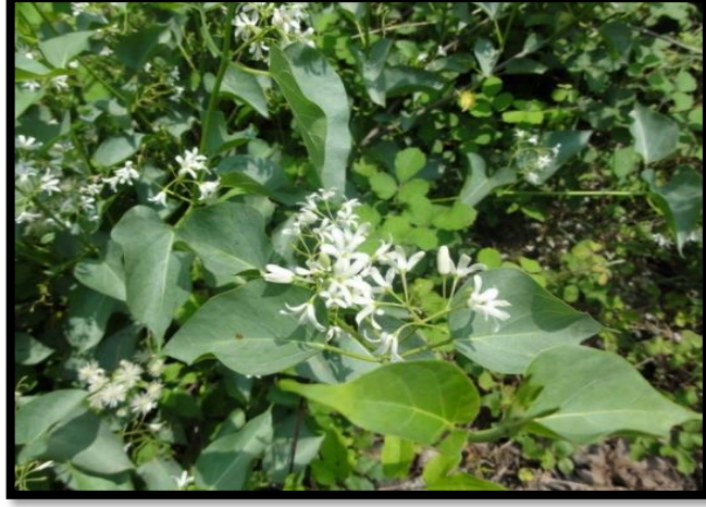
Şekil A. 4: Cionura erecta (L.) Griseb.