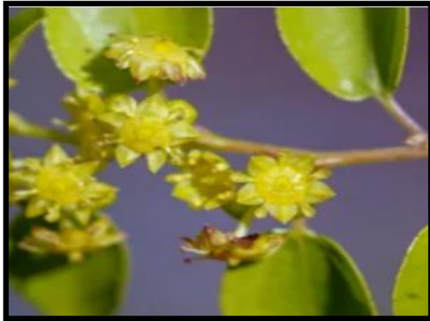
Şekil A. 42: Paliurus spina-christi P. Mill.