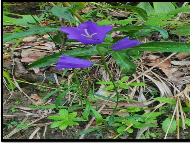
Şekil A. 14: Campanula persicifolia L.