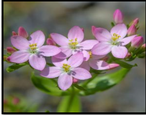
Şekil A. 26: Centaurium erythraea Rafn.