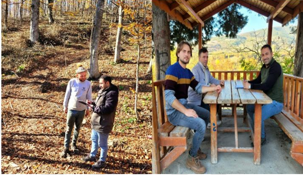
Şekil 3.5: Anket verilerinin toplanmasına ait görseller.

periyotlarda çalışma alanına gidilmiştir. Bunun yanı sıra, önemli arıcılık alanlarının tespiti için periyodik arazi çalışmaları yapılmıştır. Kaynak kişilerle görüşmeler sırasında, izinleri dahilinde kamera, video ve fotoğraf makineleri kullanılmıştır. Elde edilen tüm veriler ise düzenli olarak bilgisayar ortamına aktarılmıştır.