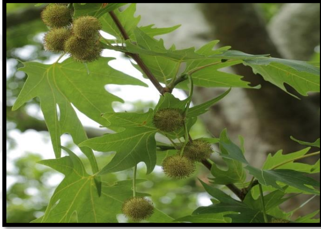
Şekil A. 38: Platanus orientalis L.