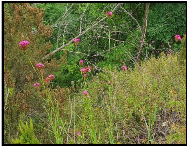
Şekil A. 15: Dianthus giganteus d'Urv.