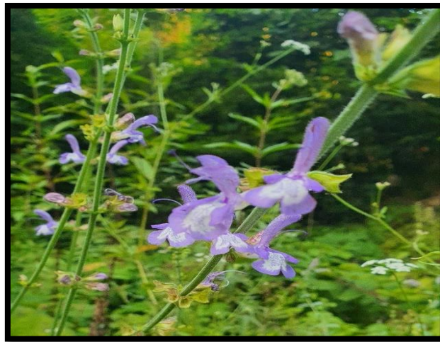
Şekil A. 33: Salvia forskaehlei L.