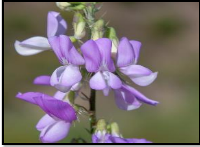
Şekil A. 19: Galega officinalis L.