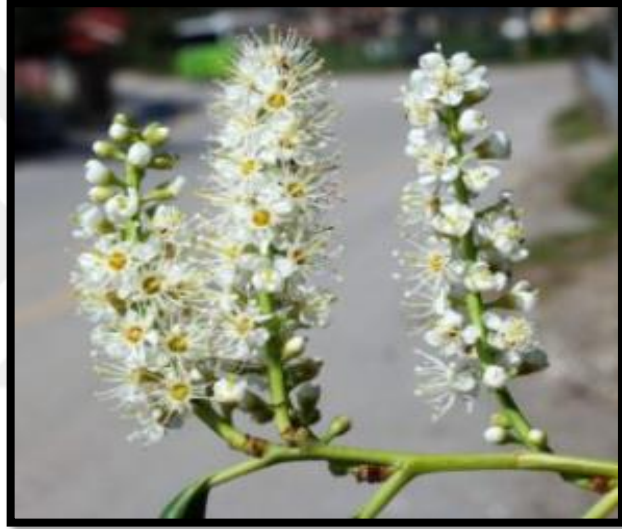
Şekil A. 44: Prunus laurocerasus L.