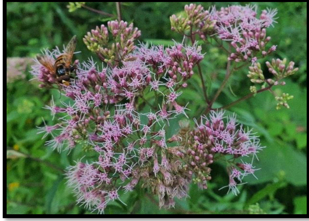
Şekil A. 10: Eupatorium cannabinum L.