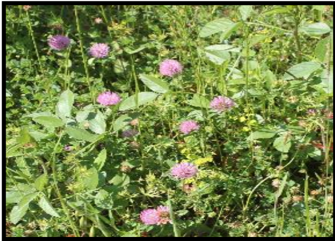
Şekil A. 21: Trifolium pratense L.