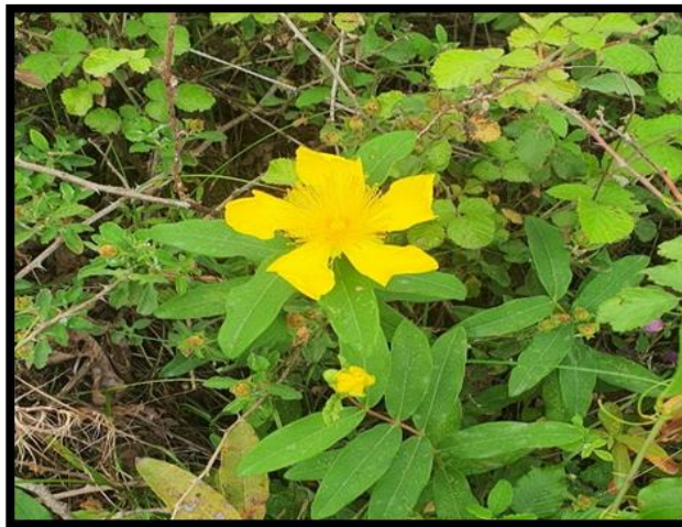
Şekil A. 27: Hypericum hircinum L.