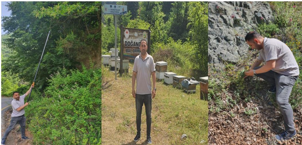
Şekil 3.3: Doğançay Bal Ormanı arazi çalışmalarından görüntüler.

Arazi çalışmalarından elde edilen bulgular doğrultusunda, arıların en çok ziyaret ettiği bitkiler alfabetik sıraya göre listelenmiş, çiçeklenme dönemleri ile birlikte tıbbi ve aromatik değerleri de belirtilmiştir. Böylece, Doğançay Bal Üretim Ormanı'nın floristik potansiyeli arıcılık yönünden bilimsel olarak ortaya konmuştur.