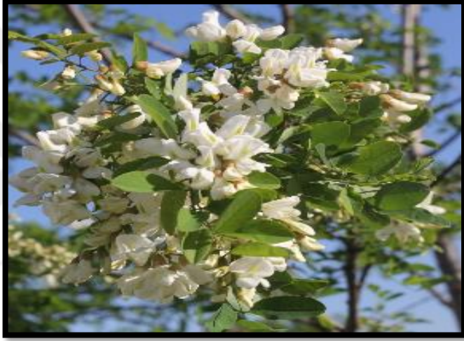
Şekil A. 20: Robinia pseudoacacia L.