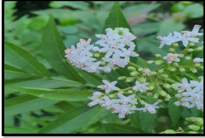
Şekil A. 1: Sambucus ebulus L.