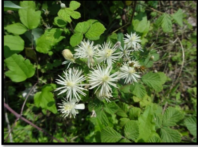
Şekil A. 40: Clematis vitalba L.