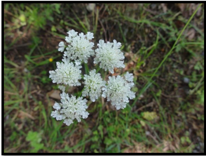
Şekil A. 3: Oenanthe pimpinelloides L.