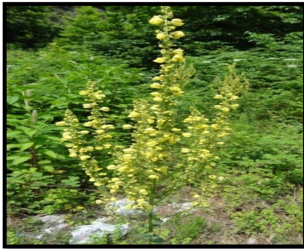
Şekil A. 48: Verbascum bithynicum Boiss