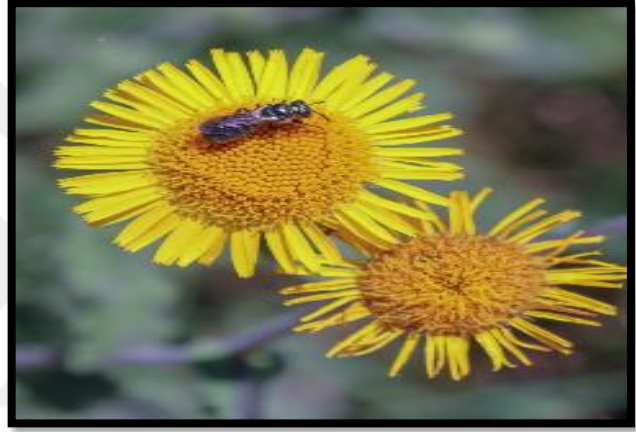
Şekil A. 11: Pulicaria dysenterica (L.) Bernh.