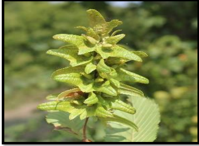
Şekil A. 13: Carpinus betulus L.