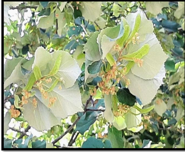
Şekil A. 49: Tilia tomentosa Moench.