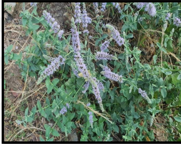
Şekil A. 32: Mentha longifolia (L.) L.