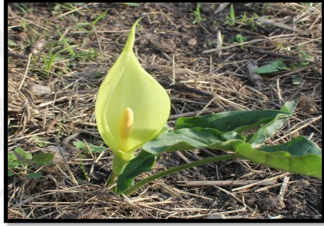
Şekil A. 5: Arum italicum Mill.