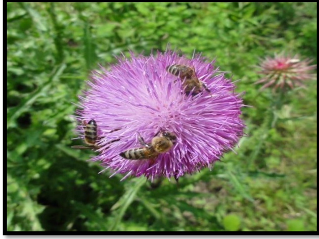
Şekil A. 7: Carduus nutans L.