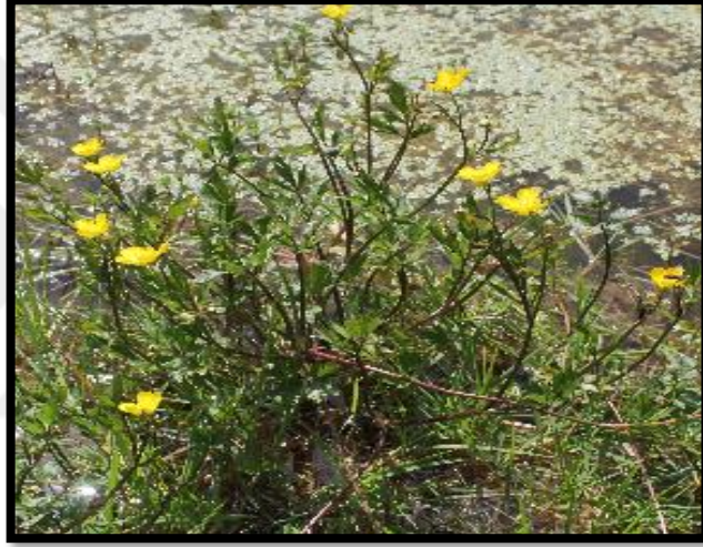
Şekil A. 41: Ranunculus repens L.