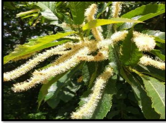
Şekil A. 23: Castanea sativa Mill.