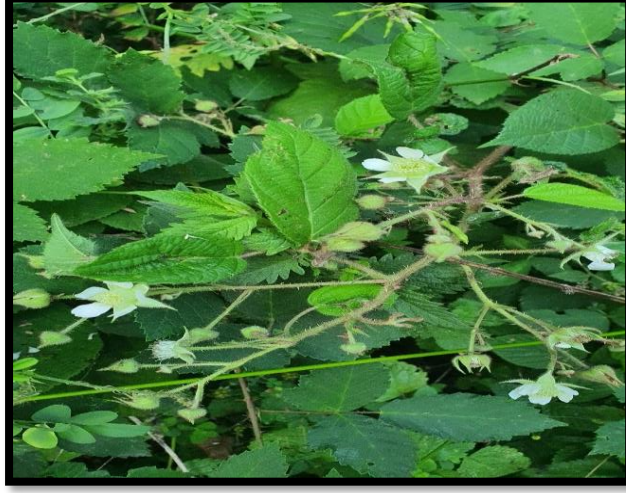
Şekil A. 46: Rubus hirtus Waldst. & Kit.