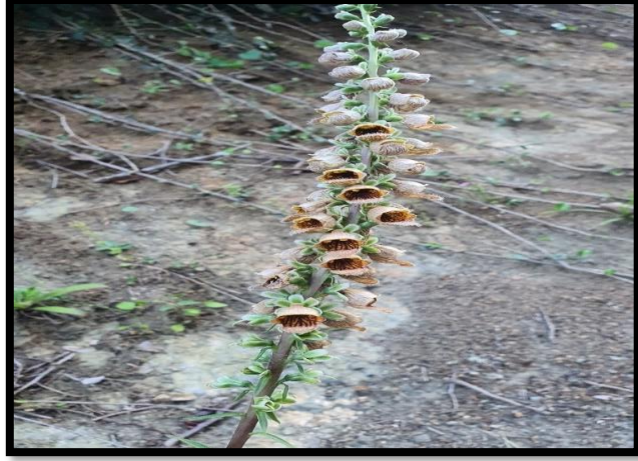
Şekil A. 37: Digitalis ferruginea L.