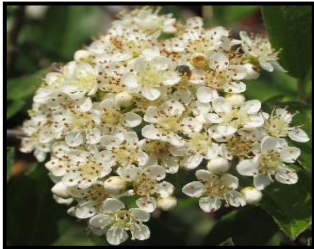
Şekil A. 45: Pyracantha coccinea M.Roem.