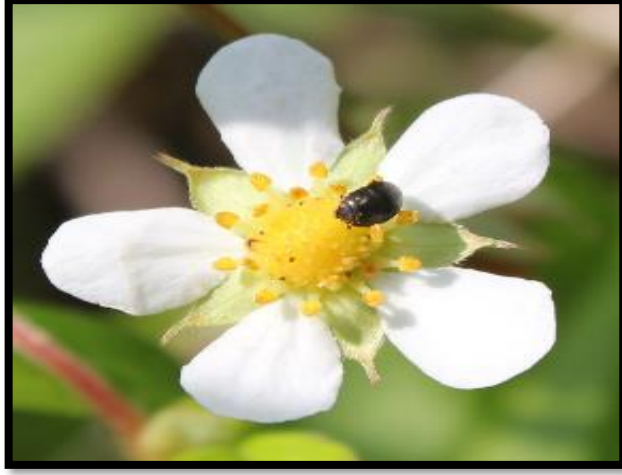
Şekil A. 43: Fragaria vesca L.