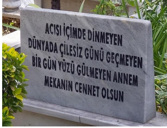
Şekil 24. Çileli Olduğu Belirtilen Kadın Mezar Taşı

Dikkat çeken diğer yazı da kadının anneliği üzerinden kendisinin özelliği olmadan yazılan yazıydı. Evlatlarının varlığı ile mecazi anlamda hala yaşadığı ifade edilen kadın yine doğurduğu evlatlarının varlığıyla temsil edilmekteydi.