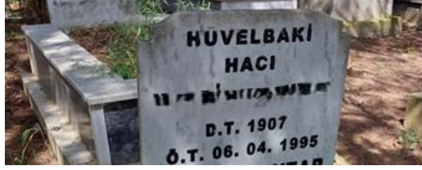
Şekil 17. Hacılık İle Temsil Edilen Erkek Mezar Taşı