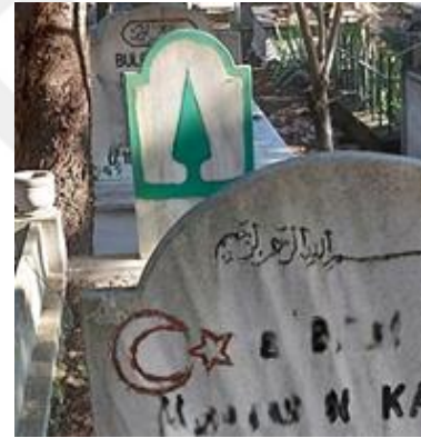
Şekil 40. Ayakucunda Servi Motifi Bulunan Erkek Mezar Taşı 2