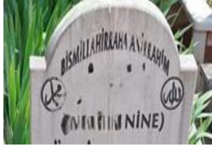
Şekil 35. Nine İfadesiyle Temsil Edilen Kadın Mezar Taşı 1