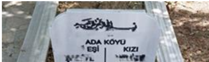
Şekil 4. Eşi ve Kızı İfadesiyle Temsil Edilen Kadın Mezar Taşı