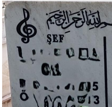
Şekil 41. Sol Anahtarı Motifi Olan Erkek Mezar Taşı