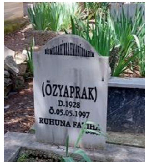
Şekil 7. Bekarlık Soyadı Belirtilen Kadın Mezar Taşı 2