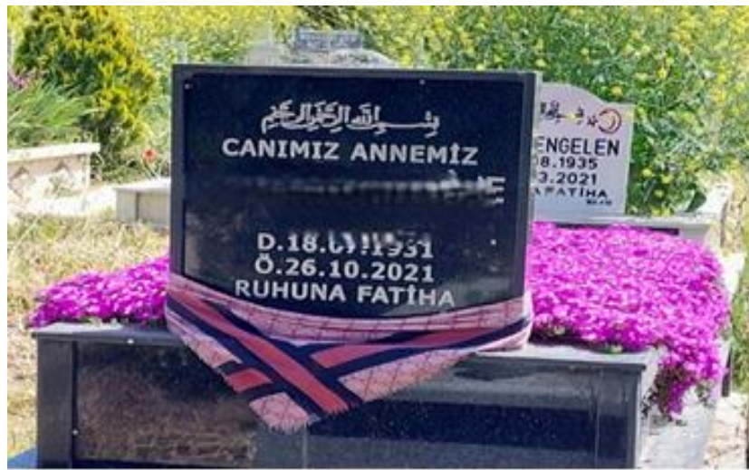
Şekil 8. Kadın Mezar Taşına Bağlanan Yemeni

Mezarlıklardaki mezar taşı olmayan yeni gömülmelerin olduğu mezarlıklar da dikkat çekicidir. Çünkü ölen kişinin baş ucundaki tahtaya bağladıkları havlu ve yemeni nesnelere oraya gömülen kişinin cinsiyetini temsil etmektedir. Sahada görülen kadınların baş ucuna yemeni, erkeklerin de havlu bağlandığı bilgisi mevcuttur. Daha sonrasında mezarlık sorumlusu ile yapılan görüşmelerde de kadınlara yemeni erkeklere de havlu bağlandığını bilgisine ulaşılmıştır ve bilginin ikinci ağızdan doğruluğu da belirlenmiştir. Yeni gömülme olmayıp üst üste defnedilmenin olduğu mezar yerlerinde de bu durum mevcuttur.