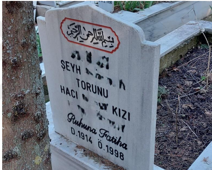
Şekil 2. 2 Kuşak Akrabalık Bağıyla Temsil Edilen Kadın Mezar Taşı

Şekil 2'deki mezar taşında bir kadının 2 kuşak akrabalık ilişkisi ile tanımlandığı görülmektedir. Ataerki sistemin temsilini gösteren bu mezar taşlarına ata ve ataerki terimlerinin karşılığına bakarak açıklama getirilebilir. Öncelikle TDK "ata" terimini "Büyükbabadan başlayarak geriye doğru atalardan her biri; baba, dede" şeklinde tanımlamaktadır (http-1). Ataerkiyi ise "Soyda, temel olarak babayı temel alan ve ailede çocukları baba soyuna mal eden topluluk" olarak tanımlamaktadır (http-2; Yaman, 2012). Bu tanımlara bakıldığında kadınların ata soyu ile tanımlanmaları demek aile büyüğü erkeklerle temsil edilmesi demektir. Baba soyu ile temsil edilen kadınların varlığı kendinden önce 2 soy akrabalık bağına bağlı olmuştur. Bu akrabalık ilişkisi