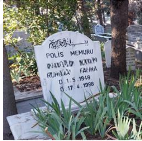
Şekil 15. Polis Temsili Bulunan Erkek Mezar Taşı