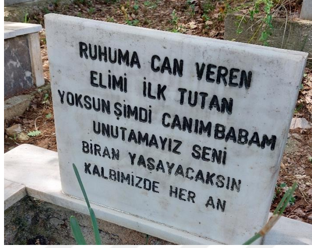
Şekil 28. Can Verme İfadesiyle Tanımlanan Erkek Mezar Taşı

“Ruhuma can veren elimi ilk tutan yoksun şimdi canım babam unutamayız seni bir an yaşayacaksın kalbimizde her an ...”