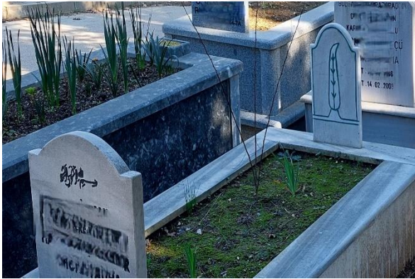
Şekil 39. Ayakucunda Servi Motifi Bulunan Erkek Mezar Taşı 1

Bu çalışmanın bulgularında ise günümüz mezar taşlarında kadın için de erkek için de çiçek motifinin kullandığı görülmüştür. Fakat bu noktada dikkat edilmesi gereken bir husus vardır. Görülen 28 adet çiçek (gül, lale, papatya) motifinden 22'si kadın mezar taşlarına, 6'sı ise erkek mezar taşlarına aittir. Erkek mezar taşlarında kadın mezar taşlarından daha fazla görülen motif ise servi ağacını temsil eden çizimdir (Şekil 39, Şekil 40). Toplumda kadınlara yüklenen nahiflik, çiçek gibi olma söylemlerinin sebebiyle kadın mezarlıklarında çiçek motiflerinin daha sık işlenmesi düalist bakış açısının oluşturduğu kültür-doğa, zayıf-güçlü gibi karşıtlıkların mekânsal izlerini görmeyi sağlamıştır. Peki servi motifinin erkeklerde daha sık işlenmesinin sebebi zayıf-güçlü, gibi karşıtlıkların oluşturduğu erkekliğin inşası olabilir mi? Olabilir, çünkü ağaçlar Türklerde yerin dibine uzanan kökleri, göğe doğru uzayan gövdesi dalları ve budaklarıyla her seferinde de gelişen yapısıyla hayatı ve ebediyeti temsil etmektedir (Çıblak, 2002).