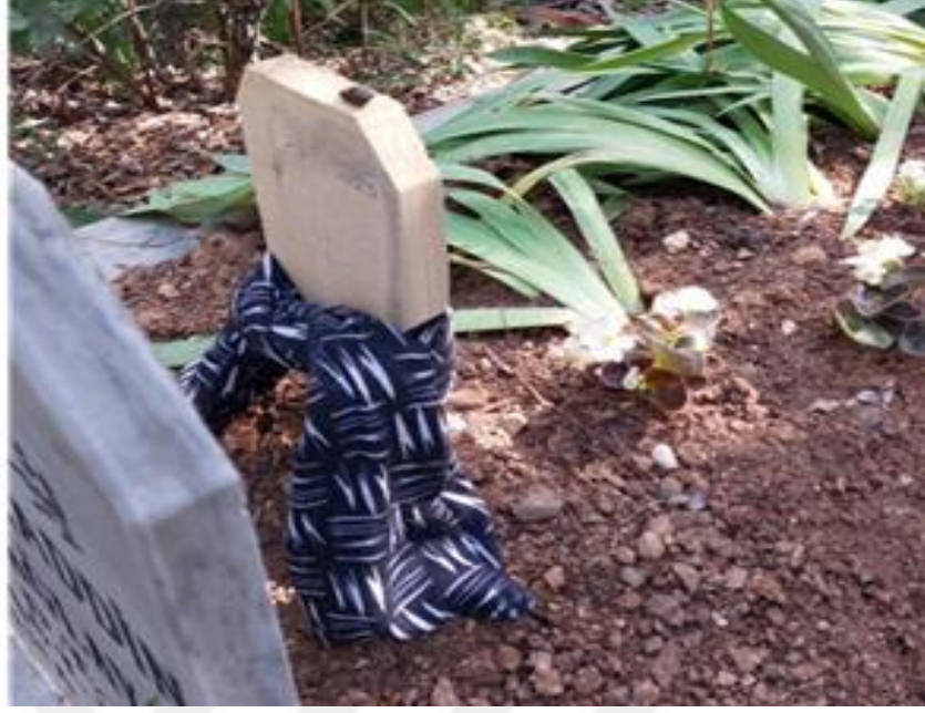
Şekil 9. Yeni Gömülmenin Kadın Olduğunu Temsil Eden Yemeni