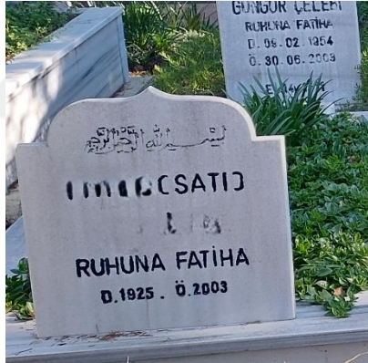
Şekil 33. İkinci Adı Belirtilen Kadın Mezar Taşı 1