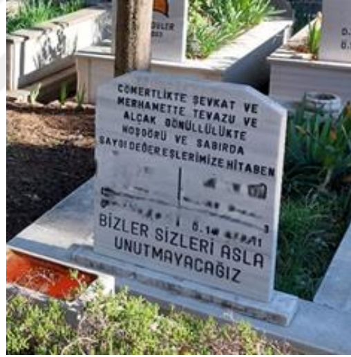
Şekil 23. Şefkat İle Temsil Edilen Kadınların Mezar Taşı

Kadın mezar taşlarında dikkat çeken yazılardan diğeri de kadınların çile çekmiş, hayattan keyif alamamış şekilde tanımlanmasıydı: