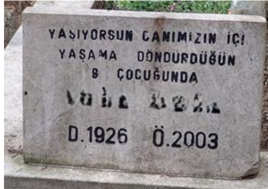
Şekil 25. Anelik Vurgusu Yapılan Kadın Mezar Taşı

“YAŞIYORSUN CANIMIZIN İÇİ YAŞAMA DÖNDÜRDÜĞÜN 9 ÇOCUĞUNDA”