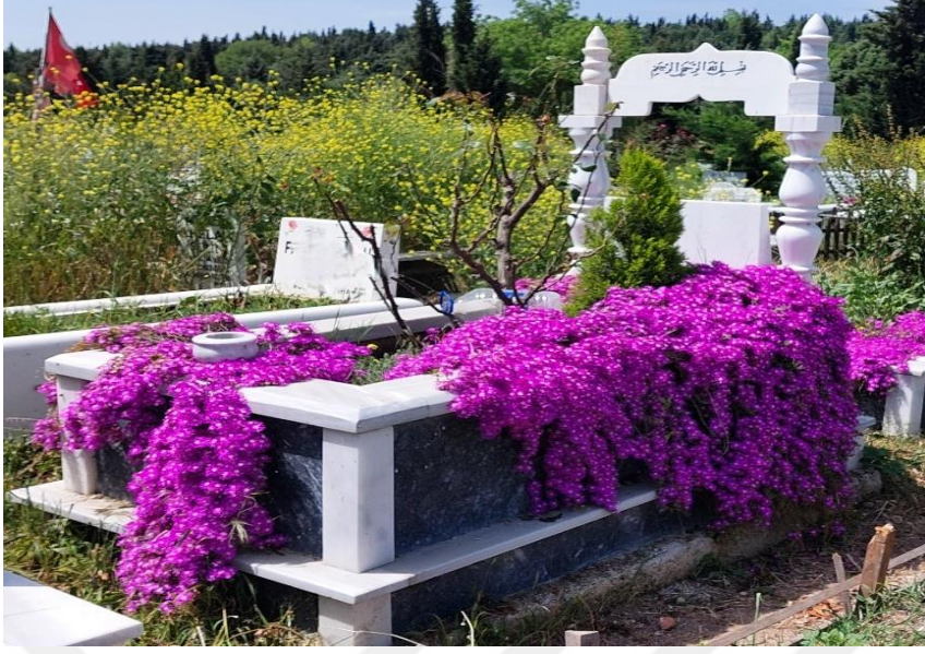
Şekil 46. Yeni Dönem Mezar Taşları 2