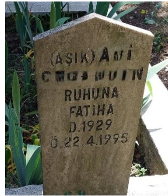
Şekil 38. Lakabıyla Temsil Edilen Erkek Mezar Taşı