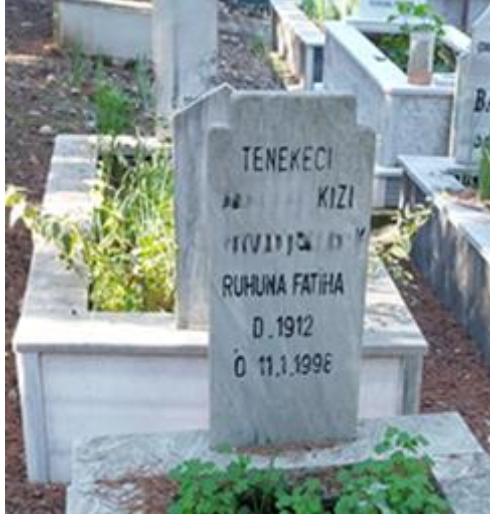
Şekil 12. Babasının Mesleği İle Temsil Edilen Kadın Mezar Taşı