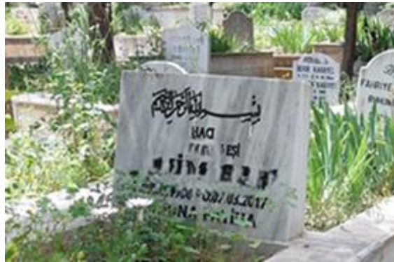
Şekil 16. Hacılık İle Temsil Edilen Kadın Mezar Taşı

Laqueur (1997)’un İstanbul’daki Osmanlı Mezarlıklarını incelediği çalışmasında hacı olma statüsünün kadın mezar taşlarında erkek mezar taşlarına kıyasla daha az belirtildiğinden bahsetmiştir. O günlerden günümüze gelindiğinde ise bu sayıların birbirine neredeyse eşit şekilde ifade edildiği görülmüştür (Laqueur, 1997). Bu durum gittikçe iyileşen ekonomik koşullar ya da İslami değerlerin günümüze yaklaştıkça daha çok önemsenebilmeye başlamasıyla açıklanabilir (Laqueur, 1997).