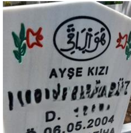
Şekil 21. Anne Soyuyla Temsil Edilen Kadın Mezar Taşı