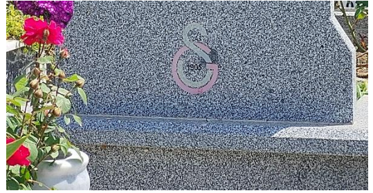
Şekil 31. Galatasaray Logosu Bulunan Erkek Mezar Taşı