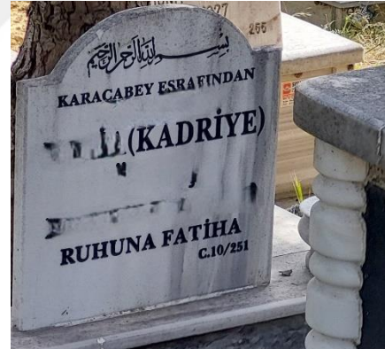
Şekil 34. İkinci Adı Belirtilen Kadın Mezar Taşı 2

Kadınlarda lakap olarak rastlanılan ise 2 mezar taşı vardır. Kadınlar günümüzde daha bebeklikten yaşlılığa kadar geçen sürede birçok sıfat alır. Kız kardeş olurlar, anne olurlar, bazen yenge bazen de nine olarak karşımıza çıkarlar (Özmenli, 2018). Evlilik kurumu kadın erkek dinamiklerine yön vererek kadının akrabalık bağlarıyla temsil edilmesine yol açar. Mezar taşında “nine” adıyla tanımlanan kadınlar bu şekilde açıklanabilir.