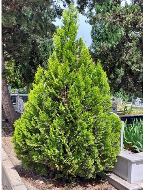
Şekil 42. Servi Ağacı

bulunduđu mekân bitkinin adını almasına etki etmiştir. Kabir bitkisinin ekildiđi mezarlarda kadın ya da erkek mezarlarında daha az ya da fazla olmaya dair bulgu görülmemiştir.