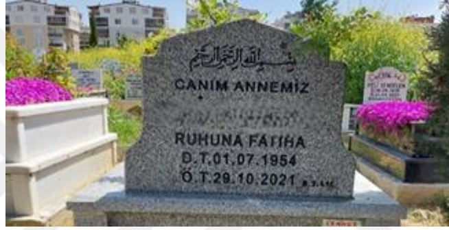
Şekil 18. Canım Annemiz İfadesi Bulunan Kadın Mezar Taşı

genelinde önemli sayılıp anneliğin kutsanması mezar taşlarına kadınların “birinin annesi” olma temsilini yansıtmıştır. Kadının evde olması çocuk bakımını, temizliği, yemek yapmayı üstlenmesi erkeğin ise evin dışında çalışıp kazandığı parayla aile geçindirme rolü doğal sayılsa da bu normal değildir (Schick, 2016). Doğallaştırılan bu toplumsal cinsiyet rolleri kadın ve erkeğe kültürel normlar tarafından yüklenmiştir ve gündelik yaşam pratikleriyle -mezar taşlarında olduğu gibi- yeniden üretilmektedir. Ayrıca sevgili ve canım gibi ifadeler kullanılan mezar taşlarının daha çok kadınlarda olması kadınların toplumsal anlamda duygu ve sevgi ifadeleriyle özdeşleştirilmesinin karşılığıdır.