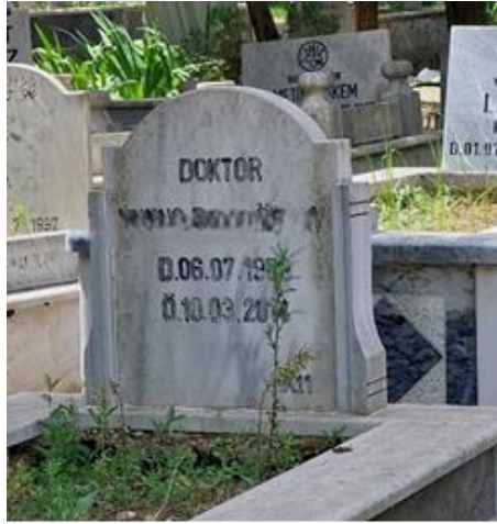
Şekil 14. Doktor Temsili Bulunan Erkek Mezar Taşı