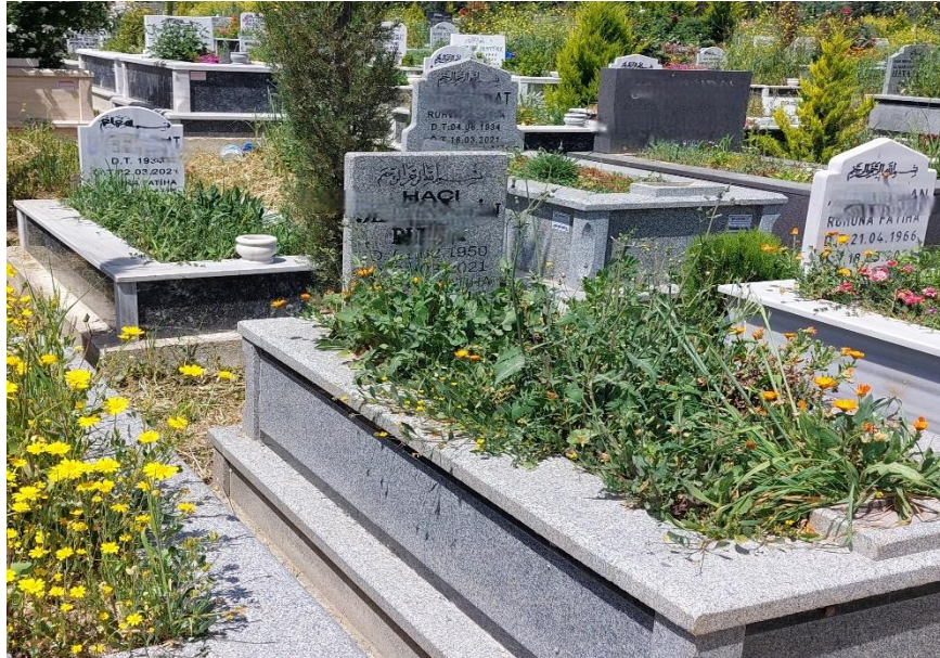
Şekil 45. Yeni Dönem Mezar Taşları 1