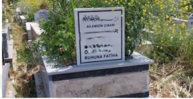
Şekil 26. Çınar İfadesiyle Temsil Edilen Erkek Mezar Taşı

Hakikati temsil ettiğini söylediğim erkek algısı da “ Sen azminle neşenle sevginle bir dünya kurdun o dünya hiç yok olmayacak E S ” yazısıyla kendini göstermiştir.