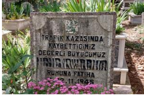
Şekil 29. Değerli İfadesi Bulunan Erkek Mezar Taşı

Başka bir erkek mezar taşında da “değerli” büyüğümüz ifadesinin kullanıldığı yüceltme ifadesi anlamı bulunmaktadır.