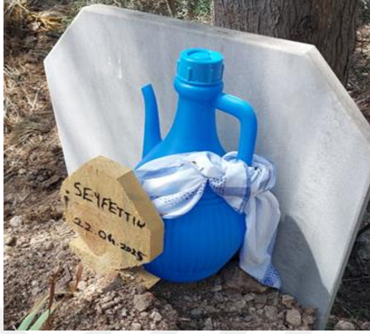
Şekil 11. Yeni Gömülmenin Erkek Olduğunu Temsil Eden Mendil