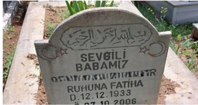
Şekil 19. Sevgili Babamız İfadesi Bulunan Erkek Mezar Taşı