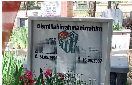
Şekil 32. Bursaspor Logosu Bulunan Erkek Mezar Taşı