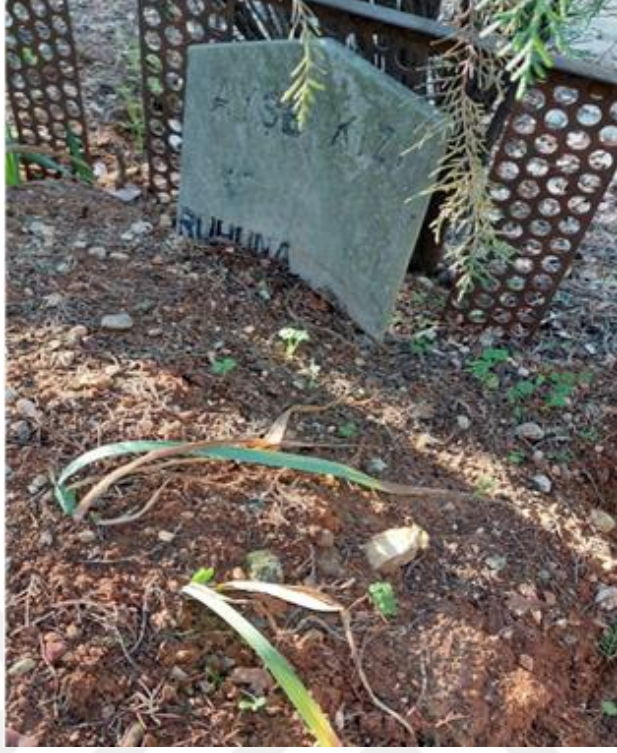
Şekil 22. Bakımsız Görünen Kadın Mezar Taşı