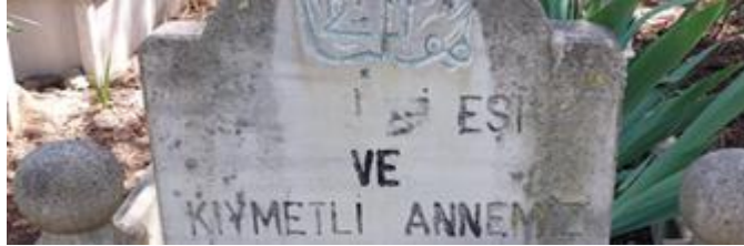
Şekil 3. Eş ve Annelikle Temsil Edilen Kadın Mezar Taşı