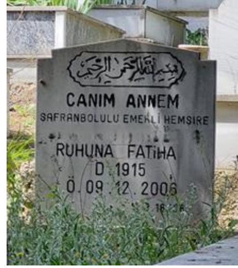
Şekil 13. Hemşire Temsili Bulunan Kadın Mezar Taşı