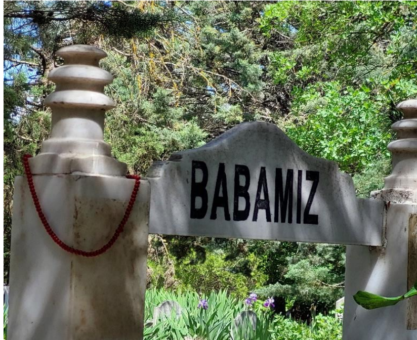
Şekil 10. Erkek Mezarına Bırakılan Tespih