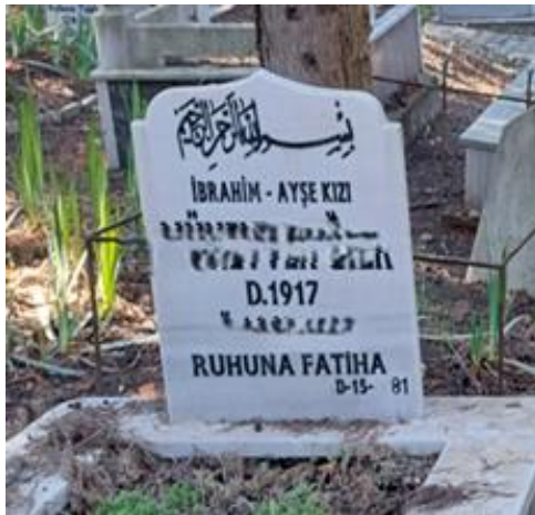
Şekil 20. Anne ve Baba Soyunun Aynı Yerde Temsili Bulunan Mezar Taşı

Örneklerin 1'i (12) hariç diğerleri kadın mezar taşlarına aittir. Anne soyunun kullanımının özellikle kadınlarda olması dikkat çekicidir.