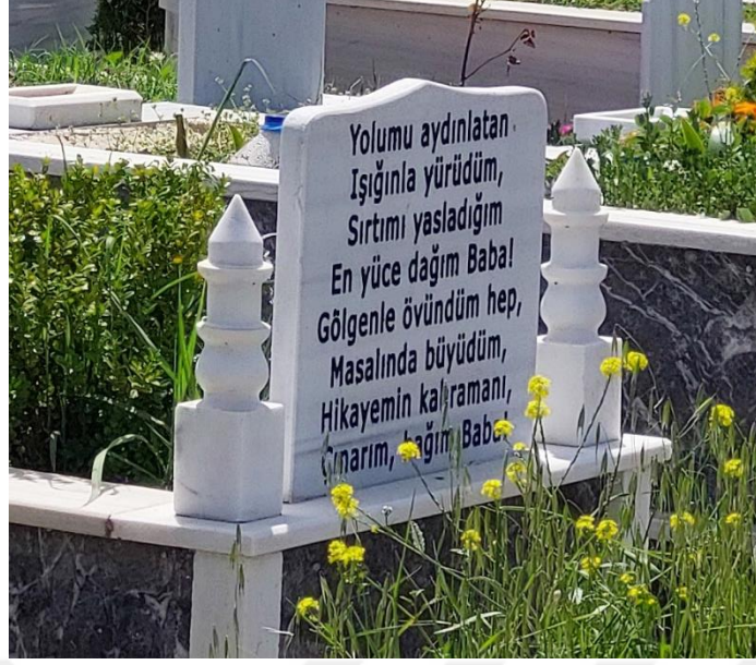
Şekil 27. Kahraman İfadesiyle Temsil Edilen Erkek Mezar Taşı

Erkeklerde de iyi olma ve fedakârlığın görüldüğü mezar taşları vardır. Burada da babalığın ne kadar iyi olduğundan bahsedilmiştir. Hatta baba olmanın yanı sıra dede tanımlaması da vardır: