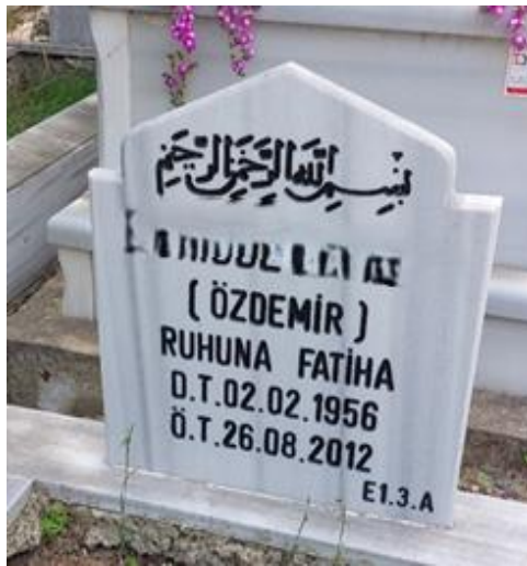
Şekil 6. Bekarlık Soyadı Belirtilen Kadın Mezar Taşı 1

Kadınlar mezar taşlarında sadece isimleriyle var olamamaktadır. Ya birinin kızı ya birinin eşi ya da birinin annesi sıfatıyla var olmaktadır. Kadının adı var ama adına gelene kadar adının önünde bir sürü sıfat var. 9 adadan alınan 743 örneklem arasından sadece 5 mezar taşında kadınların bekarken kullandığı soyadıyla yer aldığı görülmüştür. Bunun yanında bekarlık soyadı da baba soyu temsil etmekle birlikte bu mezar taşlarında kadınların kocalarından aldıkları soyadı ile birlikte bekarlık soyadlarının da parantez içinde belirtildiği görülmüştür. Bunlar: K S S1 (Hacıoğlu), K S S1 (Küçükgür), K S S1 (Özyaprak), K S S1 (Özdemir), K S S1 (Başkurt).