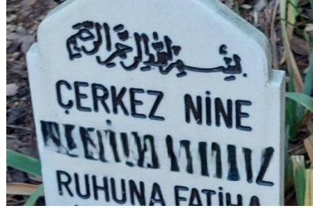
Şekil 36. Nine İfadesiyle Temsil Edilen Kadın Mezar Taşı 2

Erkeklerde lakap görülen mezar taşları ise 5 adettir. 4'ünün erkek mezar taşı olmasının yanında birisi kadının defnedildiği mezar taşına aittir ve baba soyu belirtilen mezar taşında babanın lakabı kullanılmıştır. Kadınlarınkinden farklı olarak üstte belirtildiği gibi erkek mezar taşlarında isimlerinin yanında lakap ifadelerinin bulunmasına karşın kadınlarda ikinci isim olması dikkat çekmiştir.