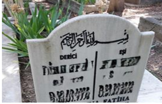
Şekil 5. Eşi İfadesiyle Temsil Edilen Kadın ve Kocası (Derici)