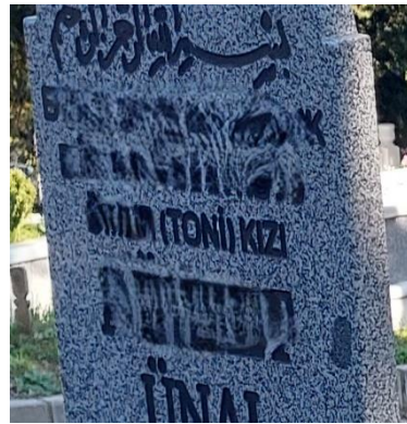
Şekil 37. Babasının Lakabı ile Tanımlanan Kadın Mezar Taşı