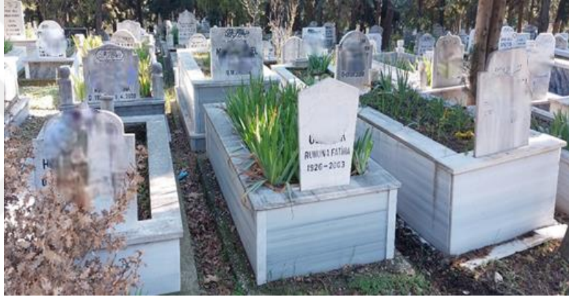
Şekil 44. Eski Dönem Mezar Taşları

Eski tarihli mezar taşlarına bakıldığında sade mermerden yapıldığı görülmüştür. Mezarlığın yakınlarında mezarıcılar (mezar taşlarını yapan kişiler) ile yapılan görüşmelerde, mezarıcılar eskiden granitin pahalı olduğunu şimdi daha ulaşılabilir olduğunu ve bu yüzden sıkça tercih edildiğini söylemiştir. Renk olarak eski tarihli mezarlıklarda siyah, kahverengi gibi granit mezar taşlarına az rastlanırken yani yapılmış mezar taşlarının çoğu gösterişli, baş ucundaki mezar taşı oldukça büyük ve süslüdür. Sınıfsallık başlığında kadın ve erkek mezar taşlarına dair toplumsal cinsiyet bulgusu görülmemiştir.