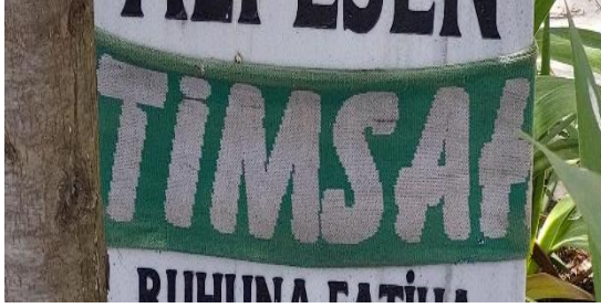
Şekil 30. Bursaspor Atkısı Bulunan Erkek Mezar Taşı

Erkek hegemonyasının, eril dilin hakim olduğu futbol ile ilgili bilgiler de mezar taşlarında yer almaktadır. Spor alanları eskiden günümüze kadar erkeklerin erilliklerini kanıtladıkları ve erkeksi güce vurgunun yapıldığı aynı zamanda kadını öğelerin de aşağılandığı alanların başında yer almaktadır. Modern toplumlarda spor erkeksi, şiddet öğeleri barındıran ve erkek egemen söylemin pekiştirildiği bir alan olarak karşımıza çıkmaktadır (Arık, 2003). En başından beri erkek sporu olarak temsil edilen futbolda erkek tahakkümünü sıkça görmekteyiz. Taraftarlarının, hakemlere, futbolculara şiddet içerikli söylemleri ve bu söylemlerin kadın bedeni üzerinden olması homofobik temsiller yaratmaktadır (Sever, 2020). Genellikle cinsellik üzerinden argo ifadelerin ve küfürlerin kullanıldığı futbol tezahüratları eril bir söylem yaratmaktadır. Futbol ve cinsellik arasında kurulan ilişki de eril tahakkümün sonucudur ve kültürel temsillerin yansımasıdır (Sever, 2020). Bu anlamda takım tutma ve futbolun kendisi de eril bir temsildir. Mezar taşlarında futbol takımlarına ait temsillerin yalnızca erkeklerde görülmesi anlamlıdır.