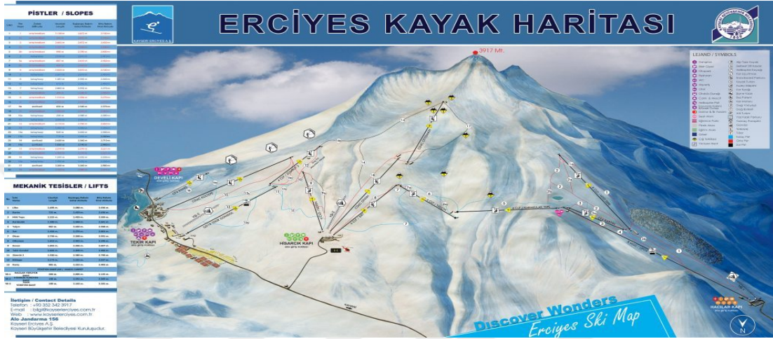
Şekil 1. 2. Erciyes Kayak Haritası

Kayak merkezi haritası, merkezi tanıtan, merkezle ilgili açıklayıcı bilgilerin (mekanik tesisler ve bağlantı noktaları, pistlerle ilgili detaylı bilgilerin (zorluk dereceleri, eğim mesafe bilgileri vs.)) bulunduğu, kayakçıların bu alanları güvenli ve keyifli bir şekilde kullanımı açısından her kayakçının anlayacağı düzeyde hazırlanmalıdır (Mızrak, 2011).