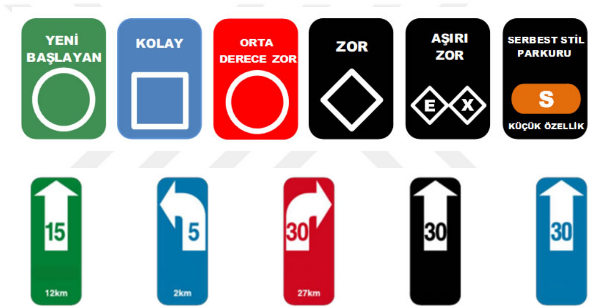
Şekil 1. 3. Kayak pistlerinin sınıflandırılması ve zorluk derecelerini belirleyen renk/işaretleri.