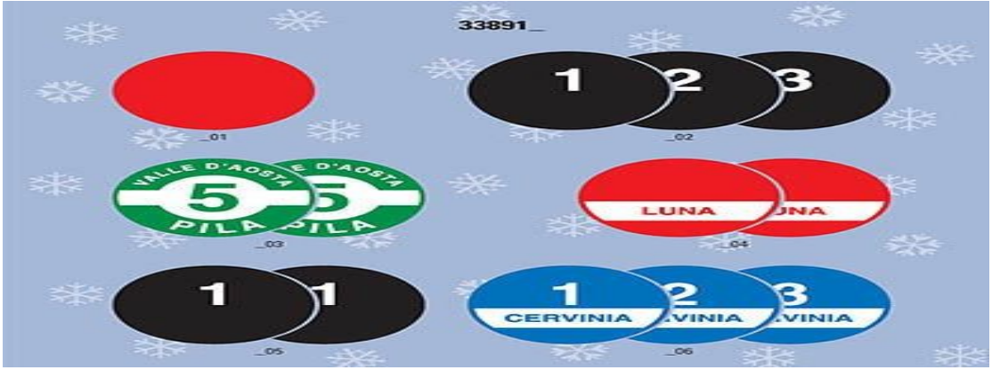
Şekil 1. 1. Zorluk Derecesine Gösteren Pist Levhaları