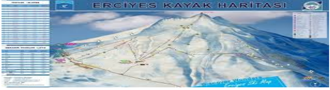
Şekil 1. 4. Erciyes Kayak Haritası

Kaynak: https://www.erciyeskayakmerkezi.com/kayakharitasi-ski-map