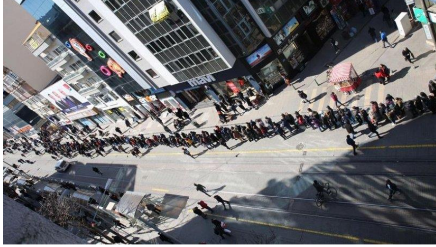
Görsel 3. Eskişehir’deki Senfoni Orkestrası Kuyruğu ( http-8 )

Eskişehir’de yaşayan insanların sanatsal etkinliklere verdikleri önem, görüşmeciler tarafından da gözlemlenmiştir: