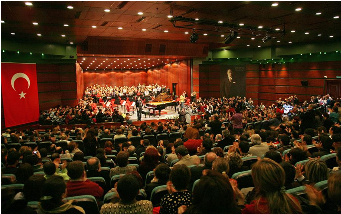
Görsel 2. Büyükşehir Belediyesi Sanat ve Kültür Sarayı Konser Salonu ( http-7 )