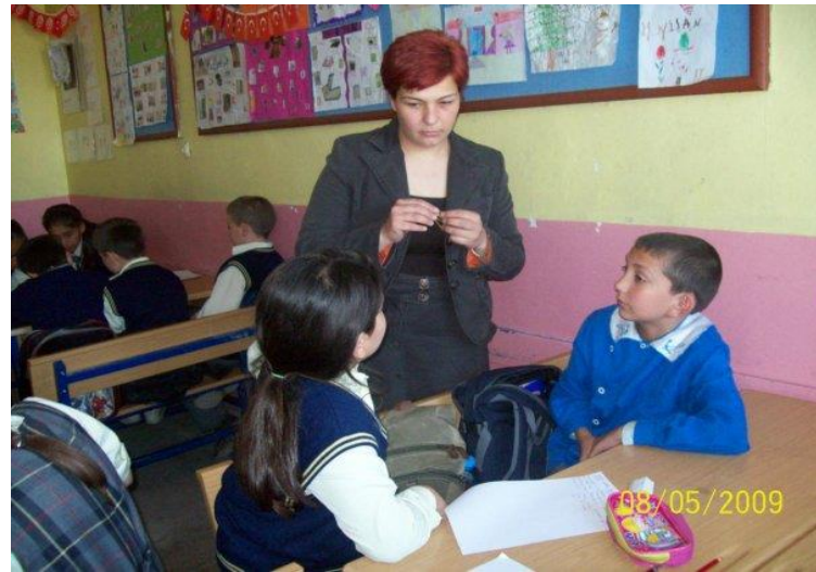
Fotoğraf 3. Mavi Önlük ve Okula Özgü Üniforması

Sonrasında ise iklim farklılıkları nedeniyle, ilköğretim okullarında okul üniformaları belirli kuralları takip etmek koşulu ile serbest bırakılmıştır (Bahadır Ünal ve diğerleri, 2011: 245). Okul üniformalarının kurallara bağlı serbest bırakılması ile geçiş sürecinde hem mavi önlük hem de okula özgü belirlenen üniformalar giilmeye devam etmiştir. Birçok okulda velilerin kararı ile üniformalar belirlenerek giilmeye başlamıştır.