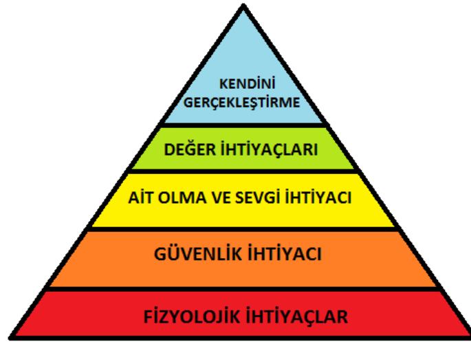
Şekil 1: Maslow Piramidi(Süral Özer, 2008).

Maslow'a göre insanların davranışlarının temeli kabul ettiği ihtiyaçları, fizyolojik, güvenlik, sevgi-ait olma, saygınlık-değer ve kendini gerçekleştirme ihtiyacı olarak, ardışık bir düzen içinde beş kategoride incelemiştir. İlk iki sıradaki gereksinimleri temel (birincil) gereksinimler, son üç sıradaki gereksinimleri ise sosyo-psikolojik veya ikincil gereksinimler olarak ele almıştır (Süral Özer, 2008).