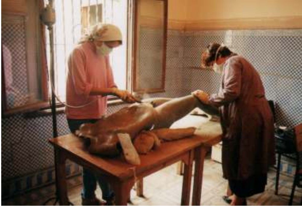
Resim 24: Mekanik Temizleme İşleminin Uygulanışı