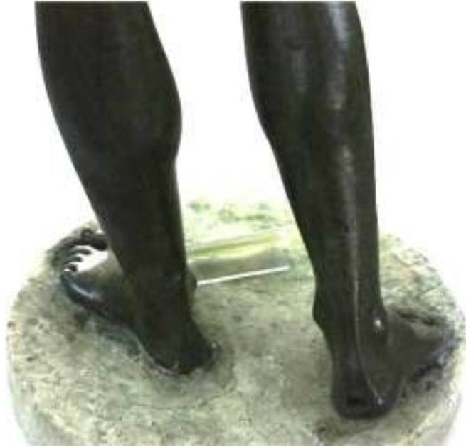
Resim 39: Ayakların Arkadan Görüntüsü