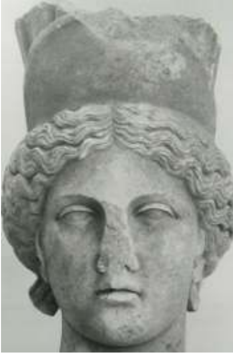
Resim 56: Tykhe Başı (İnan, 2000, s. 51, Res. 51)