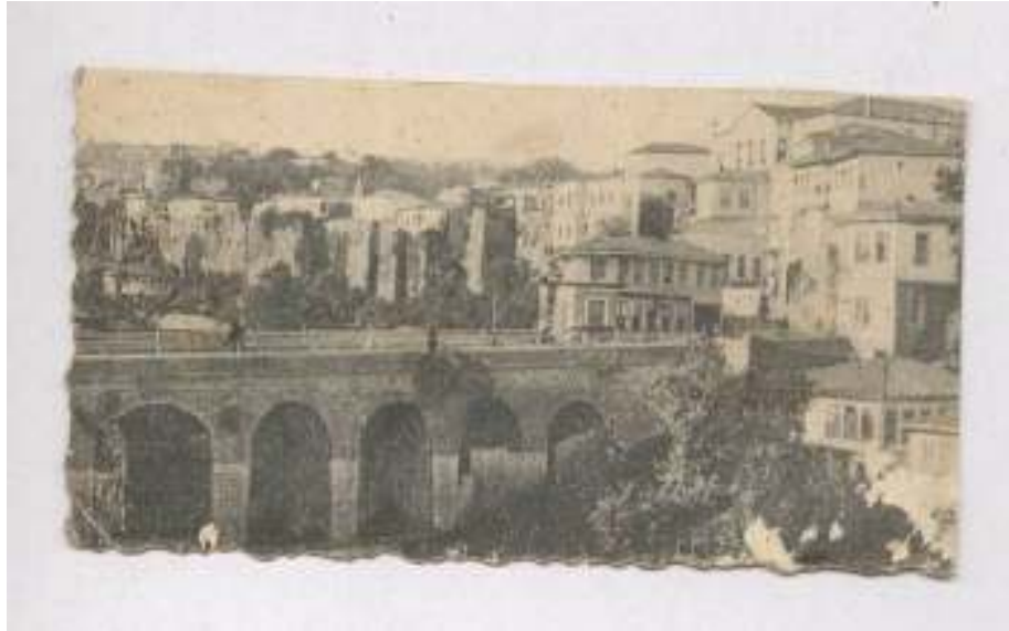
Resim 4: Tabakhane Köprüsü ( http://urun.gittigidiyor.com/koleksiyon/trabzon/tabakhane/köprüsü ), (Şubat 2013)