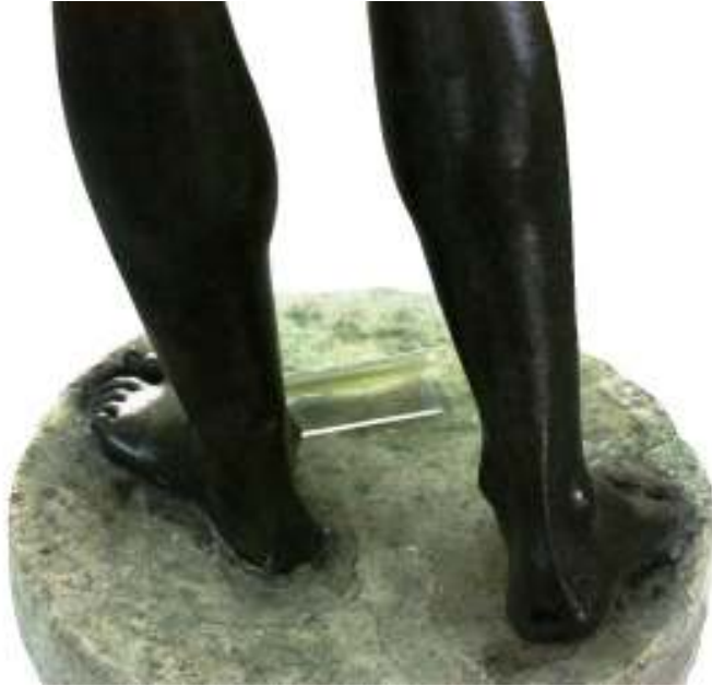
Resim 33: Heykelin Ayakları