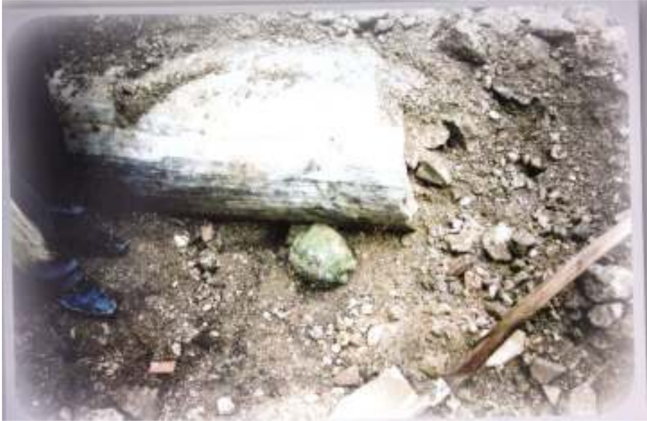
Resim 8: Kazı Alanından Görüntü (Trabzon Müze Envanter Kayıtları)