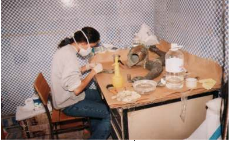
Resim 25: Mekanik Temizleme İşleminin Uygulanışı