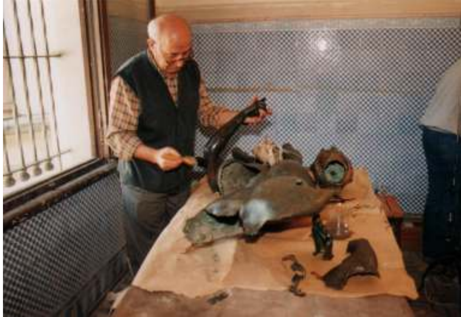
Resim 28: Heykelin Koruyucu Sıvı İle Kaplanması İşlemi (Trabzon Müze Envanter Kayıtları)