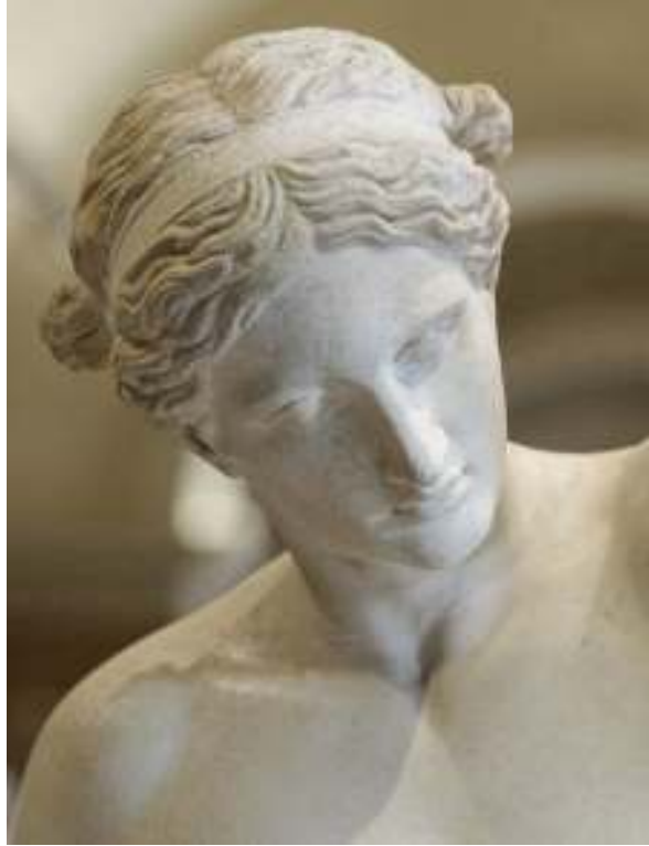
Resim 58: Apollon Sauroktonos (Boysal, 1067, s. 77, Res. 87)