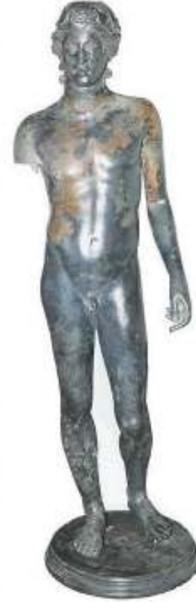
Resim 45: Dionysos Heykeli (Yitik Miras'ın Dönüş Öyküsü, 2003, s. 91, Res. 56)