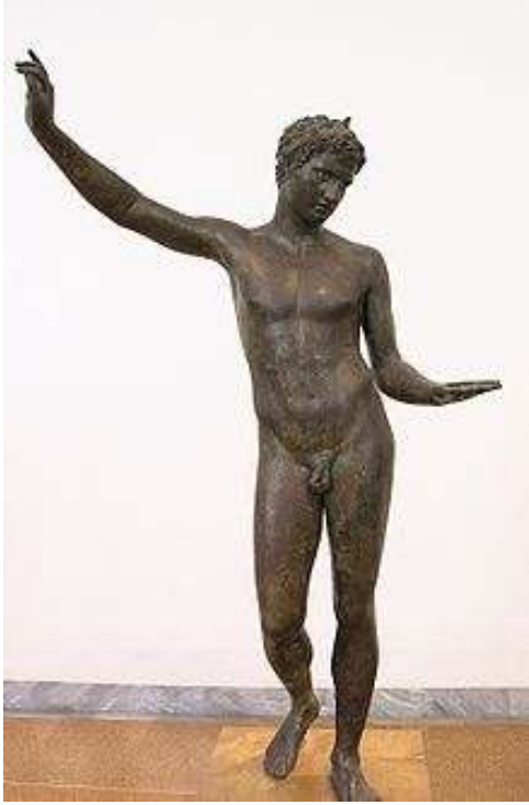
Resim 42: Marathon Genci ( http://gezi-yorum.net/yunanistan-atina-monastiraki ), (Aralık 2013)