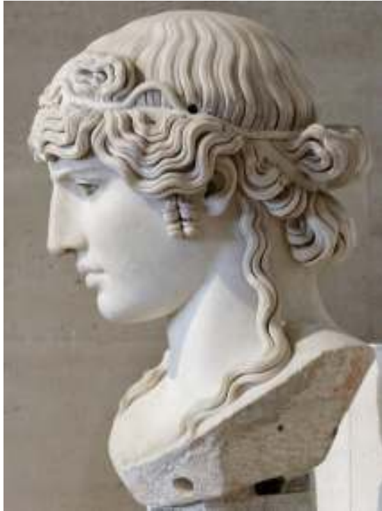
Resim 60: Antinoos Mondragone (Zanker, 1974, s. 99, Taf. 76, Res. 3-4)