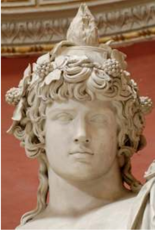
Resim 62: Antinoos Mondragone ( www.antinoosmondragestatue.com ) (Ocak 2014)