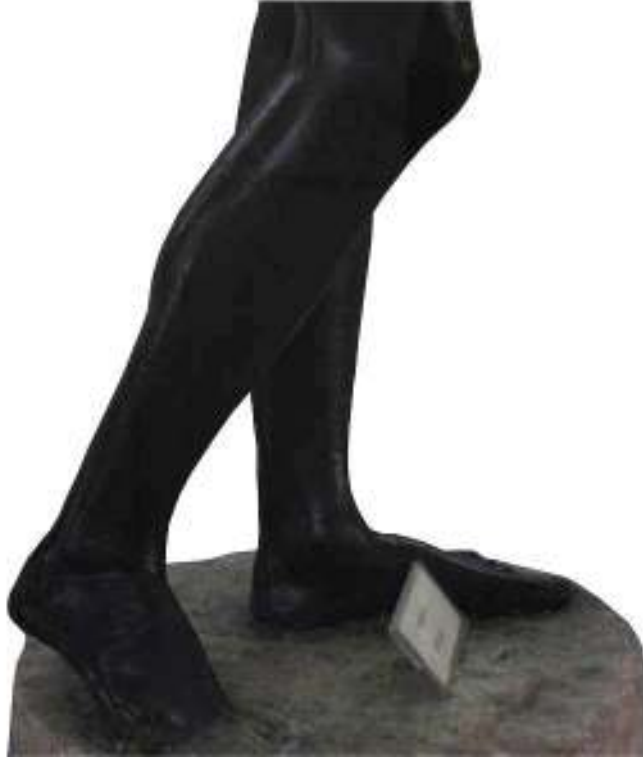
Resim 38: Heykelin Ayaklarının Duruş Şekli