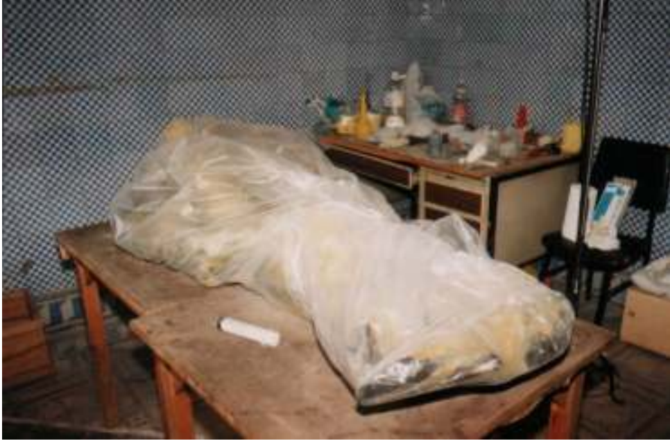
Resim 26: Heykelin Hava Almayan Naylon Torba İçinde Bekletilmesi (Trabzon Müze Envanter Kayıtları)