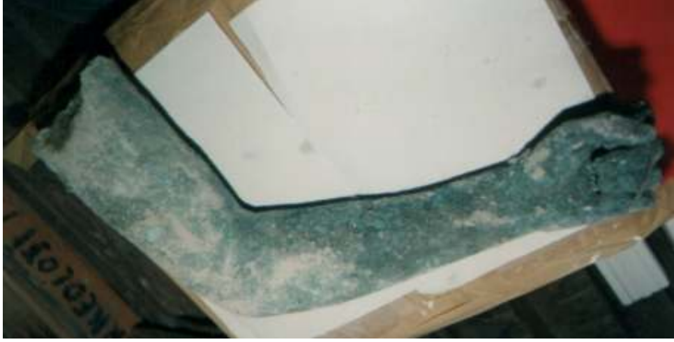
Resim 19: Heykelin Sol Kol Parçası (Trabzon Müze Envanter Kayıtları)