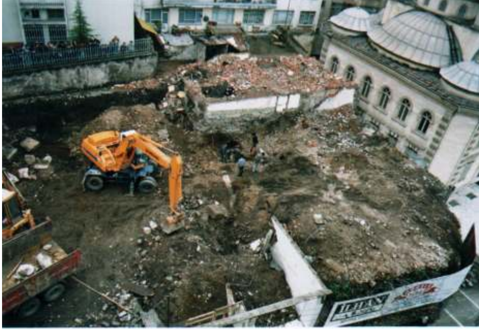
Resim 7: 1997 Yılı Kazılarında Bir Görüntü (Trabzon Müze Envanter Kayıtları)