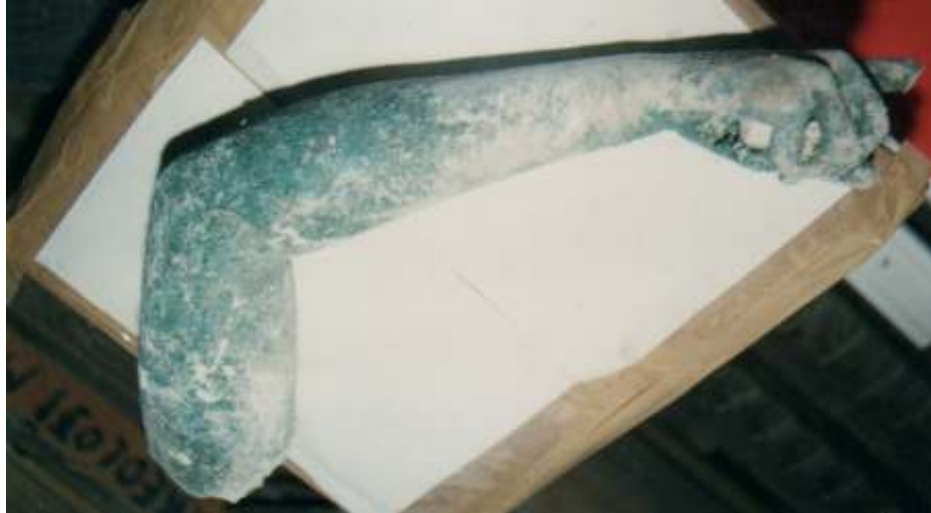
Resim 18: Heykelin Sağ Kol Parçası (Trabzon Müze Envanter Kayıtları)