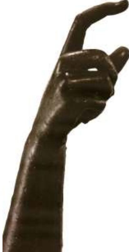
Resim 37: Heykelin Sağ El Ayrıntısı