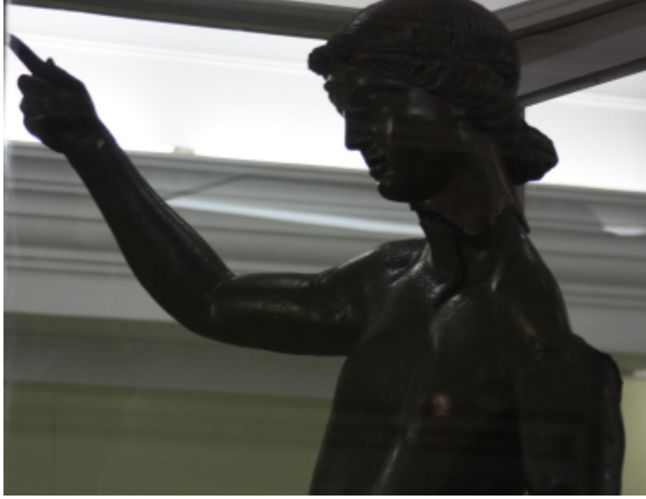
Resim 21: Heykelin Gövde Kısımındaki Eziklik