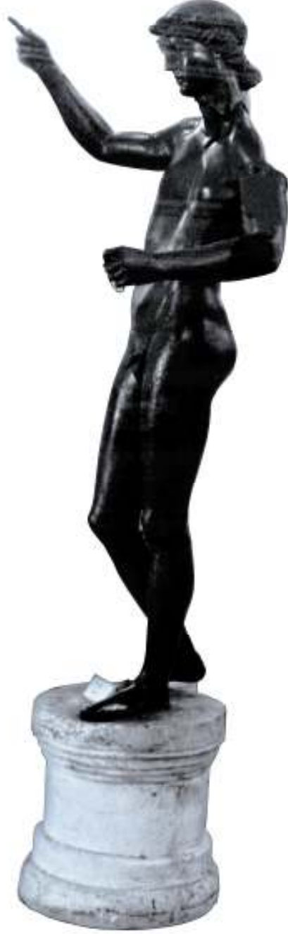
Resim 31: Heykelin Sol Yandan Görüntüsü