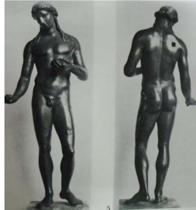
Resim 61: Adonis Heykeli (Zanker, 1974, s. 104, Taf. 77, Res. 4-5)