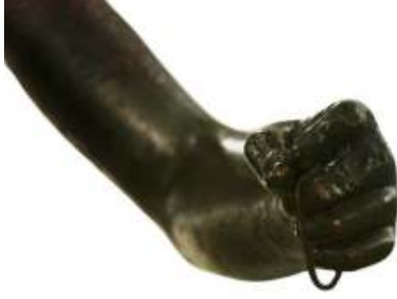
Resim 36: Heykelin Sol El Ayrıntısı