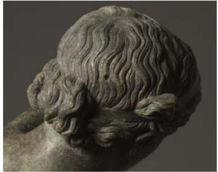
Resim 59: Apollon Sauroktonos ( www.apollonsauroktonos.com ) (Ocak 2014)