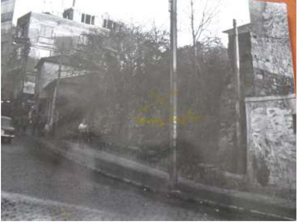
Resim 5: Eski Yapı Kalıntıları