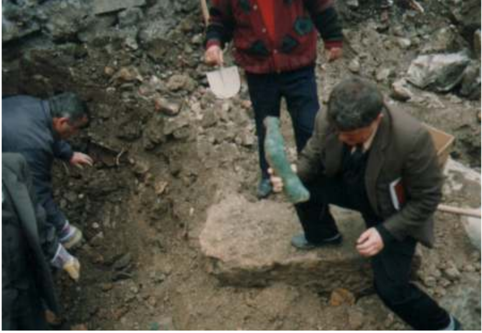
Resim 15: Parçalar Halinde Çıkan Heykelin Kolundan Bir Görüntü (Trabzon Müze Envanter Kayıtları)