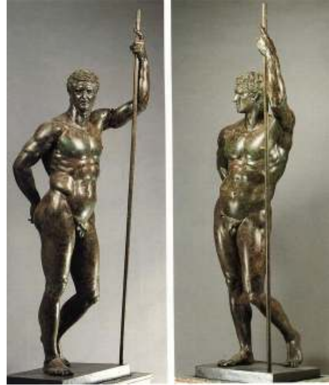
Resim 47: Terme Yöneticisi ( www.studyblue.com ), (Ocak 2014)