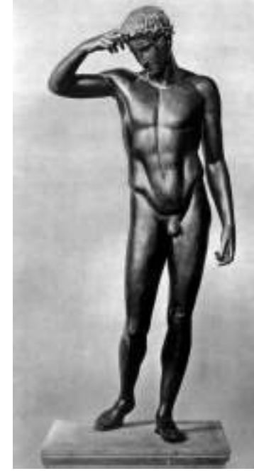
Resim 41: Westmacott Atleti ( http://dardel.info/museum/greeksculpture/westmacott ), (Aralık 2013)