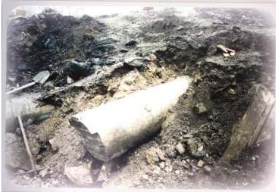
Resim 10: Kazı Alanından Görüntü (Trabzon Müze Envanter Kayıtları)