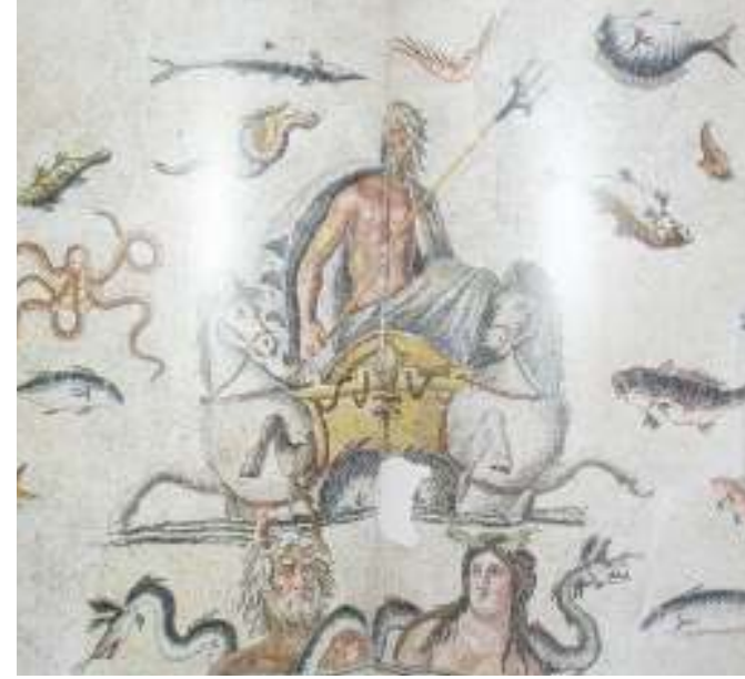
Resim 53: Okeanos ve Tethys Tasvirleri (Belkıs-Zeugma Mozaikleri, 2006, s. 110, Res. 112,113)