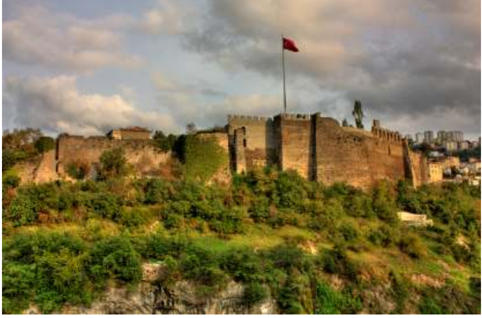
Resim 1: Trabzon Kalesi ( www.TrabzonKalesi.com ), (Şubat 2013)