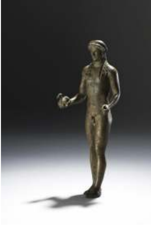
Resim 40: Konachos'un Apollon Phileios Heykeli ( www.britishmuseum.com ), (Aralık 2013)