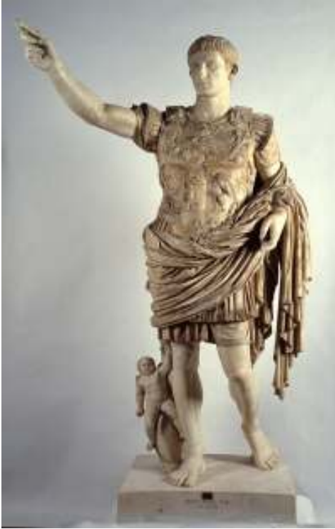
Resim 50: Augustus Prima Porta (Özgan, 2013, s. 158-159, Res. 104a)