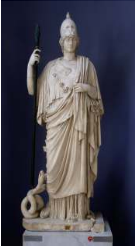
Resim 48: Athena Giustiniani ( http://common.wikimedia.org ), (Ocak 2014)