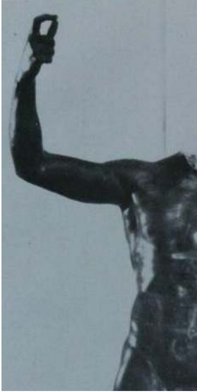
Resim 46: Septimius Severius Heykel Torsosu (İnan, 1994, s. 22, Lev. XXI, Res. 35)