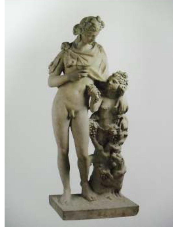
Resim 63: Dionysos Heykeli (Jenkins – Turner, 2009, s. 76, Res. 76)