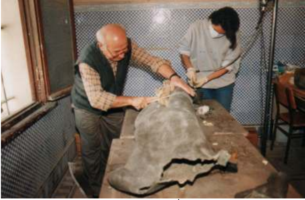
Resim 23: Mekanik Temizleme İşleminin Uygulanışı (Trabzon Müze Envanter Kayıtları)