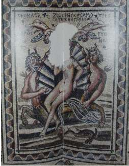
Resim 54: Deniz Kentaurosları (Belkıs-Zeugma Mozaikleri, 2006, s. 114, Res. 116, 117)