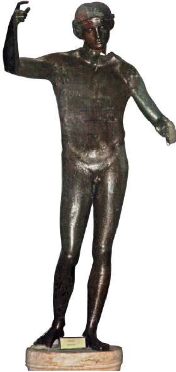
Resim 29: Heykelin Genel Görüntüsü