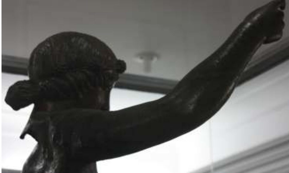
Resim 22: Heykelin Sırt Kısımındaki Eziklik