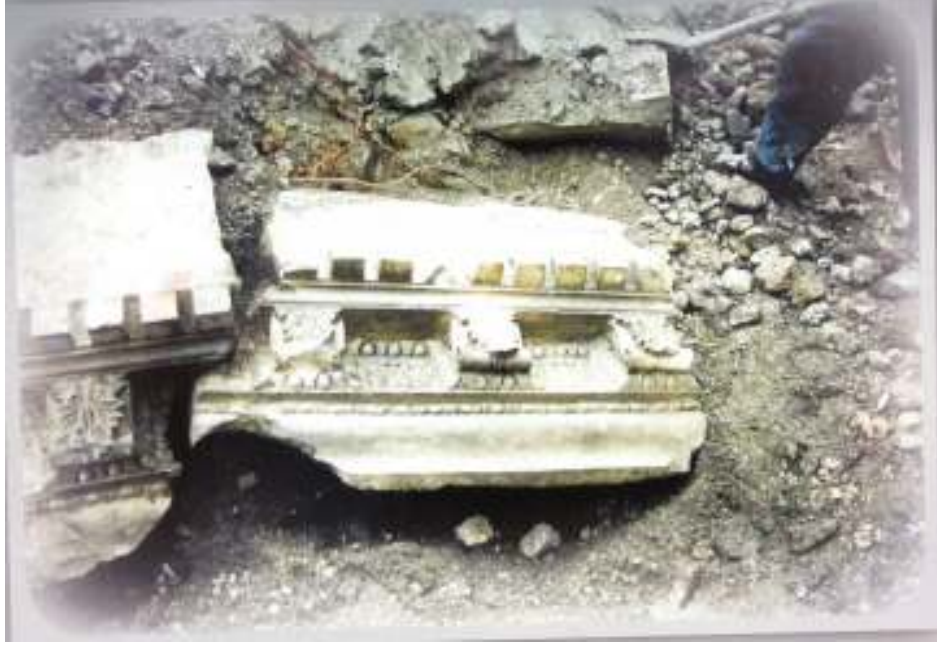
Resim 9: Kazı Alanından Görüntü (Trabzon Müze Envanter Kayıtları)