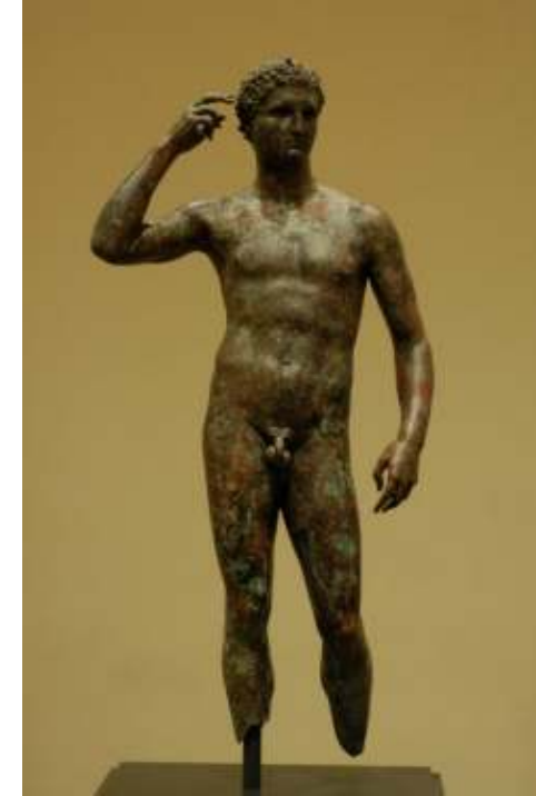
Resim 43: Victorious Genci ( www.bronzevictoriousyouthatthegettymuseumstatue ), (Aralık 2013)