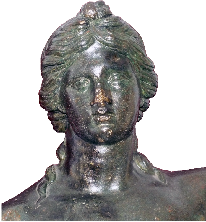
Resim 52: Apollon Başı