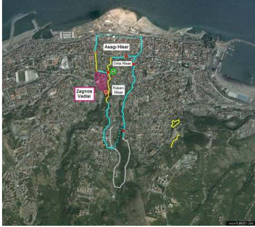
Resim 3: Trabzon'un Uydu Görüntüsü ( www.wowTurkey.com ), (Şubat 2013)