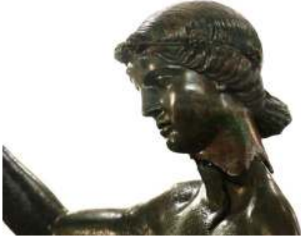
Resim 32: Heykelin Boynundaki Kırıklıklar