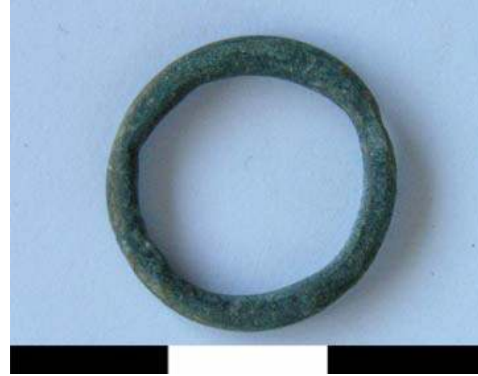
Resim 51: Bronz Halka (A. Tanrıver, 2009, s. 189, Lev. CXXIII, Res. BH 19)