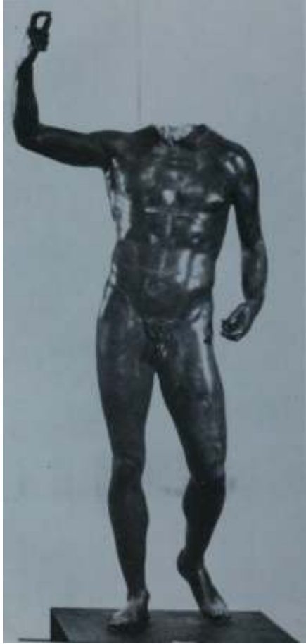
Resim 44: Septimius Severius Heykel Torsosu (İnan, 1994, s. 22, Lev. XXI, Res. 35)