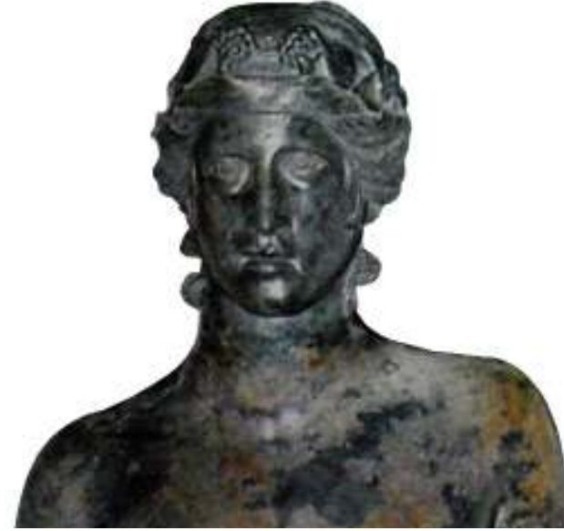
Resim 55: Dionysos Heykelinin Başı (Yitik Miras'ın Dönüş Öyküsü, 2003, s. 91, Res. 56)