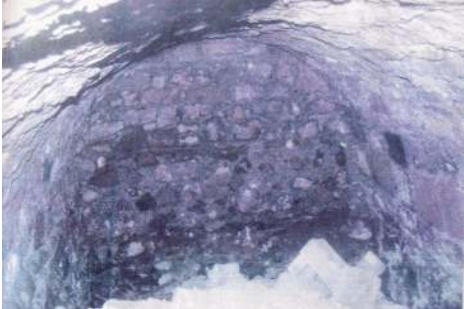
Resim 12: 2010 Yılı Kazı Çalışmalarında Bulunan Dehliz (Trabzon Müze Envanter Kayıtları)