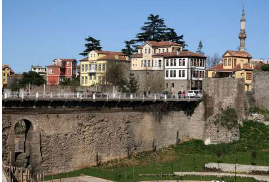
Resim 2: Kale içinde kalan Tabakhane Mevkii ( www.tabakhaneköprüsü.com ), (Şubat 2013)