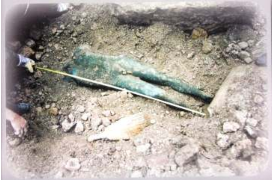
Resim 11: Kazı Alanından Görüntü