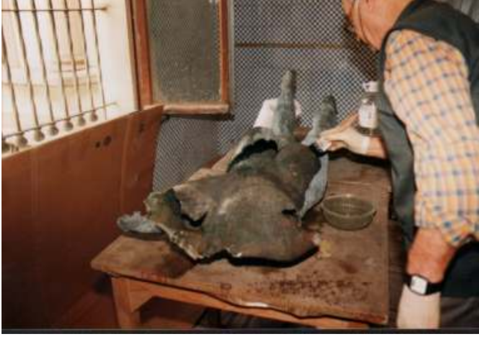
Resim 27: Heykelin Koruyucu Sıvı İle Kaplanması İşlemi (Trabzon Müze Envanter Kayıtları)