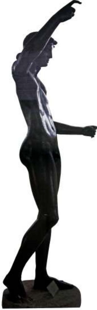
Resim 30: Heykelin Sađ Yandan Görüntüsü