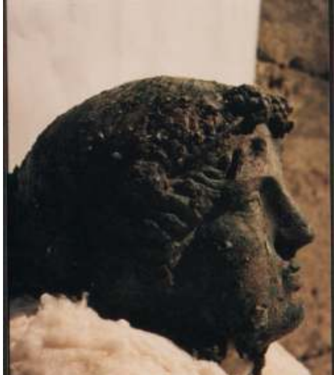
Resim 20: Heykelin Başı (Trabzon Müze Envanter Kayıtları)