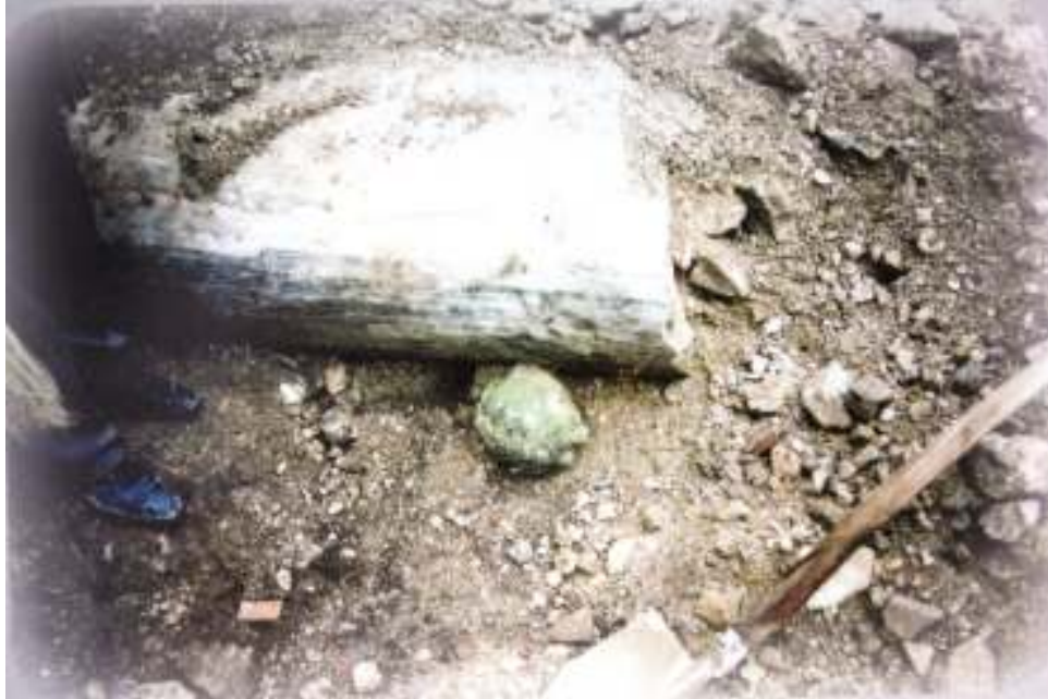
Resim 14: Kazı Alanından Bir Görüntü (Trabzon Müze Envanter Kayıtları)