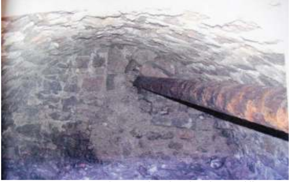
Resim 13: 2010 Yılı Kazı Çalışmalarında Bulunan Dehliz (Trabzon Müze Envanter Kayıtları)