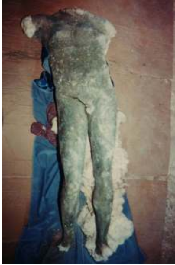
Resim 17: Heykelin Korozyonlu ve Toprak Kaplı Gövdesinden Görüntü