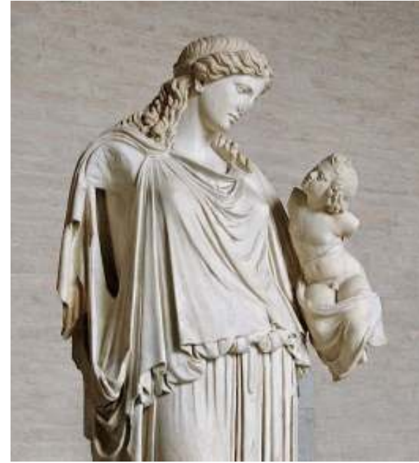
Resim 57: Eirene-Plutos (Boysal, 1067, s. 72, Res. 83)