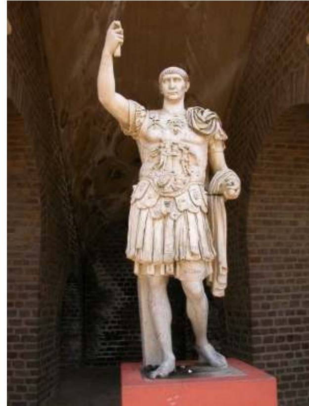
Resim 49: Traian (Ocak 2014)