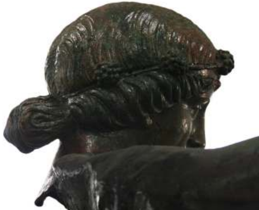
Resim 35: Heykelin Saç Ayrıntısı