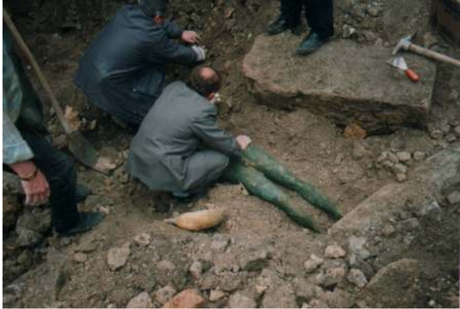
Resim 16: Heykelin Gövdesinden Bir Görüntü