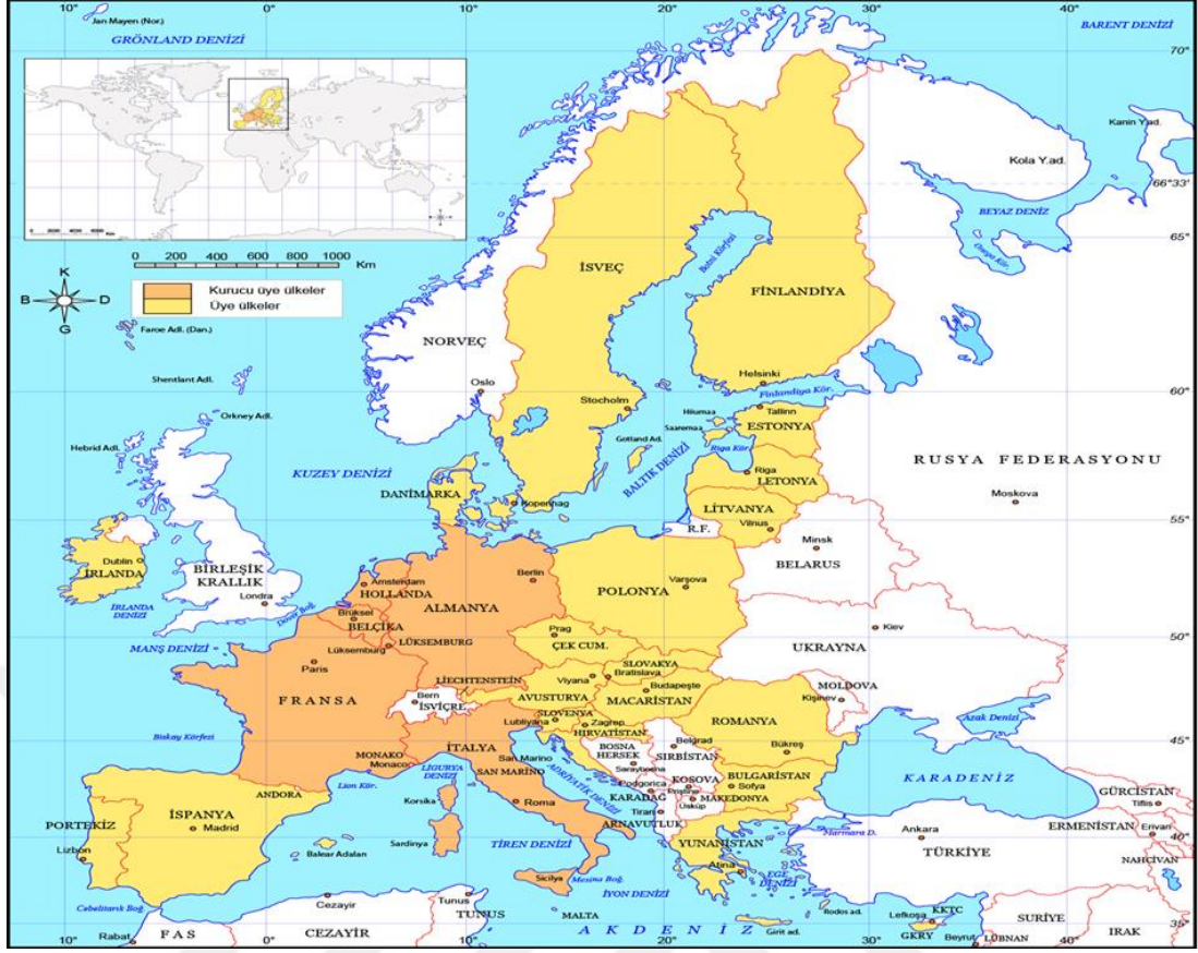
Şekil 2.3: AB Üyesi Ülkeler Haritası

“Avrupa Birliği Haritası: Avrupa Birliğinde Bulunan Kurucu ve Üye Ülkeler Haritası”, Milliyet, https://www.milliyet.com.tr/egitim/haritalar/avrupa-birligi-haritasi-avrupa-birliginde-bulunan-kurucu-ve-uye-ulkeler-haritasi-turkce-6306570 [Erişim Tarihi: 08.05.2024].