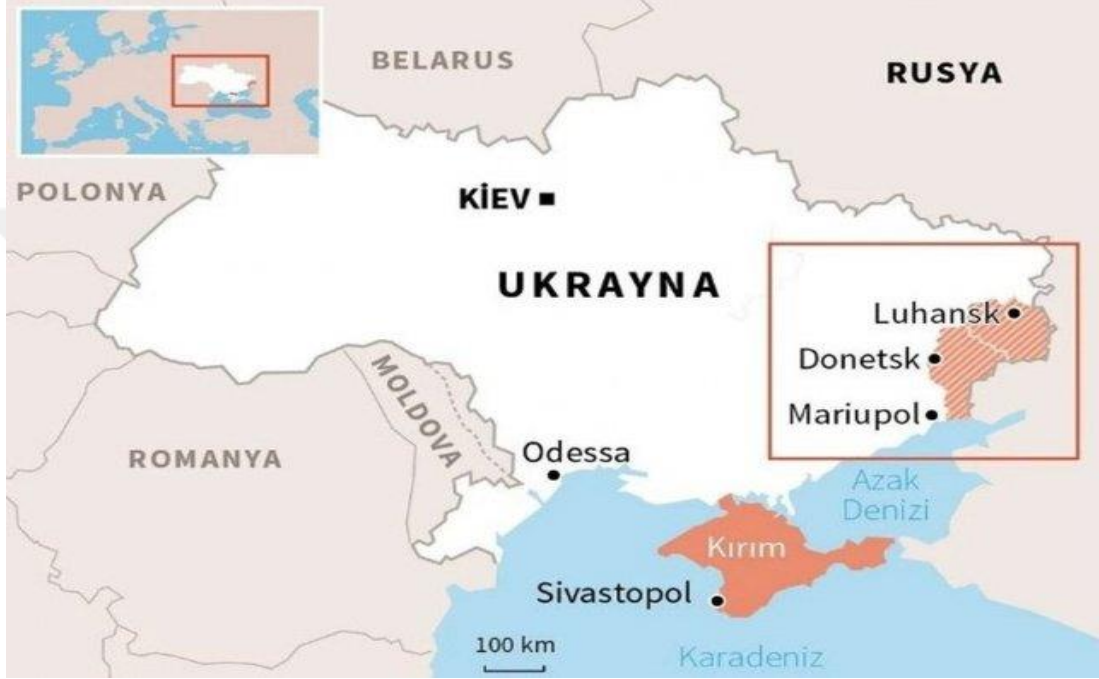
Şekil 4.3: Donbas Bölgesi Haritası

Donbas bölgesi gerek Ukrayna gerekse Rusya için oldukça önemli bir bölge konumundadır. Ukrayna'nın ekonomik yönden adeta kalbi niteliğinde olan bu bölge, Rusya ile olan kara sınırını da oluşturmaktadır. Rusya açısından bölge, savunma sanayi açısından olmazsa olmaz bir durumdur. Ancak; bölgede yerleşik Rus nüfusa, Rusya tarafından daha büyük bir önem atfedilmektedir. Rusya'nın; Sovyetler Birliği yapısı içinde bulunan ülkeler ve bu ülkelerde yerleşik Rus nüfus ile yakından ilgilenme politikası bölgenin önemini artırmaktadır. 203