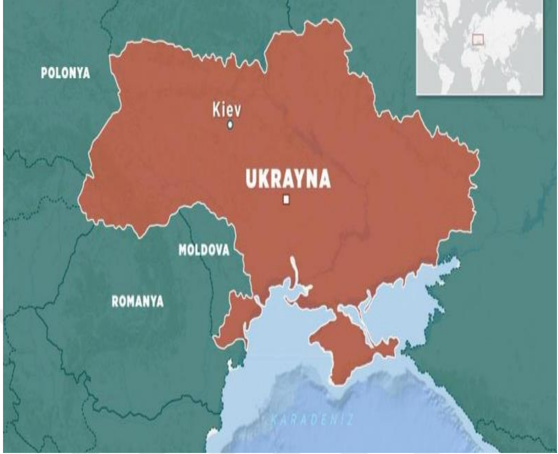
Şekil 4.1: Ukrayna ve Komşu Ülkeler Haritası

“Ülke Profili: Ukrayna”, TRT Haber, https://www.trthaber.com/haber/dunya/ulke-profilu-ukrayna-569251.html [Erişim Tarihi:08.05.2024]