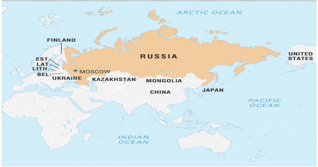
Şekil 3.1: Rusya Federasyonu ve Komşu Ülkeler Haritası

1985 yılında Mihail Gorbaçov’un SSCB’de iktidara gelmesi sonrası uyguladığı açıklık (glasnost) ve yeniden yapılanma (perestroika) politikalarının başarısızlıkla sonuçlanması; yalnız SSCB açısından değil, uluslararası sistem açısından da önemli sonuçlara yol açmıştır. 1991 yılında SSCB’nin dağılması neticesinde; Soğuk Savaş ve iki kutuplu dünya düzeni sona ermiş, SSCB yapısı içinde yer alan ülkeler coğrafyasında önemli bir güç boşluğu ortaya çıkmıştır. 59 Sovyetler Birliği’nin ardından 15 ülke bağımsızlığını ilan etmiş, Moskova merkezli yapı ise Rusya Federasyonu olarak yeni devlet yapılanmasını oluşturmuştur. 60