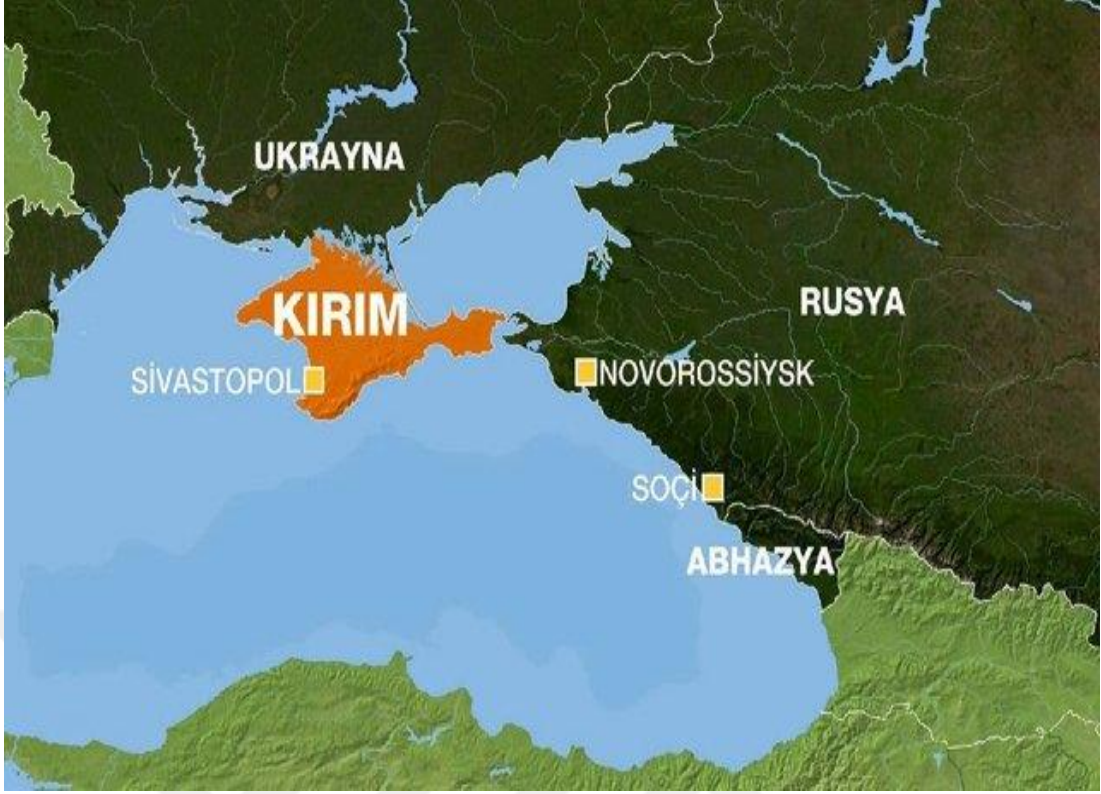
Şekil 4.2: Kırım'ın Coğrafi Konumu

“Kırım ve Belarus nerede?”, Habertürk, https://www.haberturk.com/kirim-ve-belarus-haritadaki-yeri-konumu-kirim-ve-belarus-nerede-rusya-ukrayna-savasi-icin-onemi-nedir-3355012/4 [Erişim Tarihi:08.05.2024]