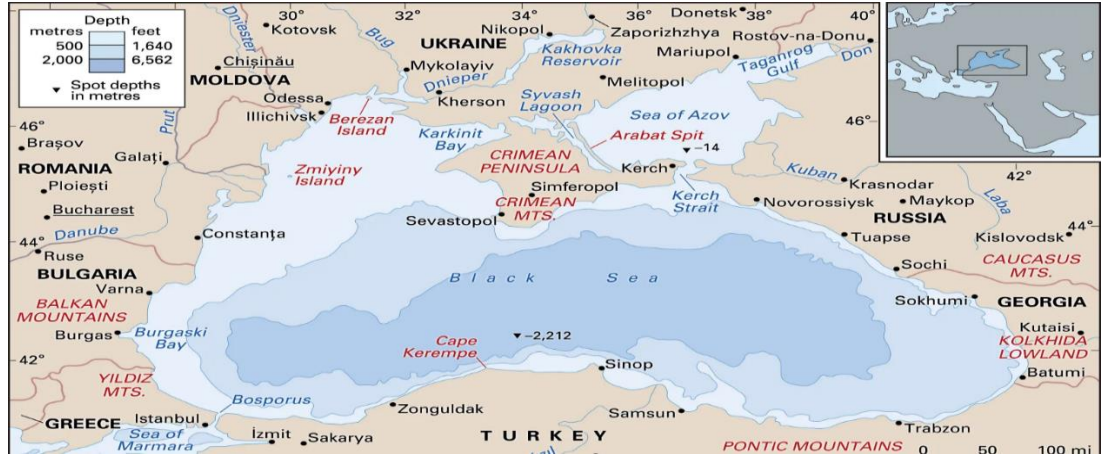
Şekil 2.1: Karadeniz'e Kıyısı Olan Ülkeler Haritası

Avrupa ve Asya kıtalarının ortasında stratejik önemi haiz bir konumda yer alan Karadeniz; İstanbul ve Çanakkale Boğazları ile Akdeniz, Afrika kıtası ve Atlantik Okyanusu'na; Tuna, İdil (Volga), Ten (Don) ve Özü (Dinyeper) nehirleri aracılığıyla Baltık Denizi ve Hazar Denizi'ne ulaşmakta olup, etki alanını Avrupa ile Türkistan (Orta Asya) içine kadar genişletmektedir. 1 1200 km uzunluğu, 615 km genişliği ve kapladığı 420 bin km 2 alan ile büyük bir iç deniz olma özelliği taşıyan Karadeniz; güneyinde Türkiye, batısında Bulgaristan, Romanya, Moldova, kuzeyinde Ukrayna, Rusya ve doğusunda ise Rusya ile Gürcistan tarafından çevrelenmektedir. 2