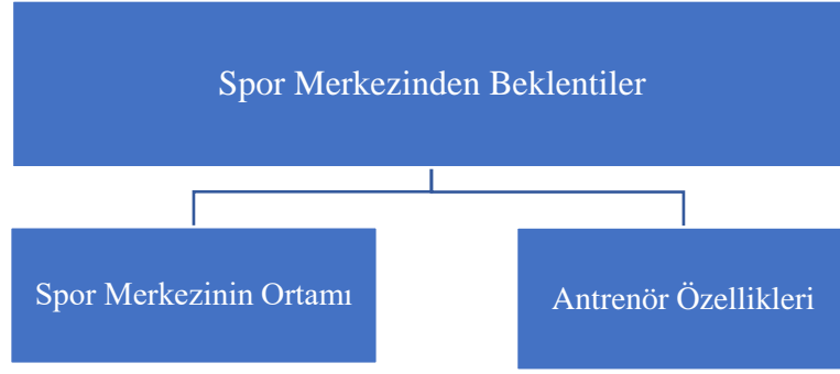
Şekil 4: spor merkezinden beklentiler ana teması ve alt boyutları

Göçmen kadınların spor merkezinden beklentileri arasında spor merkezi ortamından memnun olmak, spor merkezinin hijyen olması ve ortamdaki yabancılaşma çekmemek olduğunu ifade etmişlerdir.