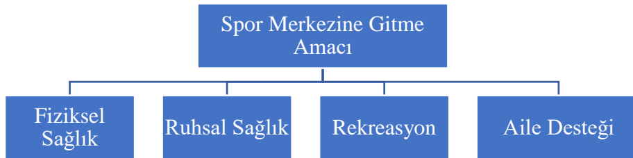
Şekil 2. Spor merkezine gitme amacı ana teması ve alt boyutları

Araştırmanın sonuçları, spor merkezine gitme amacının ana teması ve alt boyutlarına odaklanarak şekillendirilerek şekil 2’de gösterilmiştir.