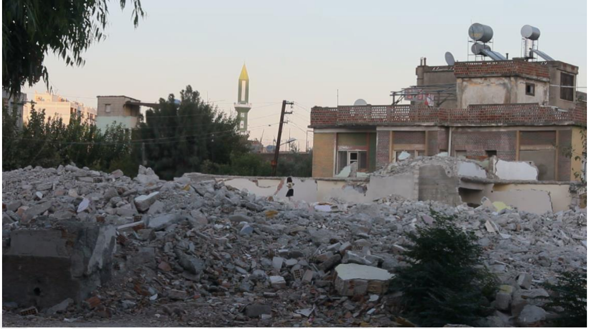
Görsel 7. Moloz Yığınlarında Suriyeli Kız Çocuğu