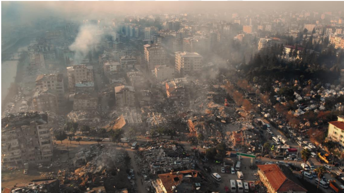
Görsel 8. Yaşanan Deprem Sonrasında Bir Enkaz

Belgesel yapım sürecinde meydana gelen deprem, kentsel dönüşümün ve sağlıklı mimarinin önemini bir kez daha gündeme taşımıştır. Deprem anına ilişkin ve deprem