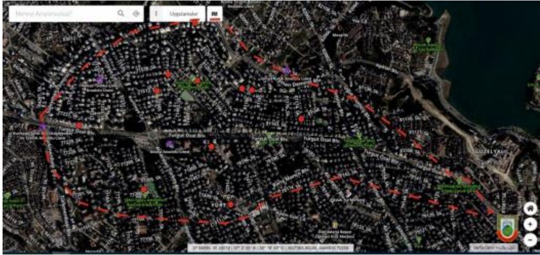
Şekil 2. Yıkılan Binaların Konumları

Asrın felaketi olarak anılan bu doğa olayı sonrası Kentsel Dönüşüm ve yapı güvenliği gibi konular bir kez daha önem kazanmıştır.