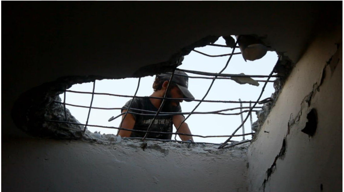
Görsel 6. Kentsel Dönüşüm İle Yıkılan Evden Demir Çıkarmaya Çalışan Suriyeli Baba

Kentsel dönüşüm projesinin en alt katmanını oluşturan Suriye göçmeni baba ve kızı, moloz yığınlarından demir toplayarak geçimini sağlıyor.