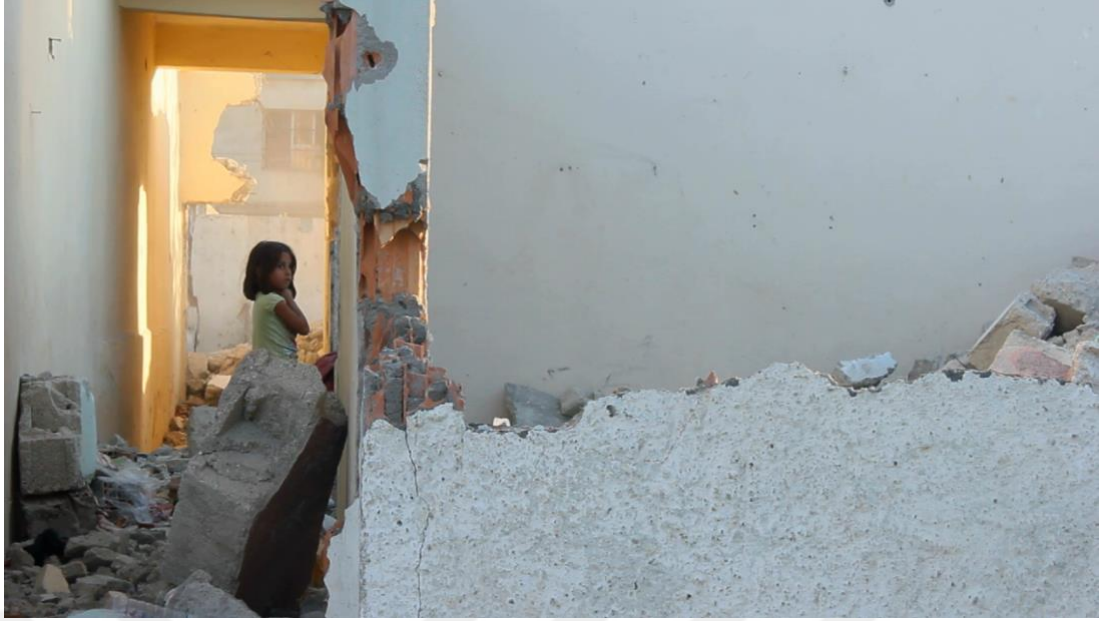
Görsel 4. Yıkıntılar Arasında Bir Kız Çocuęu

Tarih boyunca göç alan Sinanpaşa Mahallesi günümüzde de göç almaya devam etmektedir. Yakın zamanda yaşanan Suriye savaşı ile birlikte özellikle ülkemizin güney kesimlerine yerleşen Suriyeli vatandaşların Sinanpaşa'ya yerleşmeleri mahallenin yaşam formunu etkilemiştir.