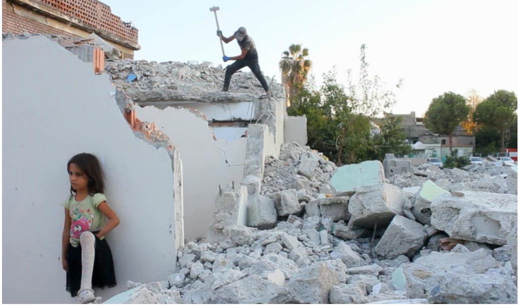
Görsel 5. Yıkıntılar Arasında Kız Çocuğu Ve Baba

Kentsel dönüşüm projesinin en alt katmanını oluşturan Suriye göçmeni baba ve kızı, moloz yığınlarından demir toplayarak geçimini sağlıyor.