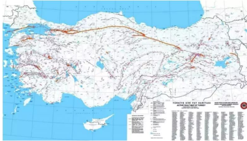
Şekil 1. Türkiye Fay Hattı Haritası

6 Şubat 2023 Tarihinde meydana gelen 7.7 büyüklüğündeki Pazarcık ve 7.6 büyüklüğündeki Elbistan depremleri yaklaşık 160 km ve 190 km uzakta olmasına rağmen Adana’da 11 apartmanın yıkılmasına 30 binanın ağır hasar, 120 binanın da orta hasar almasına neden olmuştur. Deprem sonucu Adana’da 418 insan hayatını kaybetmiştir. Özellikle Çukurova İlçesinde belli bir kesimde bina yıkılması ve hasarlı binaların çokluğu, binaların bu bölgede niçin yıkıldığı sorusu birçok insan tarafından merak konusu olmuştur. Depremlerde yıkılan ve ağır hasarlı olarak belirlenen binaların lokasyonları incelendiğinde genelde güneyde Barış Manço Bulvarı, kuzeyde Süleyman Demirel Bulvarı, doğuda Turgut Özal-Şehitler Bulvarı kavşağı ile batıda Öğretmenler Bulvarı arasında dağılım göstermektedir (Türkmen, 2023, s. 3).