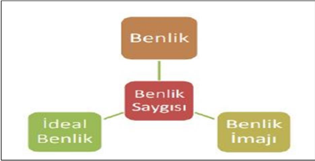
Şekil 1: Benlik Saygısı Yapısı (Yazıcı, 2018)

Yapılan çalışmalara göre, benlik saygısının yüksek olması bireyin öğrenme, problem çözüme, karar verme gibi yeteneklerini etkileyerek başarı durumunu ve meslek hayatını olumlu yönde etkileyebilir. Benlik saygısının düşük olduğu durumlarda ise bireyin sorumlulukları altında ezilme eğiliminde olduğu belirtilmiştir (Smith, Smoll, & Cuming, 2007). Bu bağlamda, bireyin benlik saygısının güçlendirilmesi, genel yaşam kalitesini artırabilir ve başarı odaklı aktivitelerde daha etkili olmasına katkı sağlayabilir.