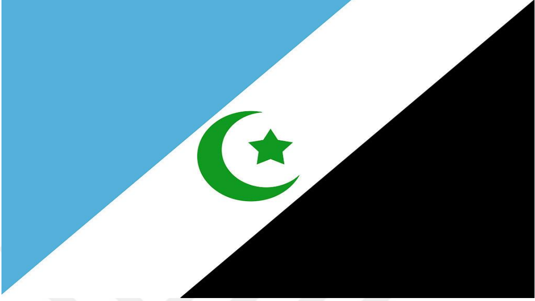
Resim 1: Şebeklerin Bayrağı.