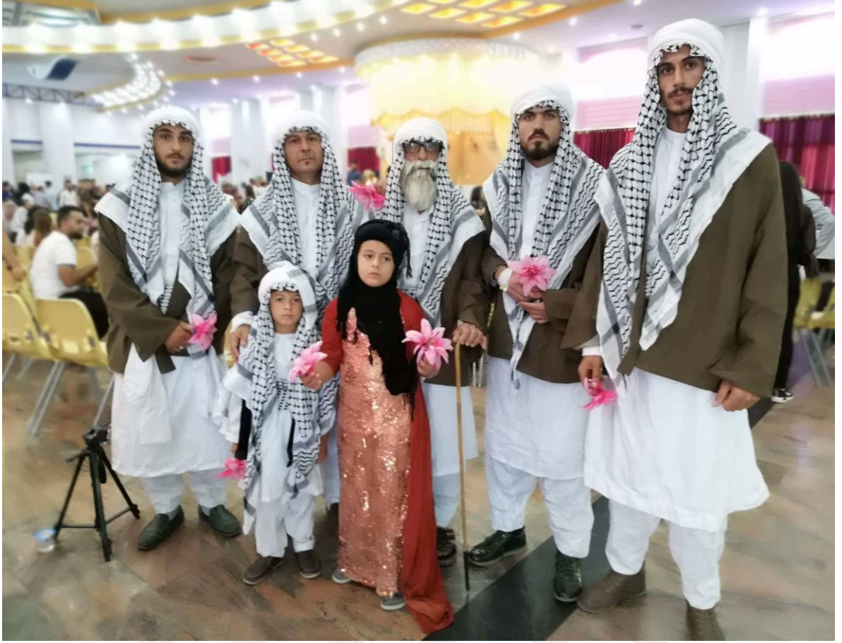
Resim 5: Şebeklerin geleneksel elbisesi.