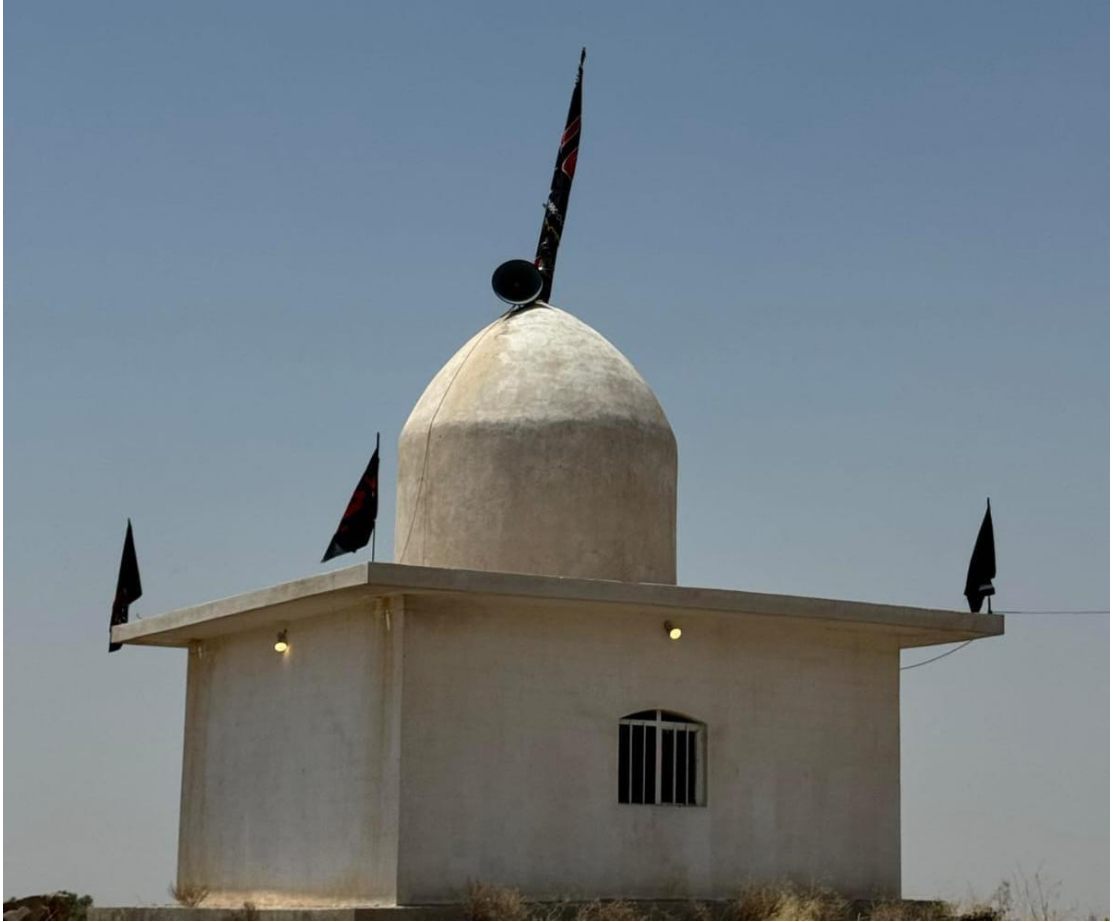
Resim 2: Zildaş'ın dış görüntüsü.