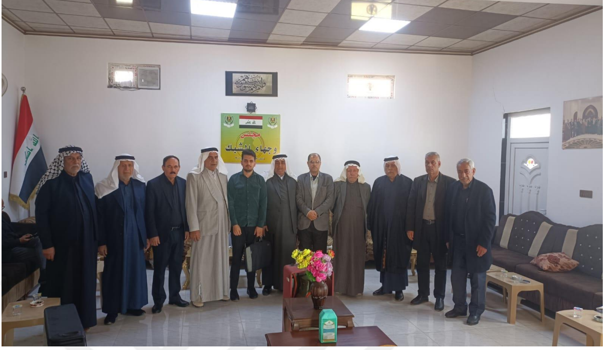
Resim 7: Mülakattan sonra “Şebeklerin Seçkin Heyeti” ile çekilmiştir.