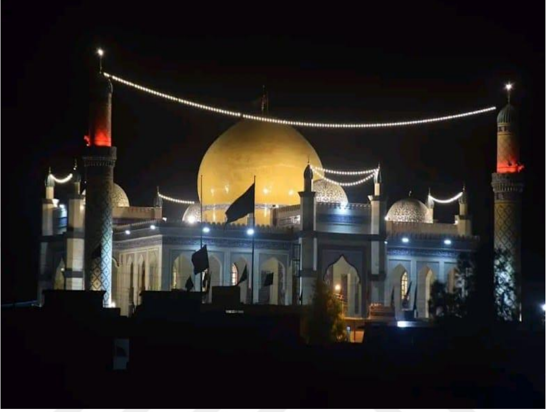
Resim 4: İmam Zeynelabdin Makamı