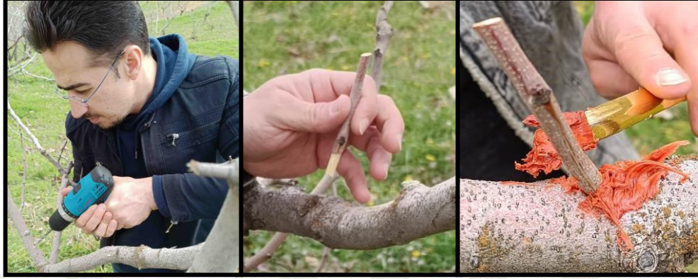
Şekil 4.3. 06.03.2024 tarihinde tekrarlanan matkap aşı uygulaması

önceki uygulamamızdan farklı olarak, daha ince aşı yuvaları açılarak ve yine daha ince aşı kalemleri kullanılarak gerçekleştirilmiştir (Şekil 4.3).