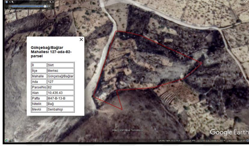
Şekil 3.6. 2018 yılında yangında zarar gören bahçenin 8. ay uydu görüntüsü

yılı Temmuz ayında yangın çıkmış ve çıkan yangında söz konusu bahçe de zarar görmüştür (Şekil 3.6).