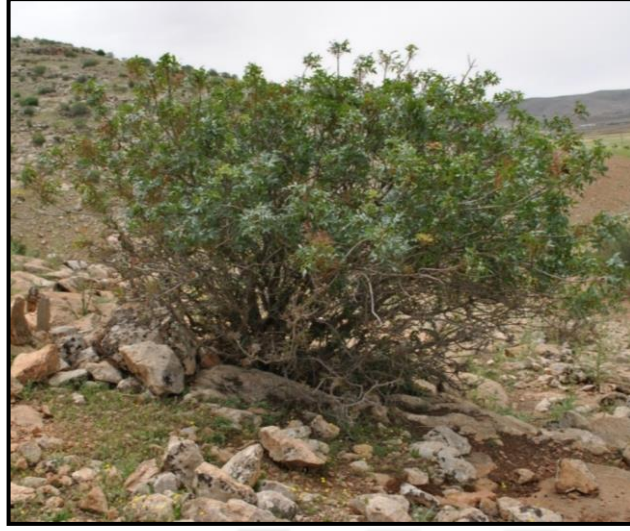
Şekil 3.7. Menengiç anacı

Menengiçlerde yaprakçık sayısı farklılık göstermekle birlikte genellikle 4-6 çift olup uç yaprakçığı, yaprakçıklarla yakın büyüklüktedir. Sivri ve oval şekilli yaprakları olmakla birlikte ülkemizde sivri yapraklı olanları yaygındır. Çiçekleri renk yönünden çeşitlilik gösterir, salkım yapıları ve renkler yönünden ocaklar arasında farklılıklar bulunmaktadır. Fakat genellikle uzaktan kıvılcıkta görünür, yine salkım sapları da genelde kırmızımsı yapıdadır. Erkek çiçeklerinin dölleyici olarak kullanılmaları önerilmemektedir. Tohumları şişkin mercimeğe benzer. Tohum, 5,7 mm uzunluk ve 4,2 mm genişliktedir. Tohumları çerezlik ve kahve olarak tüketilmektedir.