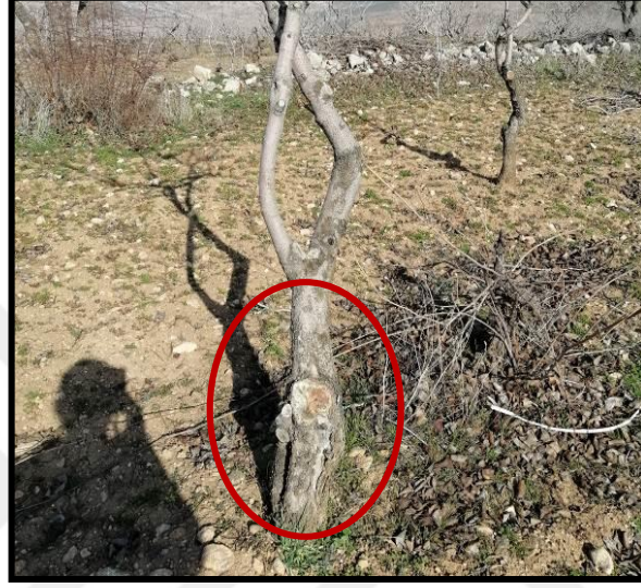
Şekil 3.3. Taç dalı kesilen fıstık ağacının çıplak kalmış gövdesi

Antepfıstığı ağacı taç dalları yıllar geçtikçe yaşlanarak verimden düşebilmektedir. Verimden düşen taç dallar gençleştirme budaması ile tekrar verime kazandırılma sürecine alınmaktadır. Bu süreçte kesilen yaşlı dalların yerine çıkan yeni sürgünler, bazen istenilen konum ya da açıdan çıkış yapmamakta bu da yeniden taçlandırma için sorun oluşturmaktadır (Şekil 3.3).