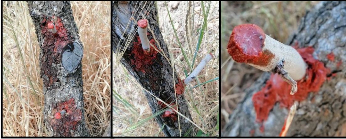
Şekil 4.2. 06.06.2022 tarihinde yapılan kontrollerde aşılardan son durumu

06.06.2022 tarihinde yapılan ikinci kontrollerde 1. ve 2. Uygulamaya ait bütün aşı gözlerinin tamamen kuruduğu, aşı bölgelerinden yoğun bir sakızlanma ve sakız akışının olduğu görülmüştür (Şekil 4.2).