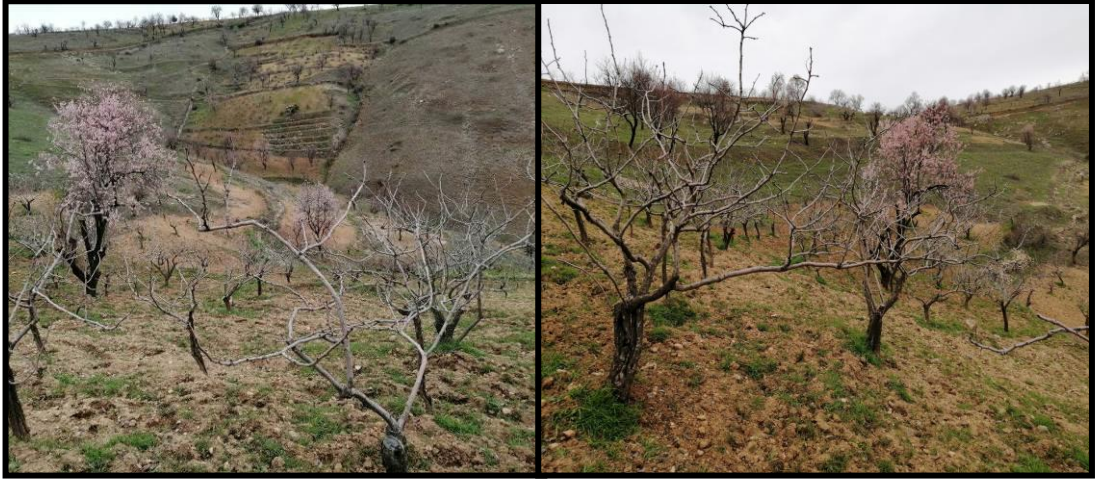
Şekil 3.5. Bahçede birinci aşı uygulamasının yapıldığı 2022 yılı 3. ay görüntüsü

Bahçedeki antepfıstığı ağaçları 40-45 yaş aralığında olmalarına rağmen, anacın menengiç oluşu, bahçenin düzensiz ve sık dikim yöntemine göre kurulmuş olması, yıllık bakımlarının yeterli olmaması gibi nedenlerden dolayı ağaçlar bodur kalmış olup yaşına göre yeteri kadar gelişim gösterememiştir. Ayrıca bahçenin bulunduğu mevkide 2018