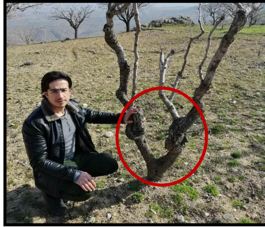
Şekil 3.2. Hatalı budama ve taçlandırma sonucu gövdesi çıplak kalan fıstık ağacı