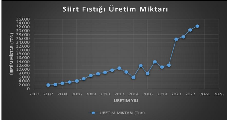
Şekil 1.3. Siirt ilinde yıllara göre Siirt çeşidinin üretim miktarı