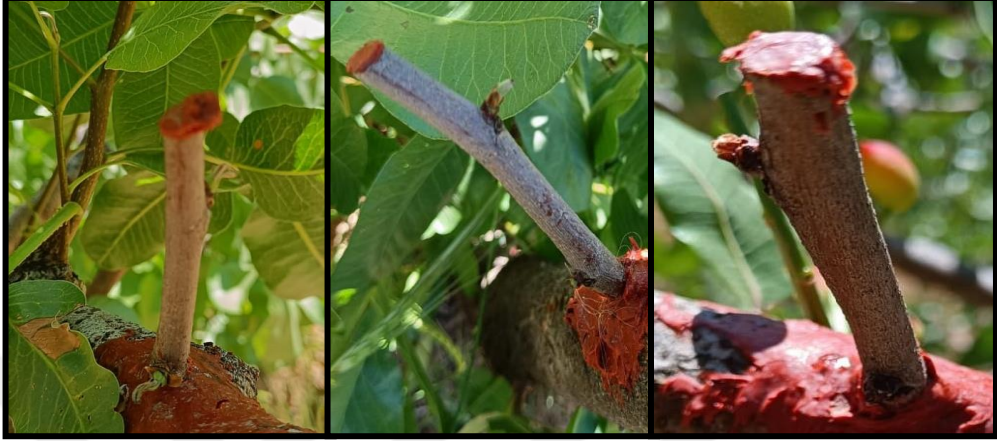
Şekil 4.5. 17.05.2024 tarihinde kontrol edilen tekrarlanmış aşılardan son durumu

17.05.2024 tarihinde yapılan son kontrollerde uyanmış olan aşı gözlerinin bazısının kuruduğu, kalanların ise kurumaya doğru belirtiler gösterdiği görülmüştür (Şekil 4.5).