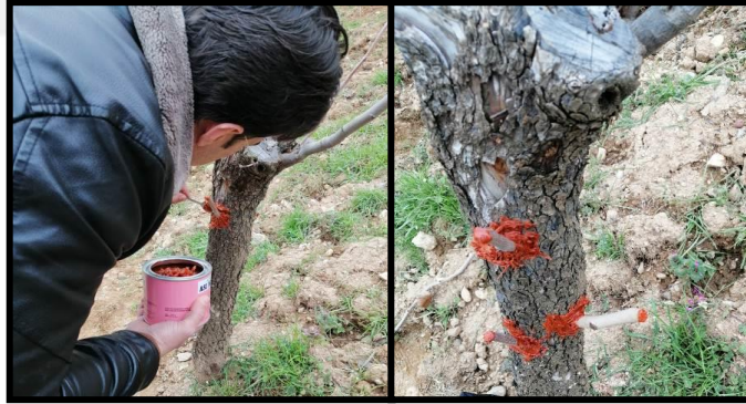
Şekil 3.11. Yapılan matkap aşından sonra aşı macunu kullanımı

Oyuk için uygun bir hale getirilen aşı kalemi, oyuğa tam yerleştirilip hava almayacak bir şekilde oturtulmuş, kesişme bitim noktasından hava ile teması önlemek için etrafı aşı macunu ile kapatılmıştır (Şekil 3.11).