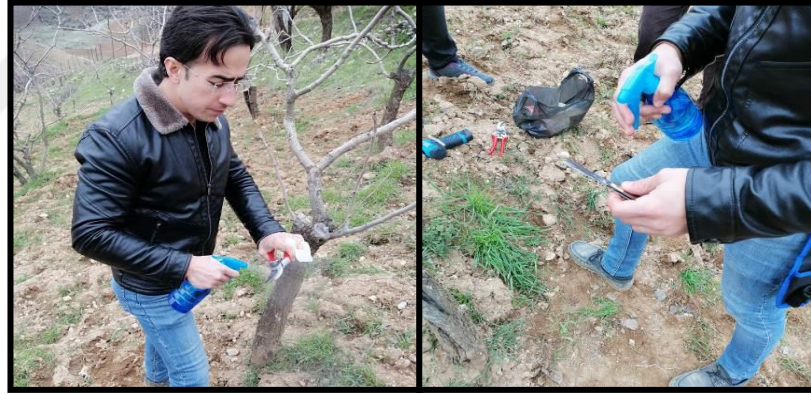
Şekil 3.8. Aşılama öncesi metal materyallerin dezenfekte edilmesi

Aşı kalemleri bahçe içerisindeki ağaçlardan temin edilmiş olup, aşı kalemleri zarar görmemiş, dal güvesi gibi zararlıların bulaşık olmadığı sağlıklı sürgünlerden budama makası ile alınmıştır. Seçilen aşı kalemleri ile matkap ucunun çap genişliğinin birbirine yakın olmasına dikkat edilmiş, aşılanan her aşı kaleminin üzerinde 2 adet sürgün gözü yer almıştır.