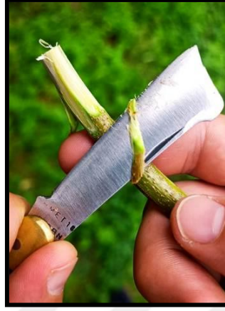
Şekil 3.10. Aşı kalemi dış kabuğunun bıçak ile soyuluşu

Aşı kalemi, açılan oyuğa yerleştirilmeden önce açılan oyuğun uzunluğu kadar aşı kaleminin dış kabuğu bıçak ile soyulmuştur (Şekil 3.10).