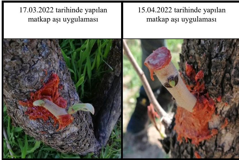
Şekil 4.1. 01.05.2022 tarihinde yapılan kontrollerde aşıların mevcut durumu

01.05.2022 tarihli kontrollerde iki farklı zamanda da yapılmış olan aşıların sürgün gözlerinin uyandığı görülmüştür (Şekil 4.1). Söz konusu kontrollerde, 17.03.2022 tarihinde (1. Uygulama) matkap ile aşılanan 9 adet aşısı kaleminden 5 tanesinde (%55,5) her birinde iki sürgün gözü olmak üzere, toplamda 18 adet (9 kalem x 2 göz) olan aşısı gözünden 9 tanesi (%50) uyanmıştır. Yine 01.05.2022 tarihinde yapılan kontrollerde 15.04.2022 tarihinde (2.Uygulama) matkap ile aşılanan 9 adet aşısı kaleminden 3 tanesinde (%33,3) her birinde yine iki sürgün gözü olmak üzere, toplamda 18 adet (9 kalem x 2 göz) olan aşısı gözünden 3 tanesinin (%16,6) uyandığı görülmüştür (Tablo 4.1).