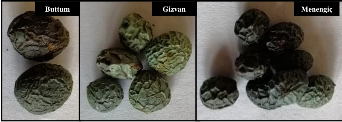
Şekil 1.1. Siirt ili doğal ekolojisinde yetişen buttum-gizvan-menengiç meyveleri

Siirt ili, Merkez ilçe ile birlikte 7 ilçeye ve 279 köye sahiptir. İlin toplam nüfusu 2023 yılı TÜİK verilerine göre 332.415 olup, yüz ölçümü 5.623.510 dekar alandır. İlin arazi varlığının 1.028.940 dekarı (da) tarım alanlarını, 288.790 da çayır-mera alanlarını 3.096.030 da orman alanlarını ve 1.209.750 dekarı ise tarım dışı diğer alanları oluşturmaktadır. Şehirde bulunan tarım alanlarının 400.790 dekarında (%38,9) Siirt fıstığı üretimi yapıldığı Tablo 1.3'te gösterilmiştir (Anonim, 2024b).