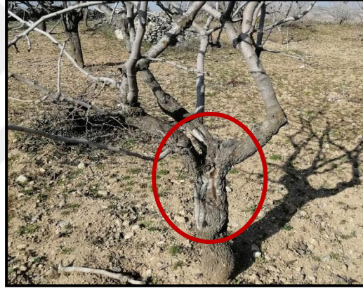
Şekil 3.1. Hatalı taçlandırma sonucu gövdede meydana gelen güneş zararı

Uzun soluklu tarımsal bir faaliyet olan antepfıstığı tarımında fıstık ağaçları zamanla birçok faktörün etkisiyle çeşitli zararlara maruz kalabilir, ağaç gelişimleri etkilenebilir, ağaçlar verimden düşebilir, kısmen ya da tamamen kuruyabilir. Yetişkin fıstık bahçelerinin birçoğunda taç dalları zarar görmüş fıstık ağaçları görülmektedir. Fıstık ağaçlarındaki bu zararlanmaların hastalık ve zararlılar, traktör çarpması ve hatalı budama gibi nedenleri olabilir. Bu sebeplerle taç dalları kesilen ağaçlar doğal olarak verimden düşmekte, çıplak kalan gövdeler güneşten zarar görerek kurumaya kadar gidebilmektedir (Şekil 3.1 ve Şekil 3.2).