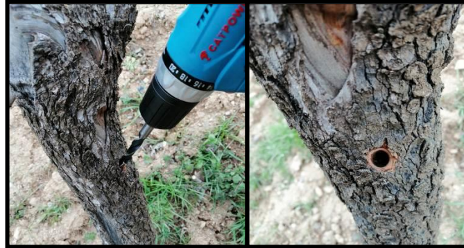
Şekil 3.9. Şarjlı matkap ile 45° açı ile açılan oyuk

Anacın belirlenmiş uygun kısmına şarjlı matkap kullanılarak 45° açı ile 2-3 cm derinliğinde ve aşı kalemi çapı genişliğinde bir oyuk açılmıştır (Şekil 3.9).