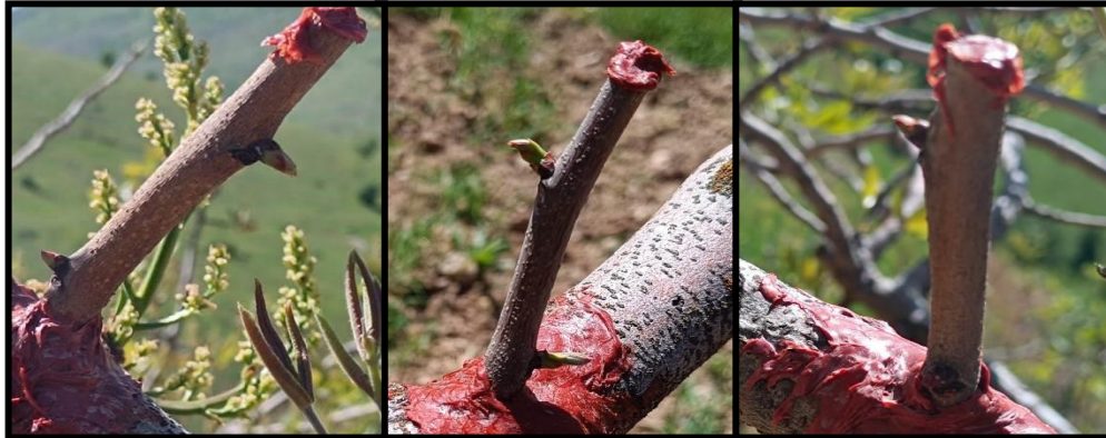
Şekil 4.4. 17.04.2024 tarihinde kontrol edilen tekrarlanmış olan aşıların son durumu