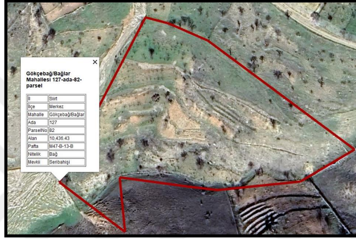
Şekil 3.4. 2024 yılı 1. ay uydu görüntüsü

Araştırmanın yapıldığı bahçe, Siirt ili Merkez ilçeye bağlı Gökçebağ beldesi Bağlar Mahallesi Seribahişi Mevkii 127 ada 82 parselinde (Şekil 3.4) yaklaşık 10,5 dekar alana, %35-40 eğime ve 910 metre rakıma sahip, dekara 50-55 adet ağaç bulunduran düzensiz ve sık dikim şeklinde tesis edilmiş bir bahçedir (Şekil 3.5).