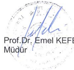
Prof.Dr. Emel KEFELİ Müdür

Yukarıdaki jüri kararı Enstitü Yönetim Kurulu' nun ...07../07../2008 tarih ve ...12-5... sayılı kararıyla onaylanmıştır.