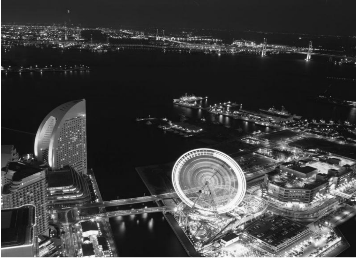
Modern Japonya'dan Bir Görüntü