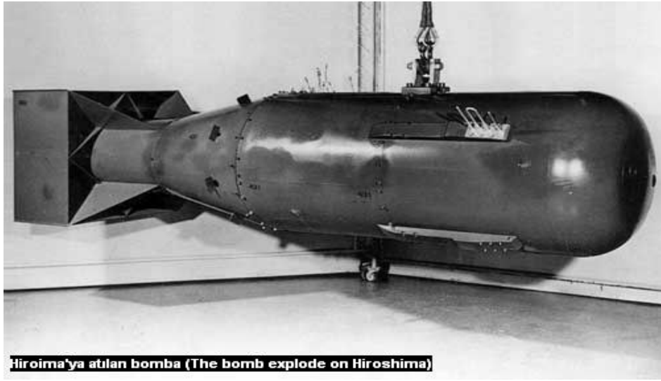
Hiroşima'ya atılan bomba (The bomb explode on Hiroshima)