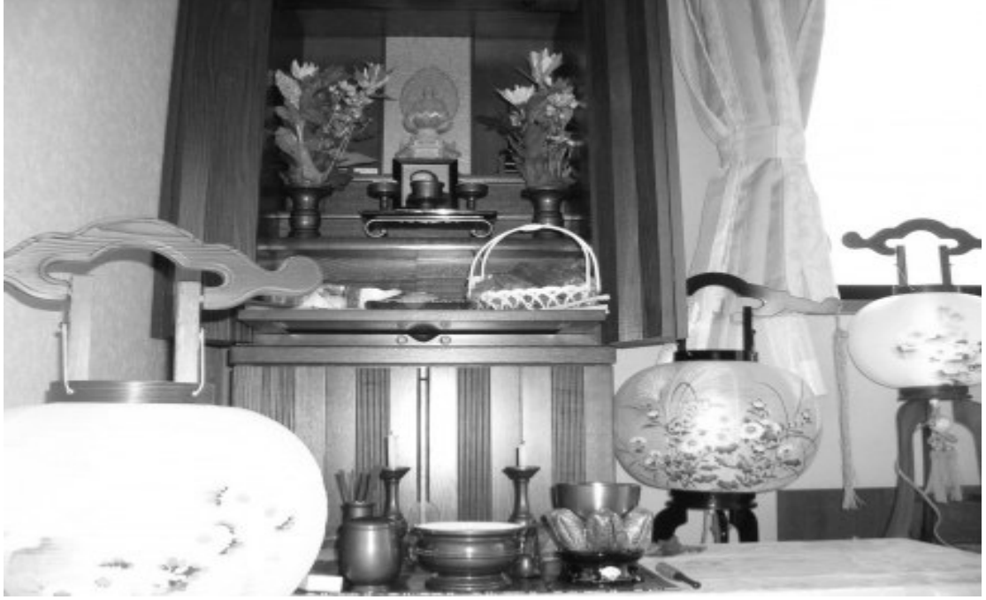
Japon Evindeki Buda Rafı