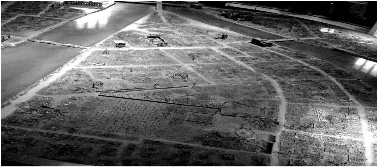
Hiroşima'nın Atom Bombası Atılmadan Önce Ve Atıldıktan Sonra Görüntüsü