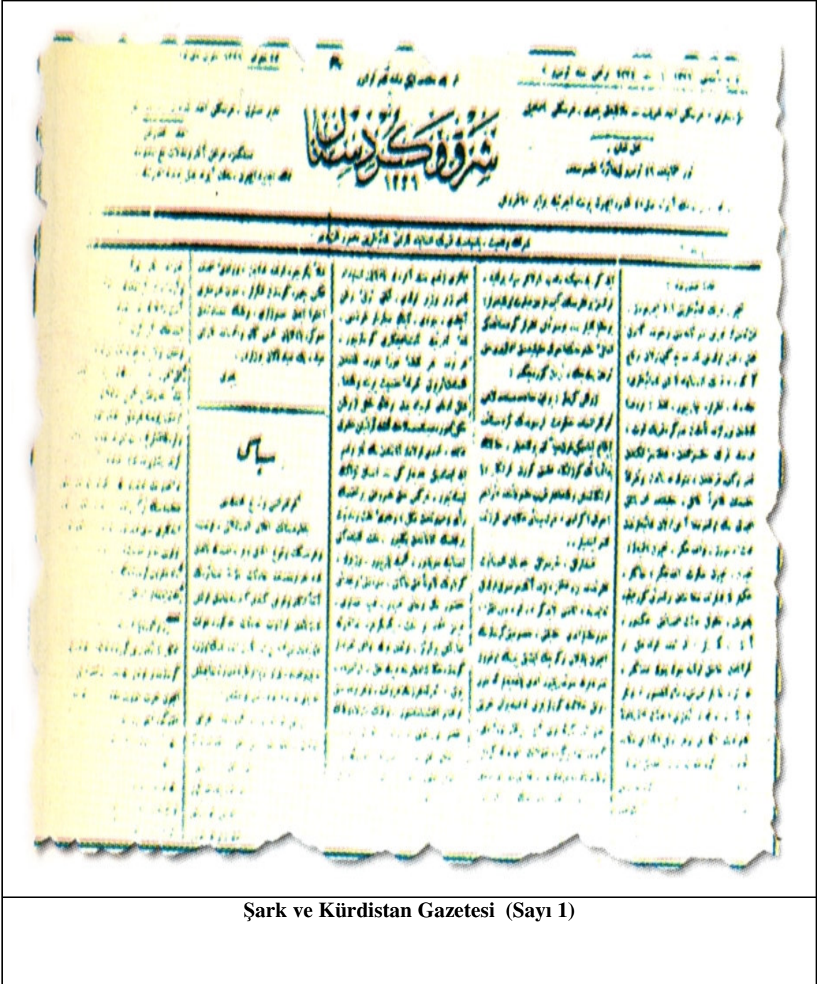
Şark ve Kürdistan Gazetesi (Sayı 1)