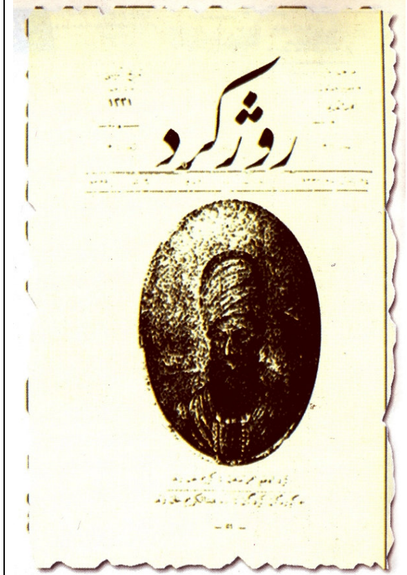
Roji Kürd Dergisi Sayı-2