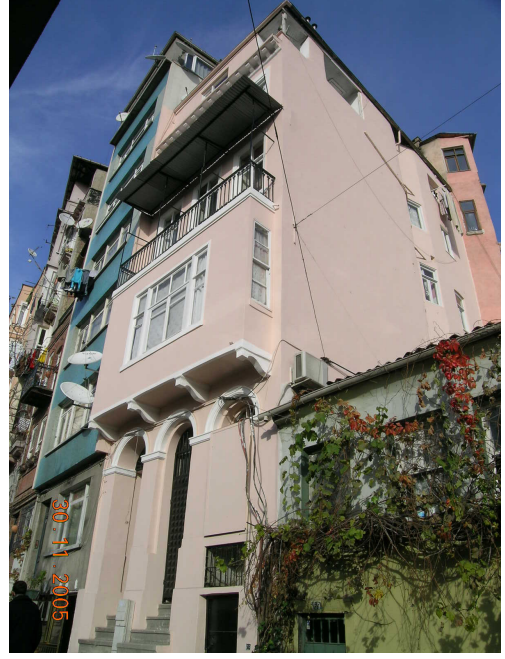
Boğazkesen Yokuşu üzerindeki bir konut ve işyerinin seçkinleştirme öncesi ve sonrası