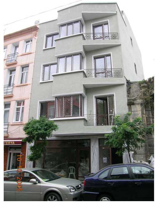
Boğazkesen Yokuşu üzerindeki 3 katlı bir konutun seçkinleştirme öncesi ve sonrası durumları