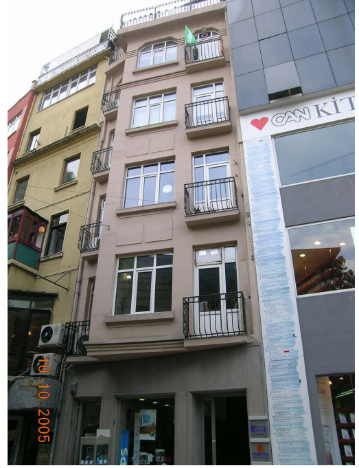
Boğazkesen Yokuşu üzerindeki çok katlı bir işyerinin seçkinleştirme öncesi ve sonrası görünümleri