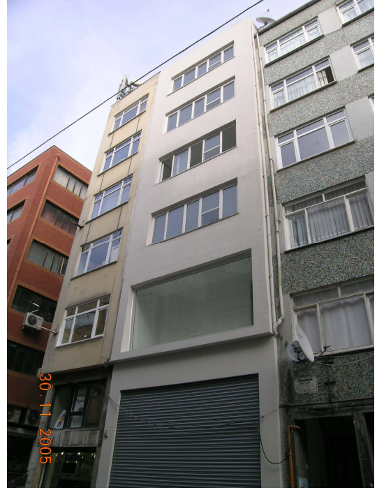
Boğazkesen Yokuşu üzerindeki bakımsız bir işyerinin seçkinleştirme öncesi ve sonrası görünümü