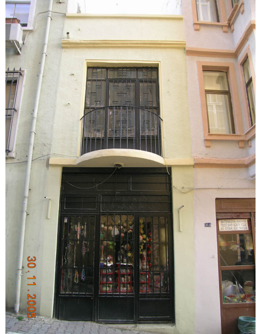
Boğazkesen Yokuşu üzerindeki seçkinleşme öncesi ve sonrası halleri görünen küçük bir işyeri