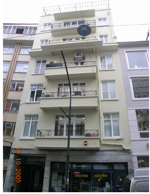
Boğazkesen Yokuşu üzerinde cephesindeki çirkin tabelalardan arınarak temizlenen ve boyanan bir bina