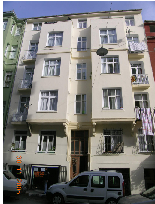
Boğazkesen Yokuşu üzerindeki bir binanın cephesinin tabelalardan arındırılarak boyanmış yeni hali ile önceki durumu