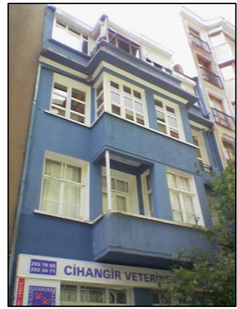
Şekil 5.14: Coşkun Sokak No:12'deki binanın eski ve yeni hali