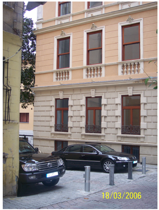
Şekil 5.25: Rizzo'nun Otoparkı