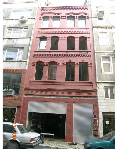
Boğazkesen Yokuşu üzerinde üst katları kullanılmayan eski bir binanın seçkinleştirme esnasındaki hali