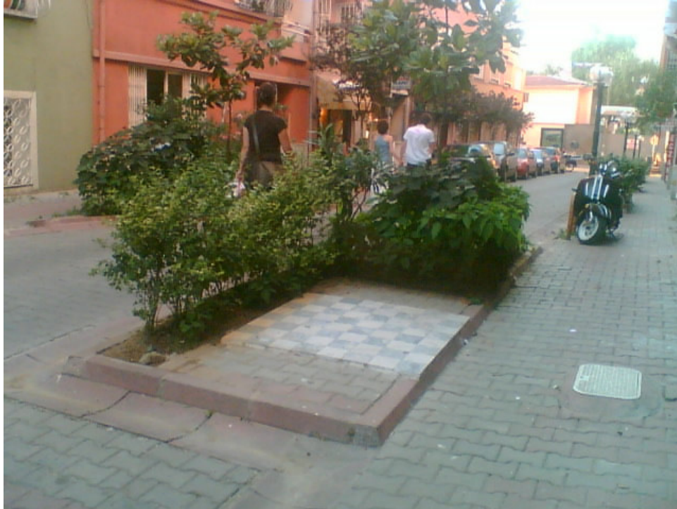
Şekil 5.7: Oba Sokak