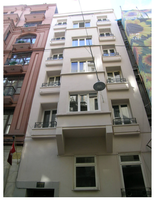
Sıraselviler Caddesi üzerinde çok katlı bir binanın seçkinleştirme öncesi ve sonrası görünümleri