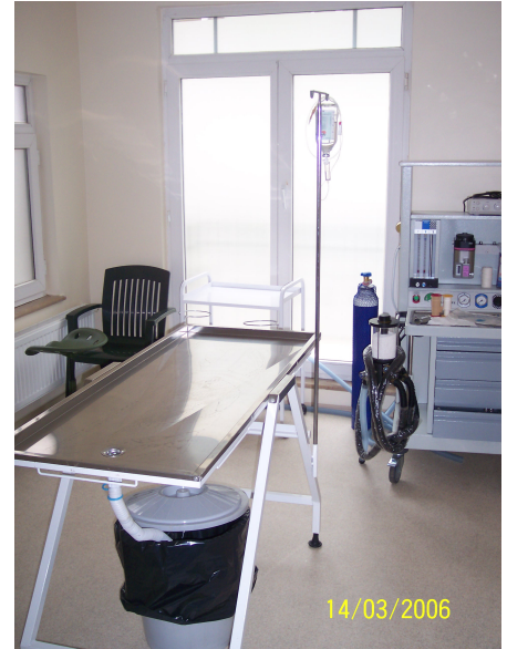
Şekil 5.16: Havyar Sokak'ta konut olarak kullanılan bir binanın seçkinleştirme sonrası işyerine dönüşümü ve iç mekânlarından görünüm