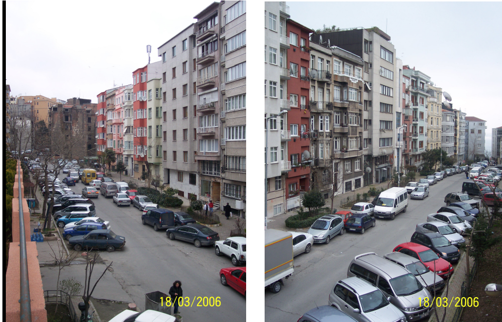
Şekil 5.1: Cihangir Caddesi'nin günümüzdeki durumu

Cihangir Caddesi üzerinde biri kapalı ikisi açık üç tane otopark mevcuttur. Ancak bu sayının dahi yetersiz kalması sonucu yola park eden araçlardan da yasadışı olarak para talep edildiği görülmektedir. Çift sıra park edilen araçlar nedeni ile trafik kesintiye uğramakta ve çirkin bir görüntü oluşmaktadır. Çift sıra park problemi Akyol Caddesi'nde de sık görülür. Tez kapsamında bu cadde incelediğimiz bölümün dışında kalsa da burada yapılacak bir yenileme çalışması, ele aldığımız alanı da olumlu yönde etkileyecektir. Bu caddeyi ortasından ayırmak, geliş ve gidiş yönünde çift sıra parkı engelleyeceği için hem trafik daha rahat akacak hem de çıkan kavgalarla huzuru bozulan semtli artık rahatsız olmayacaktır.