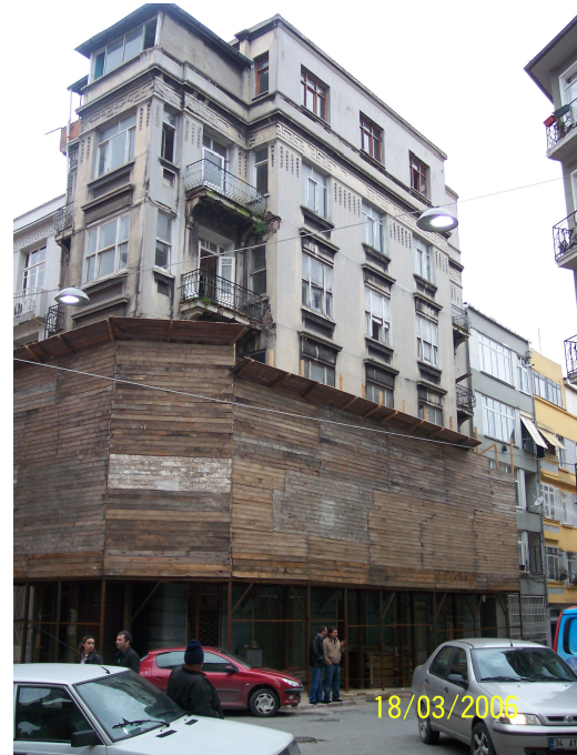
Şekil 5.21: Güçlendirilen Bina (Havyar S.)