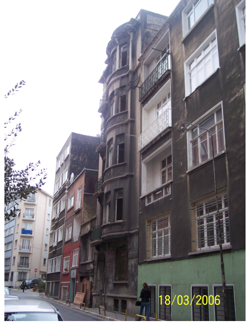
Şekil 5.23: Boş Bina (Susam S.)