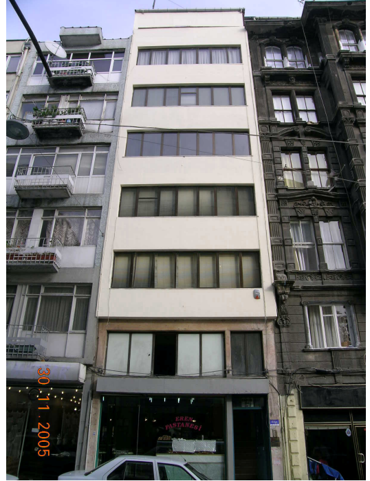
Boğazkesen Yokuşu üzerindeki çok katlı bir işyerinin seçkinleştirme öncesi ve sonrası