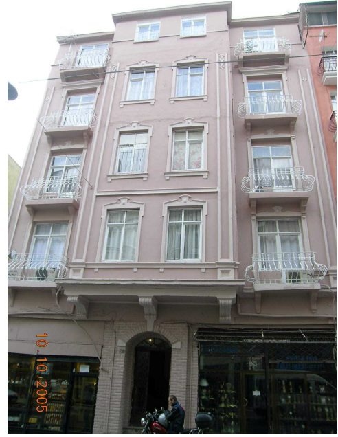
Boğazkesen Yokuşu üzerindeki bakımsız bir binanın seçkinleştirme sonrası temizlenen ve boyanan cephesi