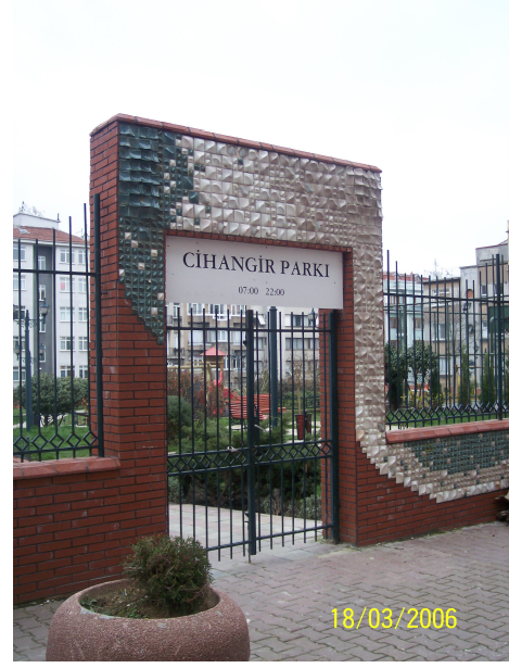
Şekil 5.6: Cihangir Parkı Girişi'nin eski hali ile çalışmalarından sonraki güncel durumu