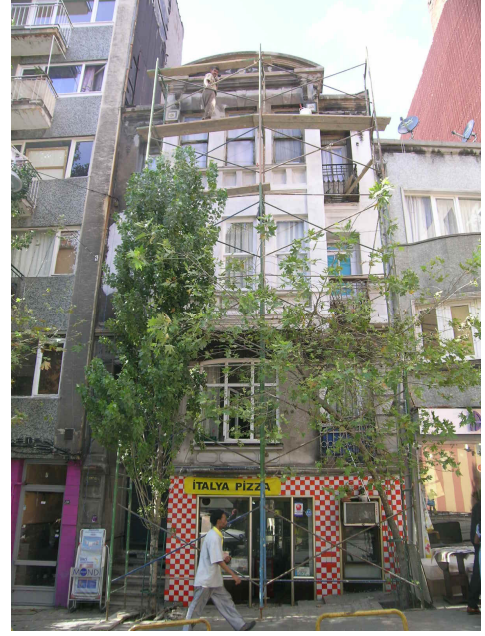
Sıraselviler Caddesi üzerindeki binanın seçkinleştirme önceki durumu ve çalışmalar esnasındaki bir görünümü