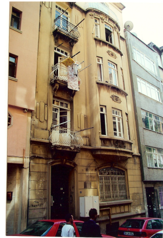
Şekil 5.8: 1990'ların başında Havyar Sokak