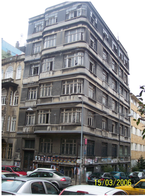
Şekil 5.20: Boş Bina (Akarsu Caddesi)

Bu bölümde seçkinleştirmenin Cihangir'deki mekanları ne şekilde dönüştürdüğü incelenmiştir. Semtin fiziksel dokusundaki iyileşmelere bakıldığında, seçkinleştirmenin hemen hemen tamamlandığı düşünülebilir. Ancak, semtte 90'ların başından itibaren başlayan bu yenileme çalışmalarına rağmen, halen boş ve bakımsız binaların bulunduğu gözlemlenmektedir (Şekil 5.20-22-23). Deprem faktörü ele alınarak yapılan değerlendirmelerle, sağlam olmayan binalarda güçlendirme çalışmaları devam etmektedir (Şekil 5.21). Başka bir örnek, eskimiş binaların yıkılarak yerine yenilerinin yapılmasıdır (Şekil 5.24). Bu inşaat, Cihangir'in gereksinimi olan otopark ihtiyacının bir bölümünü de karşılayacak biçimde inşa edilmektedir. Boş olan binaların kullanılmaya başlamaları ile bölgedeki çevresel kirlilik azalacaktır. Seçkinleştirme sonucu bölgeye son yerleşenlerin, toplumsal bir ayrışmaya neden olmaları ise ayrı bir eleştiri konusudur (Şekil 5.25).