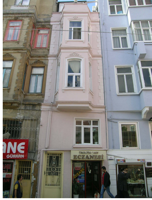
Sıraselviler Caddesi üzerindeki binanın eski görünümü ve bakım sonrası yeni hali