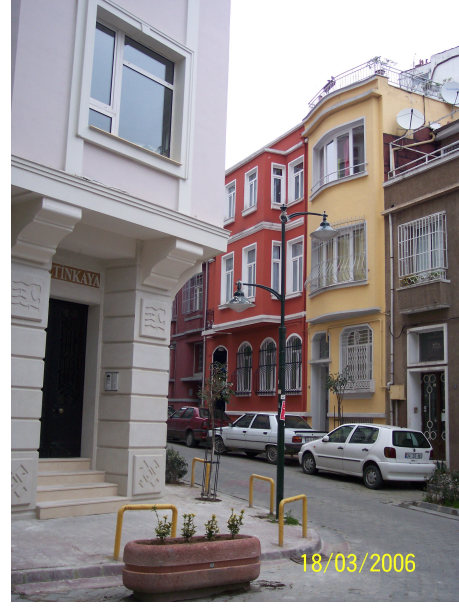
Şekil 5.2: Oba Sokak'taki aydınlatma elemanları (solda) ve Kumrulu Sokak'a 2006 Mart ayında yerleştirilen aydınlatma elemanı

zaman Cihangir'deki seçkinleşme sürecinin devam etmekte olduğu söylenebilir. Belediye ile sıcak ilişkileri bulunan Cihangir Mahallesi Muhtarlığı'nın da yapmak istediği çalışmaların süreci pozitif yönde etkileyeceği kanısına varılabilir.