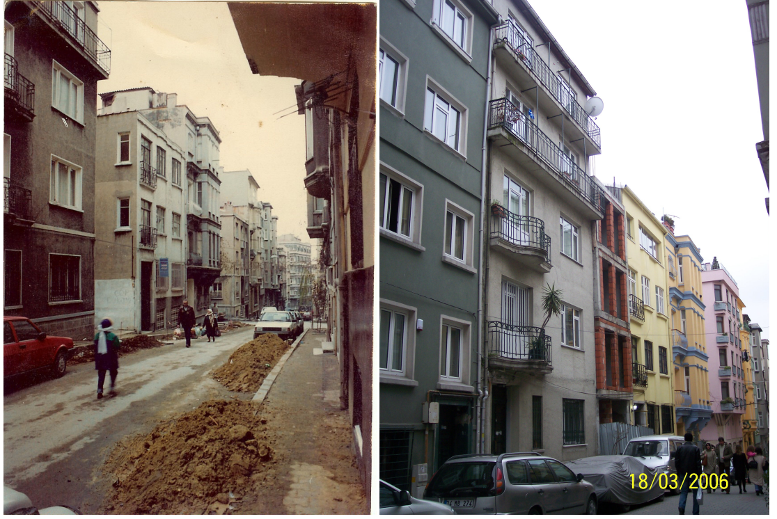
Şekil 5.13: Yürekli-İnceoğlu çiftinin yaşadıkları binanın 1990'ların başındaki eski hali ile 2006 yılındaki durumu

Yukarıdaki iki örnekte de çiftlerin birden fazla konutu birleştirerek tek bir konut haline getirilmesi durumu vardır. Bunun tersi de Cihangir'de görülen bir oluşumdur. Coşkun Sokak'da bulunan 12 numaralı apartman aslında yapılırken tek bir ailenin içinde yaşayacağı düşünülerek tasarlanmıştır. Bina zemin kat dışında 3 kattan oluşmakta,