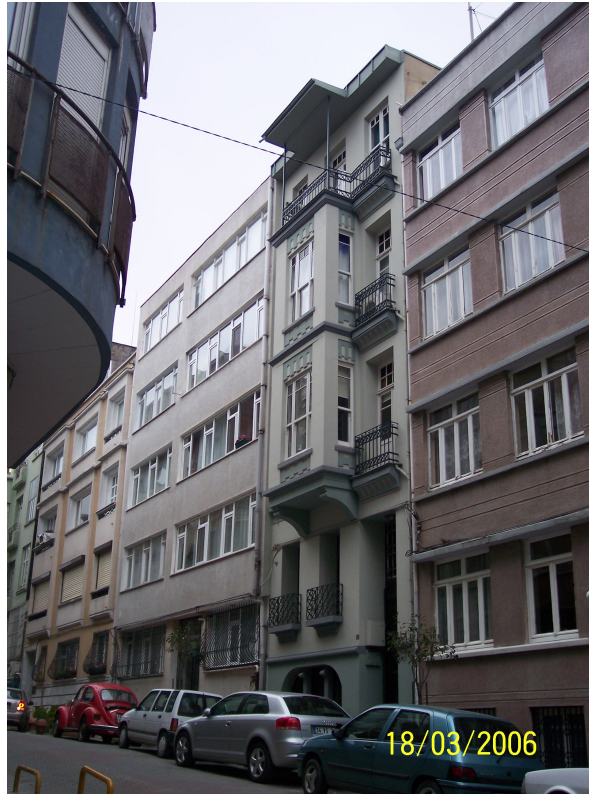
Şekil 5.12: Anılanmert'lerin yaşadıkları binanın güncel hali

Buna benzer bir değişim yine Havyar Sokak'a 1994 yılında taşınan İnceoğlu-Yürekli çiftinin taşındıkları apartmana yaptıkları müdahalede görülebilir. Mimarlık Fakültesi'nde akademisyen olan çift öncelikle taşınacakları apartmana bir kat ekleyerek çatı hizasını yandaki apartmanın seviyesine getirmiş. Sonrasında katları birleştirerek iki katlı evlerine taşınmışlar. Binanın yığma bir bina olması nedeni ile plan şemasında değişiklik yapmadıklarını söyleyen Yürekli, iç mekanlardaki kapıları da yenilemeden orijinal hallerini kullandıklarını belirtmiştir (22.03.2006 tarihinde İpek Yürekli ile yapılan görüşme). Şekil 5.13'de görülen resimlerde sokağın fiziksel karakterindeki değişim çok net olarak algılanır.