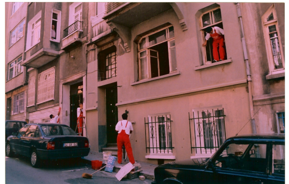
Şekil 5.10: Projedizayn Çalışmaları