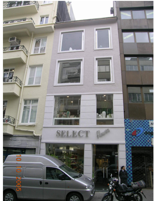
Boğazkesen Yokuşu üzerindeki bir konutun seçkinleşme önceki işyeri olarak kullanılan durumu ve sonrasında ki dönüşüm