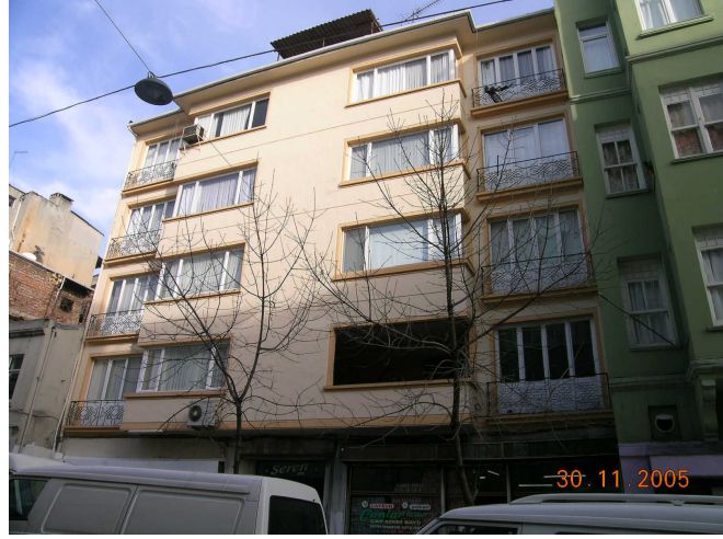
Boğazkesen Yokuşu üzerindeki bir apartmanın eski durumu ile seçkinleştirme sonrası bakımlı yeni hali