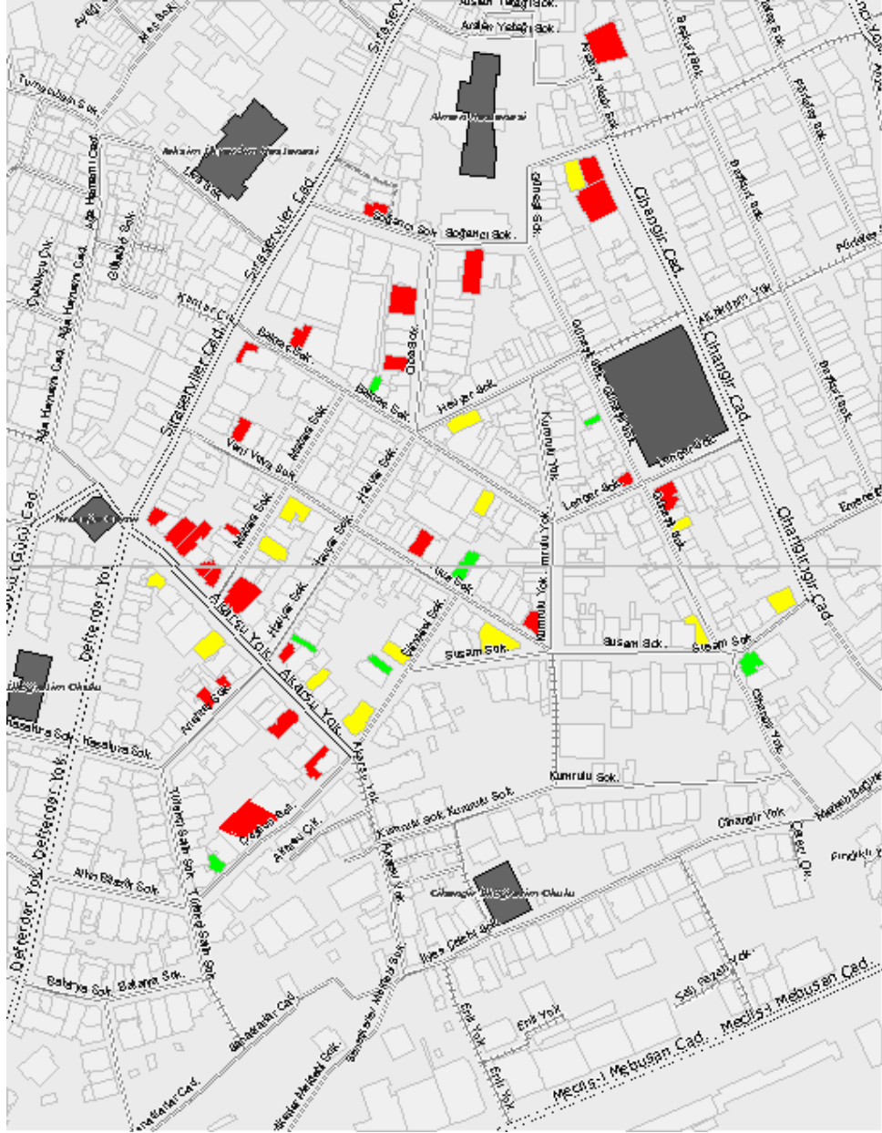
Şekil 5.18: Cihangir'deki bina giriş katlarındaki kullanımlar