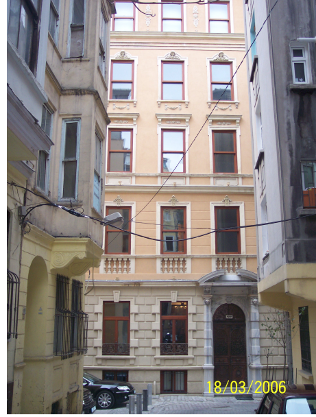
Şekil 5.19: Rizzo Apartmanının Girişi (solda) ve genel görünümü (sağda)