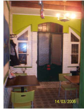
Şekil 5.17: Matara Sokak'taki eski bir Rum evinin seçkinleştirme sonrası bir kafeye dönüştürülmesi ve iç mekândan görümleri

Matara Sokak'ta bulunan 7 numaralı bina ise seçkinleştirme öncesi kullanılmayan bir Rum evi iken, burayı kiralarak bir kafeye dönüştüren işletmecisi, iç mekanlarda binanın orijinalini bozmadan bir restorasyon çalışması yaptırmış. Günümüzde binanın bodrum katı kafeye servis veren mutfağı barındırmaktadır. Giriş katı ile üst kat ise seçkinleştiricilere ve Cihangir'i ziyaret edenlere hizmet vermektedir.