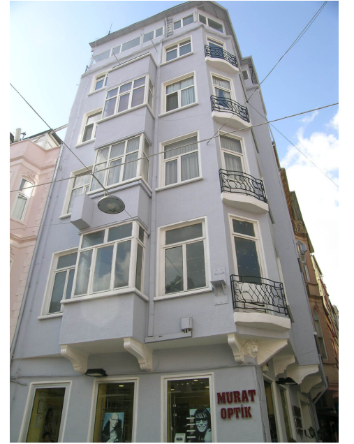
Sıraselviler Caddesi üzerindeki binanın seçkinleştirme öncesi ve sonrası görünümleri