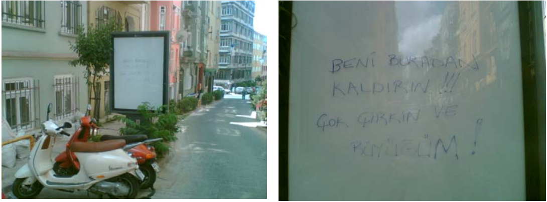
Şekil 6.1: Cihangir'deki sokaklara yerleştirilen reklam panoları

Coşkun Sokak, Cihangir Caddesi ve Akyol Caddesi en problemli noktalardır. Cihangir Muhtarlığı'nın analiz ederek ortaya koyduğu ve Beyoğlu Belediyesi'ne ilettiği bu sorunların çözümlerinin üretilmesi ile semt yaşamı daha uygar bir seviyeye çıkacaktır. 2006 yılının Mayıs ayında sokaklara reklam panolarının yerleştirilmesi de seçkinleştirmenin bir etkisi olarak görülebilir. Semtle uyum içerisinde olup olmadığı tartışma konusu olan panolara reklam afişleri yerleştirilmeden önce bir kişi, ' Beni buradan kaldırın, çok çirkin ve büyüğüm! ' yazarak tepkisini dile getirmiştir. Güvenlik için bazı sokaklarda kamera uygulanmaya başlanacak olması ise Cihangir'de seçkinleştirmenin son uzantısı olarak karşımıza çıkacaktır.