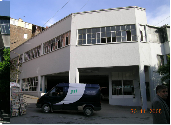
Boğazkesen Yokuşu üzerindeki otoparkın seçkinleştirme öncesi ve sonraki durumları