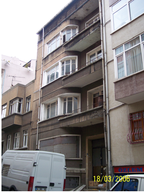
Şekil 5.22: Mühürlü Bina (Matara S.)