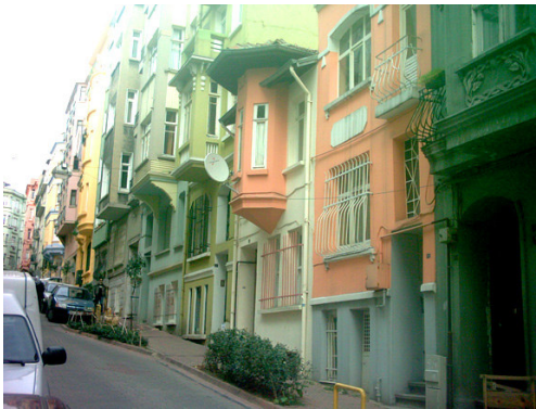
Şekil 5.9: Günümüzde Havyar Sokak