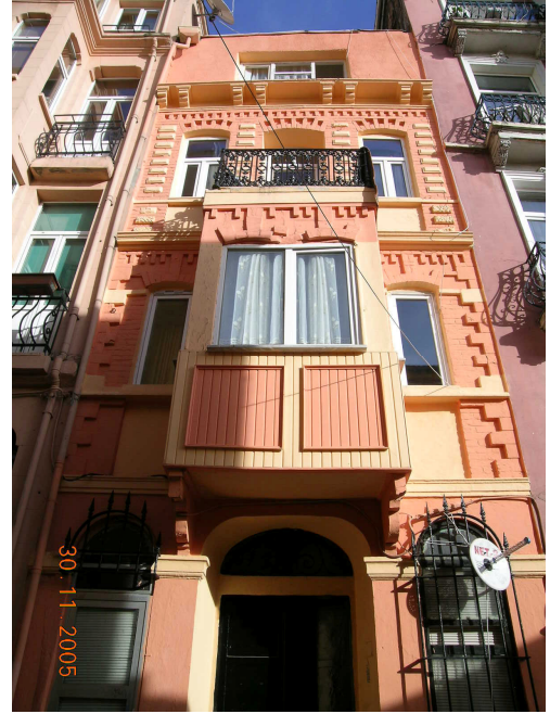
Boğazkesen Yokuşu üzerindeki bakımsız bir konutun seçkinleştirme sonrası ortaya çıkarılan mimari karakteri