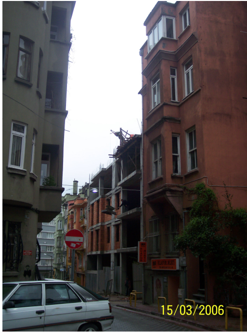
Şekil 5.24: Yeni Bina (Bakraç S.)