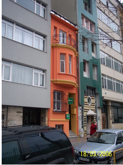
řekil 5.15: Cihangir Parkı (üřtte) ve Güneřli Sokak'ta seçkinleřtirme sonrası işyerine dönüřen eski bir konut