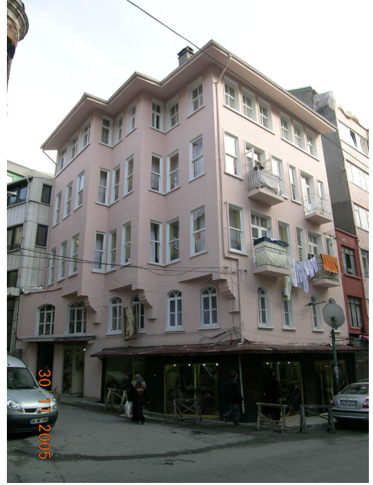
Seçkinleştirme öncesi ve sonrası durumu görünen Boğazkesen Caddesi üzerinde ki bir bina