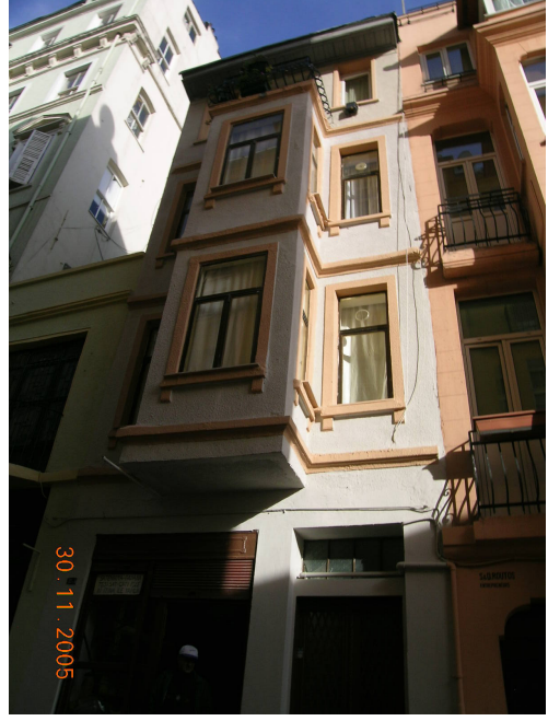
Boğazkesen Yokuşu üzerindeki yapıldığı yıllardan beri bakım görmemiş bir binanın seçkinleştirme öncesi ve sonrası