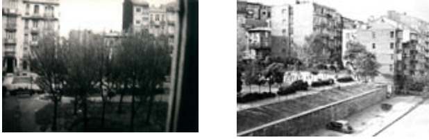
Şekil 5.3: Cihangir Parkı'nın 1983 yılında kat otoparkı yapılmadan önceki halleri

yeni, çağdaş, çocukların ihtiyaçlarını göz önüne alan ve çocuk sağlığı açısından güvenli bir ortam oluşturacak bir yenileme planı hazırlamaya karar verdiler. Mimar Bereket Uluşahin'in mimari katkılarıyla hazırlanan yeni yenilenme planına göre dünyada ve Türkiye'de gelişen yeni oyun parkı tasarımlarına yer veren, küçük çocuklarla büyük çocukların oyun alanlarını ayırarak iki taraf için de daha güvenli ve özgür alanlar yaratan, mahalledeki sanatçı katılımıyla çocuklara yönelik işlevsel sanat tasarımlarına yer veren, estetik kaygısı güdülmüş, spor alanlarının köpek gezdirme alanı olmaktan çıkarılarak kullanılır, köpek gezinti alanının ise uygun koşullarda yeniden düzenlenerek parkın diğer bölümlerinden bağımsız hale getirildiği, parkın içinde beslenen ve insan sağlığını tehdit eden kedilerin yeni bir projeye Roma Bahçesine taşındığı, yürüme yolları, amfiteatr ve park mobilyalarının elden geçirildiği ya da yenilendiği, ağaçlandırma ve yeşillendirmenin yeniden ele alındığı ve bitişiğinde bulunan aslında park arsasına dahil olan merdivenlerin yeniden düzenlendiği bir park yaratmak amaçlanmıştır.