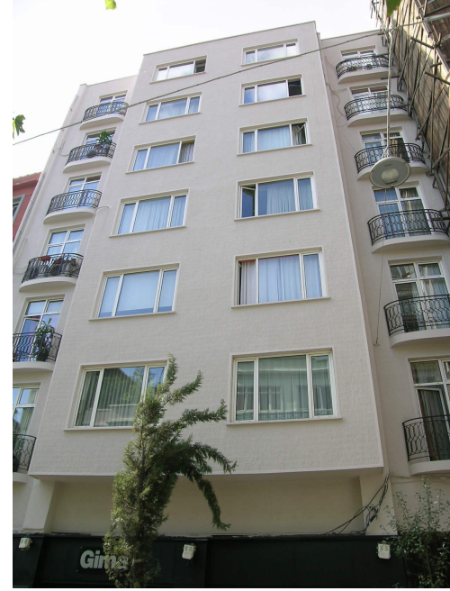
Sıraselviler Caddesi üzerindeki bir apartmanın seçkinleştirme öncesi ve sonraki halleri