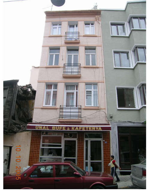
Boğazkesen Yokuşu üzerindeki bir binanın seçkinleştirme öncesi kirliliği ve sonraki temizlenmiş hali