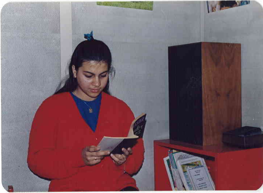
RESİM 2 : HASTANIN TEST ESNASINDA POZİSYONU.