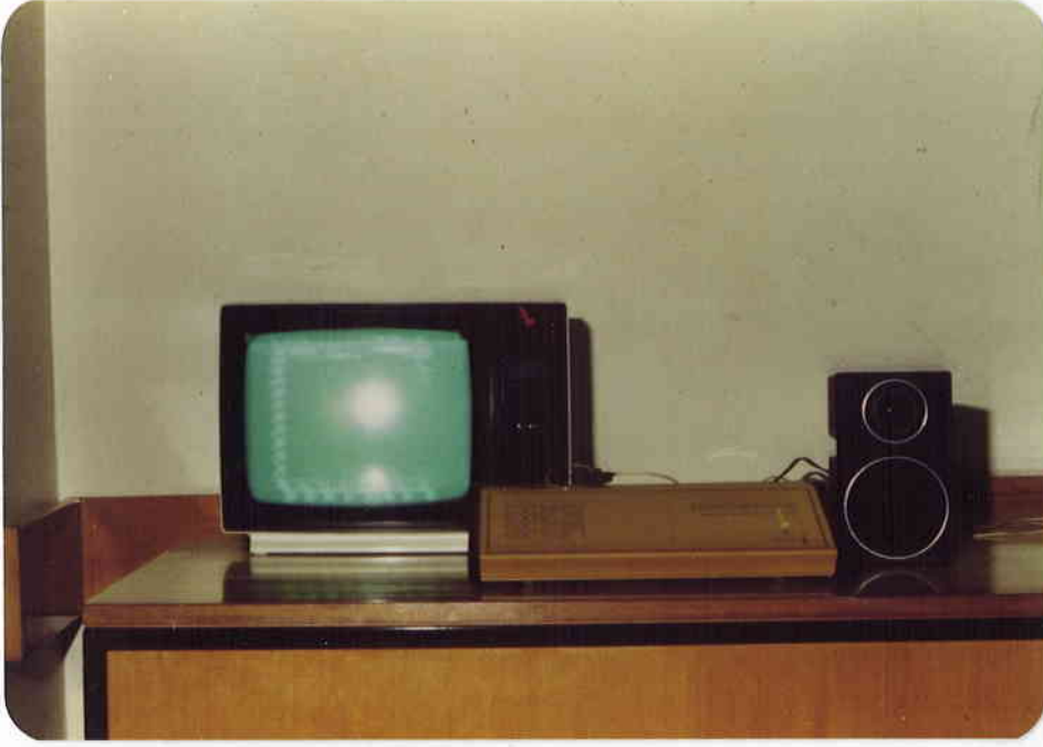
RESİM 1 : RASTRONICS CCI-10 ALETİ.