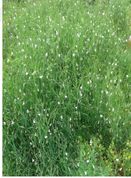
Şekil 3.1 a, b, c. Denemede kullanılan genotipler sırasıyla Gap mavisi, Karadağ çeşitleri ve Popülasyon