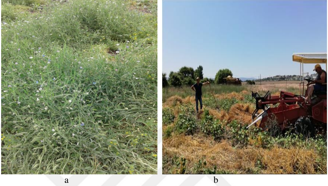
Şekil 3.4 a, b. Denemede yeşil ot ve tohum için hasat zamanları

olmuştur (Şekil 3.4 b). Hasattan sonra elde edilen tohumlar Bruchus zararlısına karşı 1 hafta fostoksin ile fümige edilmiştir.