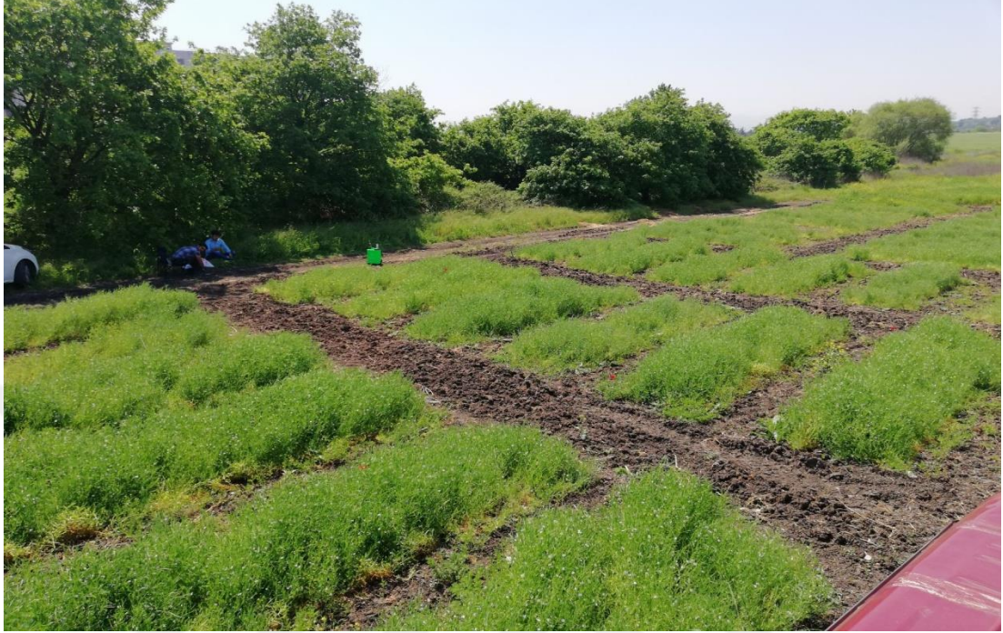
Şekil 3.3. Deneme alanından genel bir görüntü.

Denemede parsel uzunluđu 5 m, bir parseldeki sıra sayısı 6 ve sıra arası mesafe 20 cm olmuştur. Deneme parselleri 6 m 2 (1.2 x 5) olmuştur (Şekil 3.3).