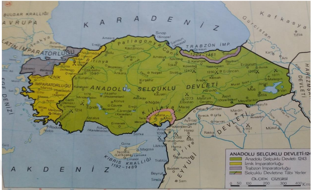
Harita 1. Türkiye Selçuklu Devleti Haritası.

Hüseyin Dağtekin, Genel Tarih Atlası , İstanbul 1983, s. 42.