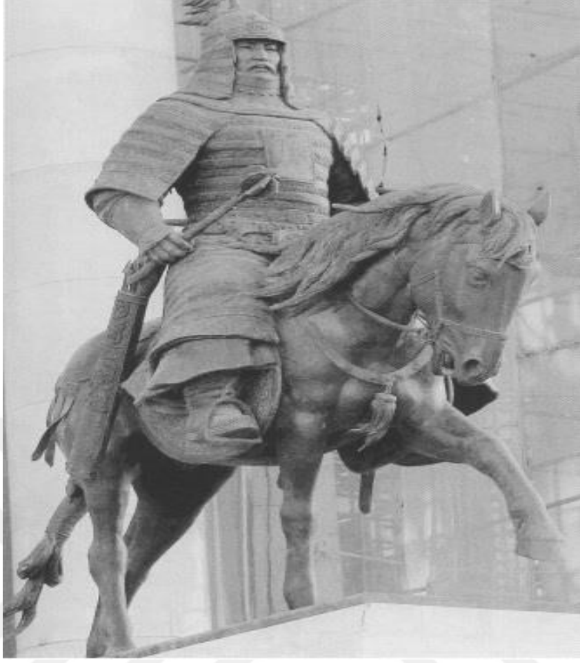
Resim 3: Moğol süvarisinin zırh ve silah teçhizatını gösteren modern bir heykel. (Sukhbaatar, Ulan Batur). Bkz; Mehmet Fuat Tufan; CENGİZ HAN , İstanbul,2010, s.11.