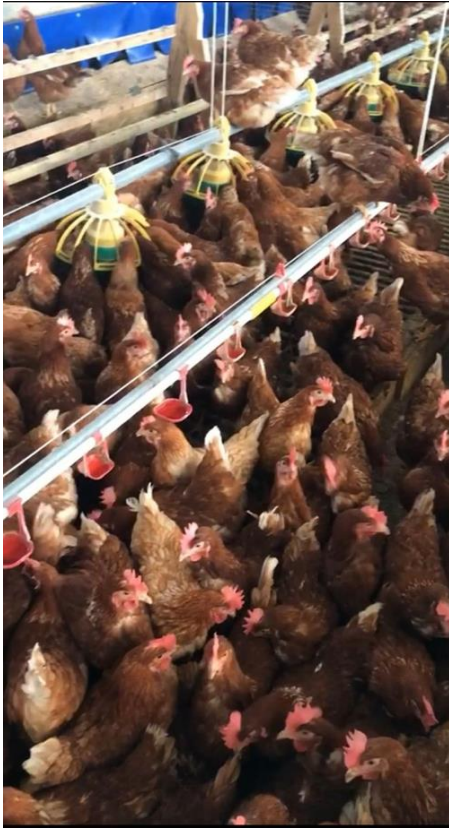
Resim 2.2. Free-range sistem (a, b, c, d)