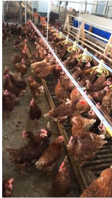
Resim 2.3. Free-range sistemde tavuklar